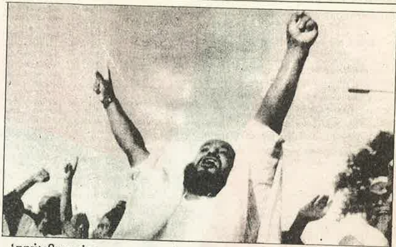
'தாஸ்லிமாவுக்கு மரணதண்டனை வழங்கு! பங்களாதேஷ் மதவெறியர்கள் ஆர்ப்பாட்டம்'

குரான் காலத்துக்கு ஒவ்வாதது என்று ஒருவர் விமரிசித்தால் காது கொடுத்து முல்லாக்கள் முதலில் கேட்கட்டும். குரான் காலத்தில் அடிமைத்தனம் இருந்தது; தோற்கடிக்கப்பட்ட நாடுகளில் கிடைக்கும் பெண்களை 'சட்டப்படி உரிமையாக்கிக் கொள்ள' (வசனம் 33:50) அனுமதி கொடுக்கிறது குரான். முஸ்லீம் பேரரசில் வெள்ளமனப் பெருகிய அடிமைகள் பற்றி வரலாறு ஏராளமாகக் கூறுகிறது. மூலா பின் நுஸைர், ஆப்பிரிக்காவிலிருந்து 3 லட்சம் அடிமைகளைப் பிடித்து வந்ததும், ஸ்பெயினில் காதிக்க (GOTHIC) பிரபுக்கள் குடும்பங்களிலிருந்து 30,000 கன்னிப் பெண்களைக் கைப்பற்றியதும் வரலாறு. அடிமைகளைச் சட்டப்படி உரிமையாக்கிக் கொள்ள குரான் வழங்கும் அனுமதி இப்போது செல்லுமா? அதை அமல் படுத்தக் கோருவார்களா இந்த மதவெறியர்கள்? முகமது நபி காலத்திலேயே இருந்தாலும், அடிமைத்தனம் சகோதரபாசத்துக்கு நேர் எதிர் அல்லவா? இது ஒரு சோற்றுப்பதம்தான்.