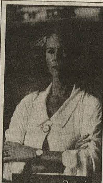
வெறும் வார்த்தைகள் தானா?

காதீன் மெக்கின்னான் - அமெரிக்காவைச் சேர்ந்த சட்டவியல் கோட்பாட்டு வல்லுனர்; பெண் விடுதலை இயக்கம் சார்ந்தவர். "வெறும் வார்த்தைகள்தான்" (Only Words) இது இவர் சமீபத்தில் எழுதி வெளியிட்டுள்ள நூல்.