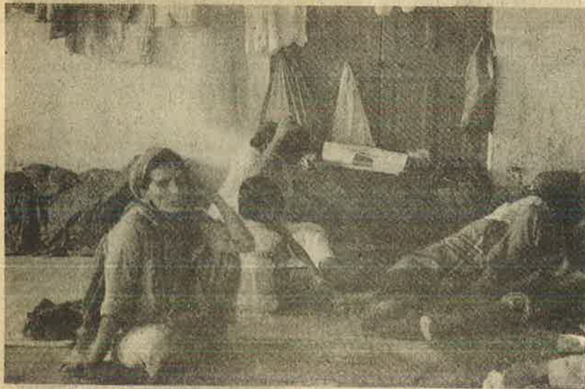
பம்பாய் ஹைடாய்களின் விடுதி இன்று 3000 குழந்தைகளின் இல்லம்

சிறித்தவர்களையும் மிரட்டி வாய்ப்பு தற்காக சிறித்தவர்களுக்கு எச்சரிக்கை முஸ்லிம்களுக்கு யாரும் அடைக்கலம் கொடுக்கக் கூடாது" என்று சிவசேனா ஆய காங்கே தட்டிகள் வைத்தது.