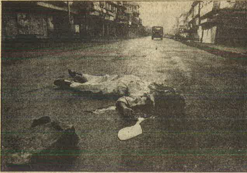
பம்பாய்: கொலை செய்யப்பட்டவர் - முஸ்லீம். கொலைக்குப் பயன்படுத்திய - ஆயுதம் அருகிலேயே, கொலையாளிகள்?

என்று அந்தக் கும்பலில் ஒருவன் மற்றவர்களுக்கு அறிவுரை சொல்லிக் கொண்டிருந்தான்.