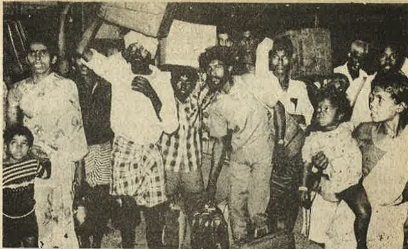
திருநெல்வேலியில் வந்து இறங்கும் பம்பாய் தமிழ் (இந்து) அகதிகள்