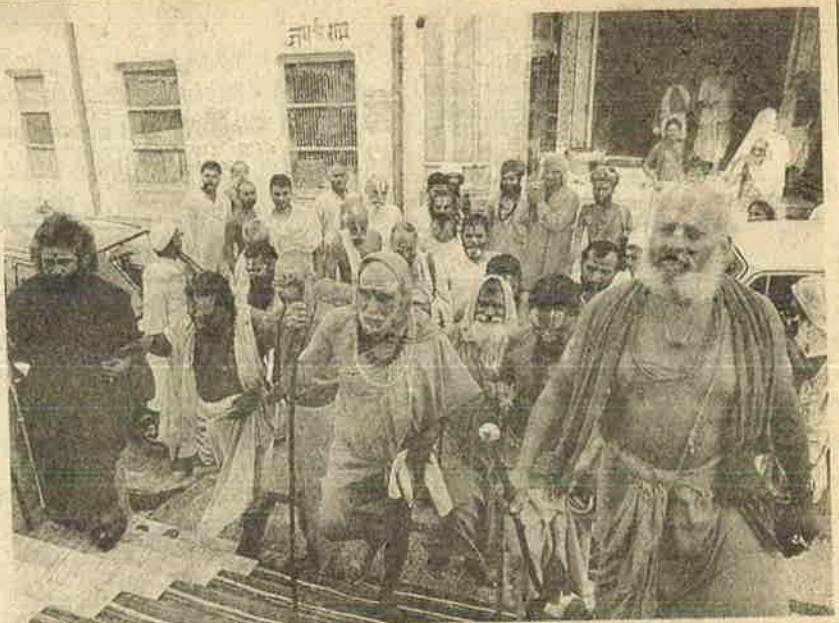
பார்ப்பனப் பண்டாரங்களின் கெக்கலிப்பு— வெற்றியப் படக்கட்டுகளா?

வலது மகுடம் பிற்பகல் 2-45க்கும், இடது மகுடம் பிற்பகல் 3-45க்கும் வீழ்த்தப்பட்டன. சுற்றச்சுவரும், உள் சுவர்களும் மென்மென்மென்மென் சரியத் தொடங்கின: 4.55 க்கு மத்திய மகுடத்தின் மீது இரும்புக் கொக்கி இணைந்த நீளமான கயிறு வீசப் பட்டு, மகுடம் இழுத்து எறியப்பட்டது. சூரியன் மறைந்த அந்த நேரம் - பாபரி மசூதி