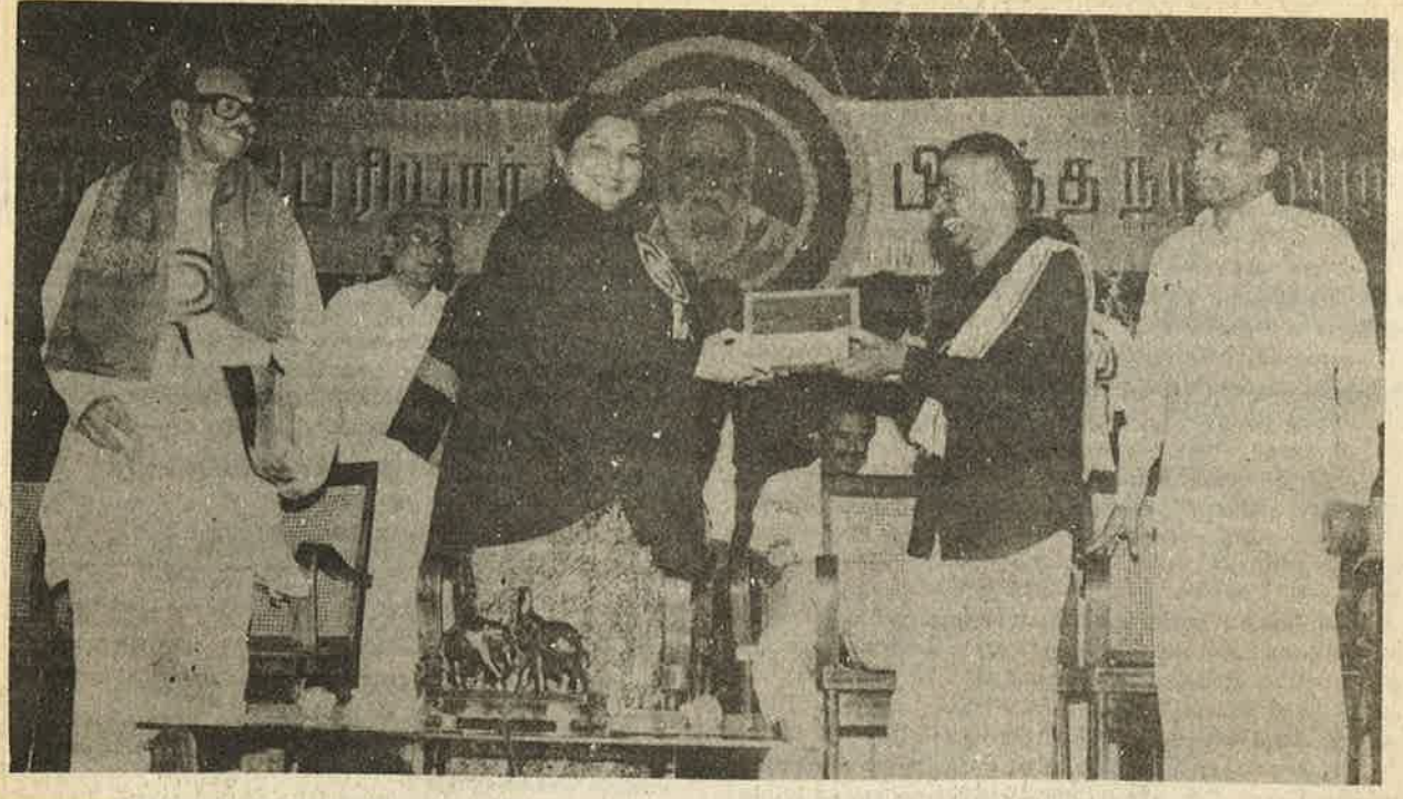
ஒரு பார்ப்பனர் நாத்திகனாக இருந்தால்கூட உங்கள் இயக்கத்தில் சேர்க்காமாடமார்களா?

நிச்சயமாக சேர்க்க மாட்டோம். அந்த ஊடுருவலில் ஆபத்து அடங்கி இருக்கின்றது. இன்றைக்கு அ.இ.அ.தி.மு.க-வின் கதி என்ன? ஜெயலலிதா என்ற பார்ப்பனப் பெண் அதில் ஊடுருவி உள்ளாளுக்குள் இருந்தே கட்சியை உடைத்துவிட்டார். அரசியலில் வேண்டுமானால் இவைகள் நடக்கலாம். ஆனால் எங்கள் இயக்கத்தில் எங்களால் அனுமதிக்க முடியாது. ஆனாலும் தனிப்பட்ட முறையில் எந்த பார்ப்பனரும் எங்களுக்கு எதிரியல்வ.