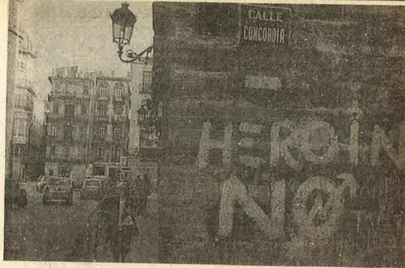
ஸ்பெயின்: போதைப் பொருள் எதிர்ப்பு சுவரெழுத்துக்கள்

இவையனைத்தையும்விட ஸ்பெயின் மக்களை துன்பத்திலாழ்த்தும் பிரதான விசயம் போதை மருந்துப் பிரச்சினைதான். தென் அமெரிக்காவின் கொகேயன், வட ஆப்பிரிக்காவின் ஹரீஷ், மத்திய கிழக்கின் ஹெராயின் - ஆகியவற்றின் புகலிடமாகி விட்டது ஸ்பெயின். உலகின் மிகப்பெரும் போதை மருந்து கடத்தல் கும்பலான மெடல்வின் காட்டல் ஸ்பானிய அதிகார வர்க்கத்தில் கணிசமான கையாட்களை வைத்திருக்கி