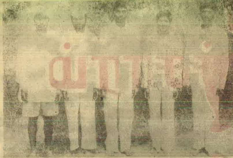
மலத்தைத் தின்னச் சொல்லி சாதி வெறியர்களால் சித்திரவதை செய்யப்பட்ட இளைஞர்கள்.