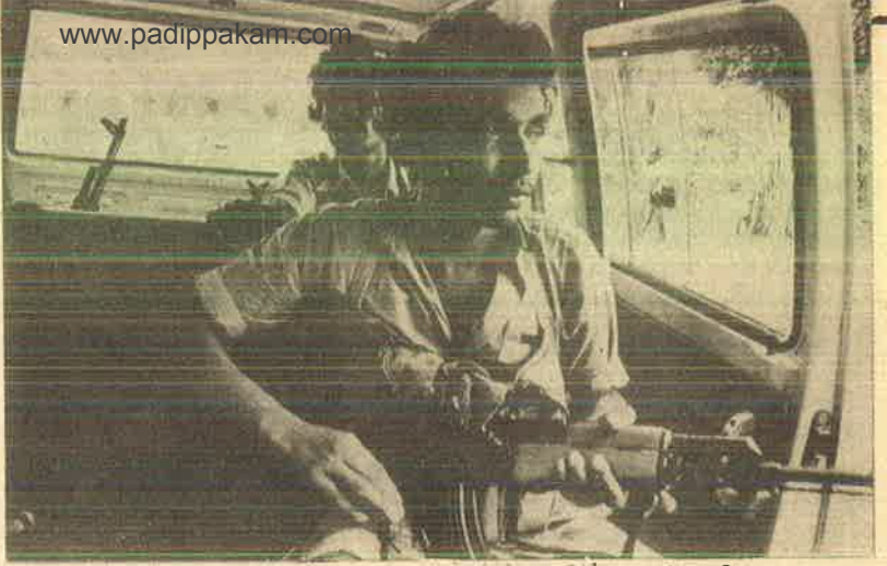
என் டி. எல். எஃப். இந்திய இராணுவ கைக்கூலி

மக்கள் நிலை பெருந்துயரமானது—மின் சக்தி, நீர், உணவுத் தட்டுப்பாட்டுடன் காயம்பட்ட மக்கள் மாட்டுவண்டிகளில் குறுக்குச் சாலைகளில் ஓடினார்கள். இரவு பகலாக யுத்தப் பகுதியை விட்டு வெளியேறிய மக்களையுட்கூட இந்திய டாங்கிகள் சுட்டுக் கொன்றன. பல இடங்களில் சிதைக்கப்பட்ட உடல்களையும், மனம் பேதலித்து அலைந்து கொண்டிருந்த மனிதர்களையும் நாங்கள் கண்டோம்.