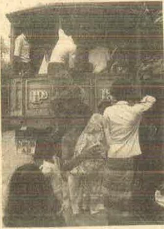
தாக்குதலிலிருந்து தப்பிக்க ஊரை விட்டு ஓடும் ஈழத் தம்பும் மக்கள்.

அக்டோபர் 24ம் தேதி பொய்ப் பிரச்சாரக் கருவியான இந்திய வானொலி யாழ்ப்பாணத்தை இராணுவம் கைப்பற்றியதாகக் கூறியது. ஆனால் அன்றுதான் யாழ்ப்பாண நகரை விட்டு நாங்கள் வெளியேறி