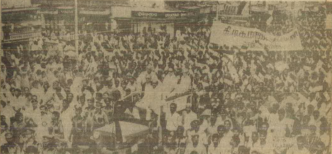
திமுகவின் பேரணி—நீர்த்துப் போன அரசியல்.

அப்படியானால் அமெரிக்கா வியத்நாம்மீது படையெடுத்ததும் சரிதான். இந்தியா பிஜிமீது படையெடுத்தால் அதுவும் சரிதான். இப்போது இந்தியா இலங்கையீது படையெடுத்திருப்பதும் சரிதான். (தவறு என்றால் இந்தியப் படையை வரபஸ் வாங்கு என்றல் லவா கேட்க வேண்டும். ஆனால் கழகங்கள் கேட்பது போர் நிறுத்தம் மட்டும்தானே.) ஆனால் தமிழர்களைக் கொல்கிறார்களே அது தான் தவறு. சிங்கள மக்களைக் கொன்றிருந்தால் கழகங்கள் வாய்