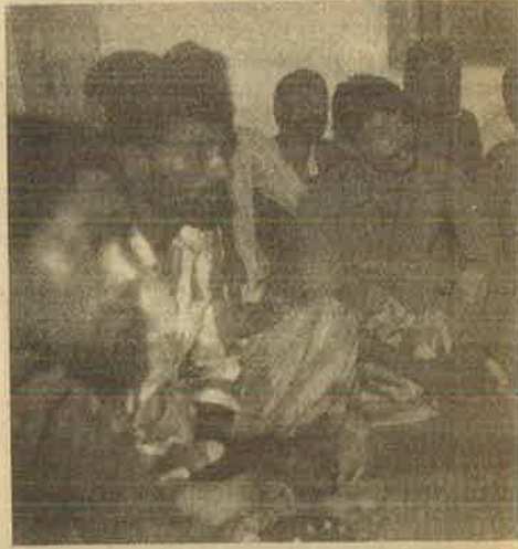
விடுதலைப் புலிகள் இந்திய சிப்பாய்களை “இவர்கள்...”