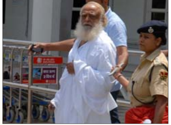
சிறைச்சாலையிலும் சுகபோகமாக வாழும் அளவிற்குச் செல்வாக்கு கொண்ட கார்ப்பரேட் சாமியார் அசாராம் பாபு.

விற் கு உள்ளா னதை உறுதி செய்த தன் பின்னர்தான் இந்தச் சாமியாருக்கு எதிரான முதல் தகவல் அறிக்கையை போலீசார் பதிவு செய்தனர்.