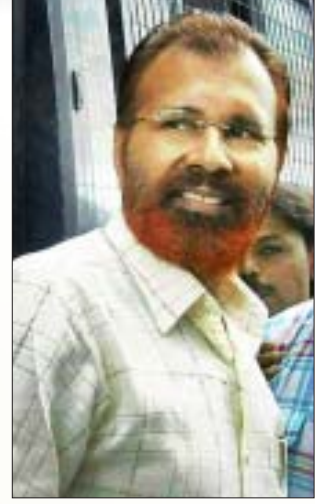
மோடியின் உத்தரவுப்படி போலி மோதல் படுகொலைகளை நடத்திய காக்கிச்சட்டை கிரிமினல் டி.ஜி.வன்சாரா.

படுகொலை, பல் வேறு ‘மோதல்’ படுகொலைகள், தீவிரவாத எதிர்ப்பு என்ற பெயரில் முசுலீம்களுக்கு எதிராகக் கட்டவிழ்த்து விடப்பட்ட அரசு பயங்கரவாத நடவடிக்கைகள் ஆகியவை குறித்த அனைத்து மர்மங்களையும் அறிந்தவர். இப்படி பட்ட பின்னணி கொண்ட டி.ஜி.வன்சாரா, தனது பதவி விலகல் கடிதத்தை சுய வாக்குமூலம் போலவே அளித்துள்ளார்.