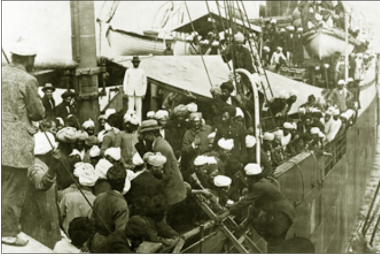
கனடாவில் குடியேறவிடாமல் தடுக்கும் ஏகாதிபத்தியவாதிகளை எதிர்த்து வான்கூவர் துறைமுகத்தில் நங்கூரமிட்டு “காமகட்ட மாரு” கப்பலில் போராடும் இந்தியர்கள். (கோப்புப்படம்)

“தேவை: புரட்சி செய்ய விருப்பமுள்ள இளைஞர்கள்; ஊதியம்: மரணம்; பரிசு: வீரத்தியாகி என்ற பட்டம்; ஓய்வுதியம்: இந்திய விடுதலை; பணியாற்றும்பிடம்: இந்தியா.”