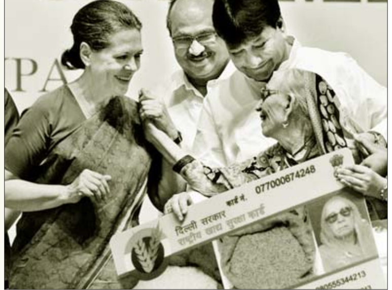
தில்லியில் நடந்த விழாவொன்றில், உணவுப் பாதுகாப்பு அடையாள அட்டையை ஒரு வயதான தாய்க்கு வழங்கும் சோனியா காந்தி.

கடந்த ஆண்டில் (2012-13) மட்டும் கார்ப்பரேட் நிறுவனங்களுக்கு 5,28,163 கோடி ரூபாய் வரிச்சலுகையாக அளிக்கப்பட்டுள்ளது. கடந்த எட்டு ஆண்டுகளை எடுத்துக் கொண்டால், அக்கும்பலுக்குக் கொட்டி அளக்கப்பட்டுள்ள வரிச் சலுகை 31,11,169 கோடி ரூபாயாகும். இதே எட்டு ஆண்டுகளில் பணக்காரவர்க்கம் தங்க மற்றும் வைர நகைகளை வாங்கிக் குவிப்பதற்கு அளிக்கப்பட்டுள்ள வரிச்சலுகை 3,14,456 கோடி ரூபாயாகும். இந்த வரிச் சலுகைகளோடு ஏழை மற்றும் நடுத்தர மக்களுக்குத் தரப்படும் உணவு மானியத்தை ஒப்பிட்டுப்