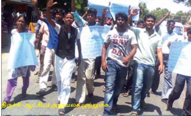
திருச்சி-ஆட்சியர் அலுவலக முற்றுகை.