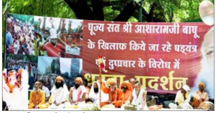
இந்து மதவெறி சாமியார்கள் கூட்டம் அசாராம் பாபு கைது செய்யப்பட்டதைக் கண்டித்து டெல்லி-ஜந்தர் மந்தர் பகுதியில் நடத்திய ஆர்ப்பாட்டம்.

அசாராமின் அயோக்கியதனம் அம்பலப்பட்ட பின்னரும் கூட இந்தக் காவிக் கூடாரம் அவரைக் கைவிட மறுக்கிறது. அசாராம் உண்மையானதுறவி என்றும் அப்பாவி என்றும் வி.இ.ப.வின் சர்வதேச செயல் தலைவர் பிரவீன் தொகாடியாக கூறுகிறார். வி.இ.ப.வின் முன்னாள் சர்வதேச தலைவர் அசோக் சிங்காலோ, அவரது கைது இந்து மதத்திற்கெதிரான தாக்குதல் என்கிறார். பா.ஜ.க.வின் துணைத் தலைவர் உமா பாரதி, இது காங்கிரசின் அரசியல் பழிவாங்கும் நடவடிக்கை என்கிறார்.