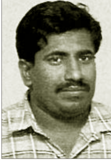
புலித் தலைமையால் இரகசியமான முறையில் படுகொலை செய்யப்பட்ட அவ்வியக்கத்தின் தளபதிகளுள் ஒருவரான மாத்தையா (கோப்புப்படம்)

“கூறப்பட்ட அனைத்தையும் தொகுத்துப் பார்த்தால், விடுதலைப் புலிகளின் அமைப்பு தேசிய இன ஒடுக்குமுறையை எதிர்த்து விடாப்பிடியாகப் போரிட்டது. அதே நேரத்தில் அது ஜனநாயக மறுப்பு மற்றும் எதேச்சதிகார முறைகளைக் கடைப்பிடித்தது என்பதைக் காணலாம். விடுதலைப் புலிகள் அமைப்பு ஜனநாயக மறுப்பு மற்றும் எதேச்சதிகார முறைகளையே கடைப்பிடிப்பதன்காரணமாகவே அதை இந்திய மேலாதிக்கவாதிகளுடனோ அல்லது பாசிச ஒடுக்கு முறையாளனான பிரேமதாசா அரசுடனோ பாட்டாளி வர்க்க இயக்கம் சமப்படுத்திப்பார்க்கலாமா? கூடாது.” (பக்.167,168) என்கிறது, சமரன் குழு.