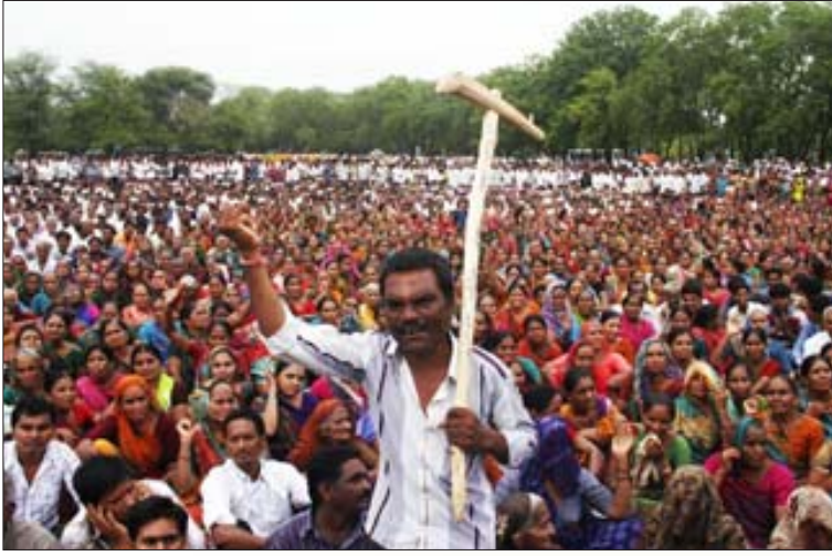
ஆகஸ்டு 15 அன்று ஹன்சால்பூரில் “மாருதியே வெளியேறு!” எனும் முழக்கத்துடன் மோடி அரசின் சிறப்பு முதலீட்டுப் பிராந்தியத் திட்டத்தை எதிர்த்துப் போராடும் விவசாயிகள்.

சேர்க்கப்படும். பறிக்கப்படும் நிலத்தின் பரப்பளவில் 60 சதவீத அளவுக்கு மட்டுமே விவசாயிகளுக்கு அரசு இழப்பீடாக அளிக்கும். எஞ்சிய 40 சதவீதப் பரப்புக்குச் சமமான நிலம், இப்பிராந்தியத்துக்கு வெளியே மாநிலத்தின் ஏதாவதொரு இடத்தில் வழங்கப்படும். இதன்படி, ஹன்சால்பூரில் பரம்பரையாகச் சாகுபடியிலிருக்கும் நிலங்களை ‘தரிசு’ நிலம் என மோசடியாக வகைப்படுத்தி மாருதிக்கு தாரைவார்த்திருந்தது, மோடி அரசு. தற்போது ஹன்சால்பூரின் ஒருபக்கம் மாருதி நிறுவனத்தால் வேலியிடப்பட்டுள்ளது. மண்டல்-பேச்சராஜி சி.மு.பிராந்தியத்தால் இன்னொரு பக்கம் வேலியிடப்படவுள்ளதால் இக்கிராமம் பிற ஊர்களிலிருந்து துண்டிக்கப்பட உள்ளது.