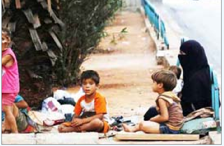
லெபனான் தலைநகர் பெய்ரூட்டிற்கு அகதியாக ஓடிவந்த சிரிய குடும்பம், நடைபாதையோரத்தில் தங்கியிருக்கும் அவலக் காட்சி.

மீண்டும் கைப்பற்றிவிட்டன. இந்த நிலையில் சிரியாவில் நேரடியாகத் தலையிட்டால் அன்றி ஆட்டத்தில் மாற்றத்தைக் கொண்டுவர முடியாது என முடிவெடுத்த மேற்குலக ஏகாதிபத்திய அரசுகள், அதற்கு ஏற்றபடி சிரிய அரசு வசமுள்ள இரசாயன ஆயுதங்கள் குறித்துப் பீதியூட்டத் தொடங்கின. இதன் தொடர்ச்சியாக, அலெப்போ நகரை இரசாயன ஆயுதங்களைக் கொண்டு சிரிய அரசு தாக்கியதாக அல்-நுஸ்ரா குற்றஞ்சாட்டியது. ஐரோப்பிய யூனியன் இதைச் சாக்காகக் காட்டி, எதிர்த்தரப்புக்கு ஆயுதங்கள் வழங்குவதற்கு விதிக்கப்பட்டிருந்த பெயரளவுக்கான தடைகளையும் நீக்குவதாக அறிவித்தது. சிரியாவில் அமைதியை ஏற்படுத்துவது குறித்து நடைபெறவிருந்த ஜெனிவா பேச்சுவார்த்தைகளுக்கு முட்டுக்கட்டை போட்டது, அமெரிக்கா.