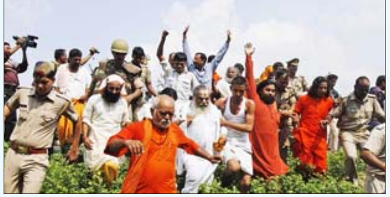
உ.பி. அயோத்தியில் வி.இ.ப. நடத்த முயன்ற 84 கோசி பரிக்கிரமாவில் கலந்து கொள்ள வந்த இந்து மதவெறிக் கும்பல்: கூட்டம் குறைவு; கூச்சல் அதிகம்!

வரில் நிலைமை கொதிப்பாக இருந்தது. கலவரம் வெடிப்பதற்கு இந்த வாக்குவாதம் ஒரு தீப்பொறியாகப் பயன்பட்டது என்பதுதான் உண்மை. இரண்டு தரப்புமே வன்முறையில் இறங்கின, இரண்டு தரப்புக்குமே பாதிப்புகள் ஏற்பட்டன என்ற போதும், இந்தக் கலவரத்தை அரசியல் ரீதியில் பயன்படுத்திக் கொண்டு, அதன் பலனை அறுவடை செய்து கொள்ளும் முயற்சியில் பா.ஜ.க.தான் மும்மரமாகச் செயல்பட்டது.