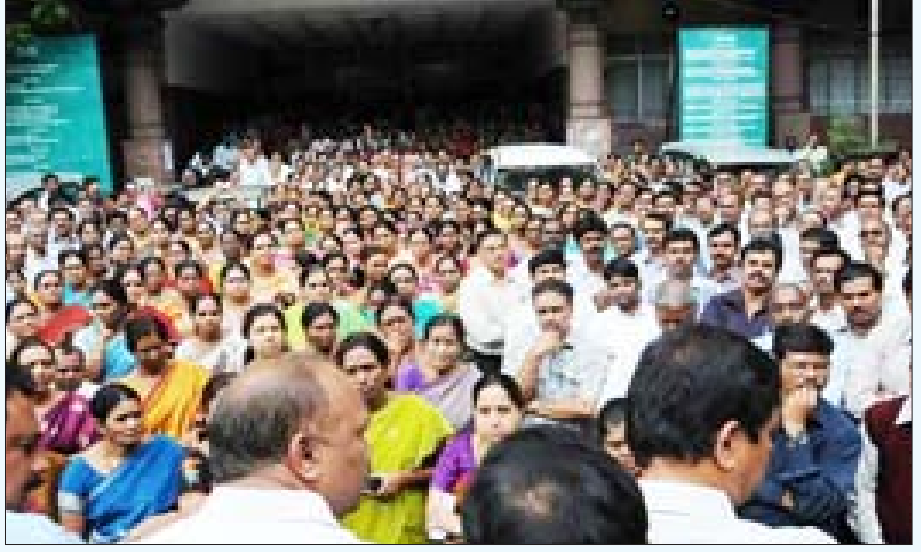
தெலுங்கானா தனி மாநிலமாகப் பிரிக்கப்படுவதை எதிர்த்து, கடலோர ஆந்திரம் மற்றும் ராயலசீமாவைச் சேர்ந்த தலைமைச் செயலக அரசு ஊழியர்கள் நடத்தும் ஆர்ப்பாட்டம்.

யின் ஓய்.எஸ்.ஆர். காங்கிரசு கட்சியோ இப்பிரிவினையை எதிர்க்கிறது. தெலுங்கானா பிராந்தியத்திலுள்ள காங்கிரசு கட்சியினர் தனி மாநிலப் பிரிவினையை ஆதரிக்கும் அதேசமயம், சீமாந்திரா பிராந்தியத்தின் காங்கிரசு மற்றும் தெலுங்கு தேசக் கட்சியினர் இப்பிரிவினையை எதிர்த்து போராட்டங்களை நடத்துகின்றனர். வலது கம்யூனிஸ்ட் கட்சி தனித் தெலுங்கானாவை ஆதரிக்கும் அதேசமயம், மார்க்சிஸ்ட் கட்சியோ பிரிவினையை எதிர்க்கிறது.