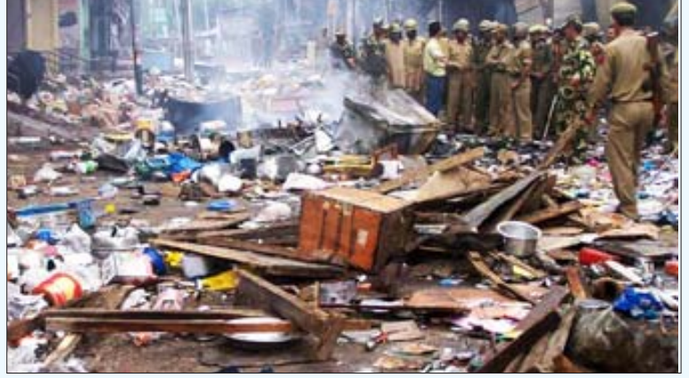
கிஷ்த்வரில் இந்து-முஸ்லிம்களுக்கு இடையே நடந்த மோதலின்பொழுது சூறையாடப்பட்ட கடைவீதி.

நாயைக் குளிப்பாட்டி நடுவீட்டில் வைத்தாலும் அதனின் புத்தி மாறாது என்பார்கள். சங்கப் பரிவாரங்கள்-பா.ஐ.க. குடும்பலுக்குக் கச்சிதமாகப் பொருந்தக்கூடிய சொலவடை இது. எதிர்வரும் நாடாளுமன்றத் தேர்தல்களில் ஓட்டுப் பொறுக்கு வதற்காக, வளர்ச்சி மற்றும் ஊழலற்ற நல்லாட்சி என்பதை முன்னிறுத்தித் தன்னை ஒரு கண்ணியமிக்க கட்சியாகக் காட்டி வரும் அக்கும்பலின் உயிர்நாடி இந்து மத வெறி பயங்கரவாதம்தான் என்பது ஜம்மு-காஷ்மீர் மாநிலத்திலுள்ள கிஷ்த்வர், பீகாரிலுள்ள நவாடாமற்றும் பெட்டையாவில் நடந்த மதக்கலவரங்களிலும்; விசுவ இந்து பரிசத் உ.பி.யில் நடந்த முயன்ற "84 கோசி பரிக்கிரமா" நிகழ்ச்சியிலும் அம்பலப்பட்டுப் போனது.