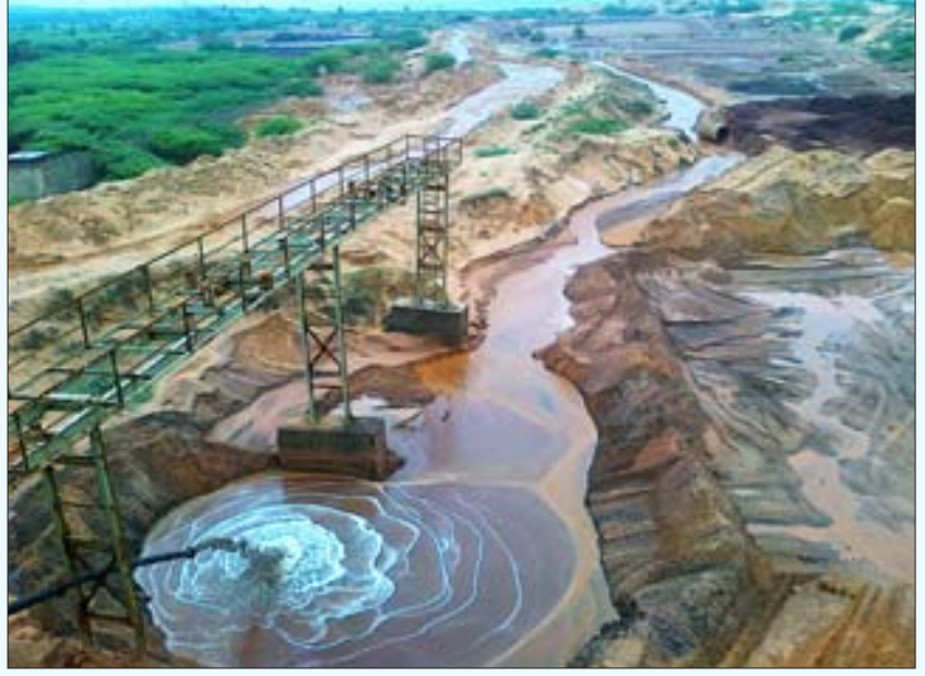
தாது மணலிலிருந்து கனிமங்கள் பிரிக்கப்பட்ட பின்னர் வெளியேற்றப்படும் கழிவுகளால் நாசமாக்கப்பட்ட கடலோரப் பகுதி.

தென்மாவட்டக் கடற்கரைப் பகுதிகளில் கடல் அலைகளைக் கட்டுப்படுத்தும் வகையில் இயற்கையாகவே அமைந்திருந்த மணல் குன்றுகள் இக்கும்பலின் சூறையாடலில் தரைமட்டமாகி விட்டன. இதனால் பல ஊர்களில் கடல் நீர்புகுந்து, நிலத்தடி நீர் உப்புநீராக மாறி, குடிநீருக்காக மக்கள் தவிக்கின்றனர். இங்குள்ள விவசாயிகளால் நடப்பட்ட ஆயிரமாயிரம் சவுக்கு மரங்களும், இயற்கையின் கொடையாகக் கருதப்படும் கடலோர அடையாளச்சின்னங்களாக நின்று ருந்த ஆயிரக்கணக்கான பனை மரங்களும் அழிக்கப்பட்டு விட்டன. கடலோர மணலிலிருந்து தாதுப் பொருட்களைப் பிரித்தெடுத்த பிறகு, கழிவு நீரையும் மணலையும் அதே பகுதியில் கொட்டுவதால், பல இடங்களில் கடல்நீர் நிறமே சிவப்பாக மாறி