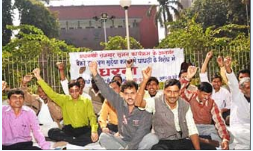
பிரதம மந்திரி வேலைவாய்ப்புத் திட்டத்தின் கீழ் தங்களுக்குத் தொழில் கடன் வழங்கக் கோரி, பாட்னாவிலுள்ள ரிசர்வ் வங்கியின் கிளை அலுவலகம் முன்பு ஆர்ப்பாட்டம் நடத்தும் வேலையில்லா பட்டதாரிகள். (கோப்புப் படம்)

விஜய் மல்லையாவைப் போல வாராக் கடன் வைத்துள்ள ஒவ்வொரு கார்ப்பரேட் முதலாளியும் வேறு பல தொழில்களை நடத்தி வருவது ஊரறிந்த உண்மை. கிங்ஃபிஷர் நிறுவனத்திற்குக் கடன் கொடுத்த வங்கிகள்தமது