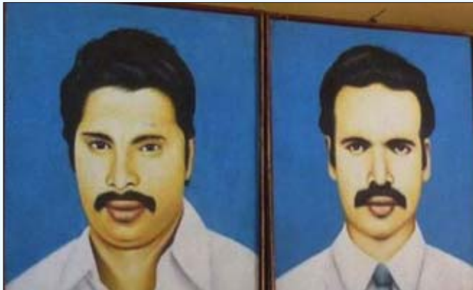
15-ஆம் நூற்றாண்டில் வணிகர்களாக அரபு நாடுகளிலிருந்து வந்து இலங்கையில் குடியேறிய அரபுவழி “ஆர்வி” பேசும் மூர்களின் சந்ததியினர். (கோப்புப் படம்)