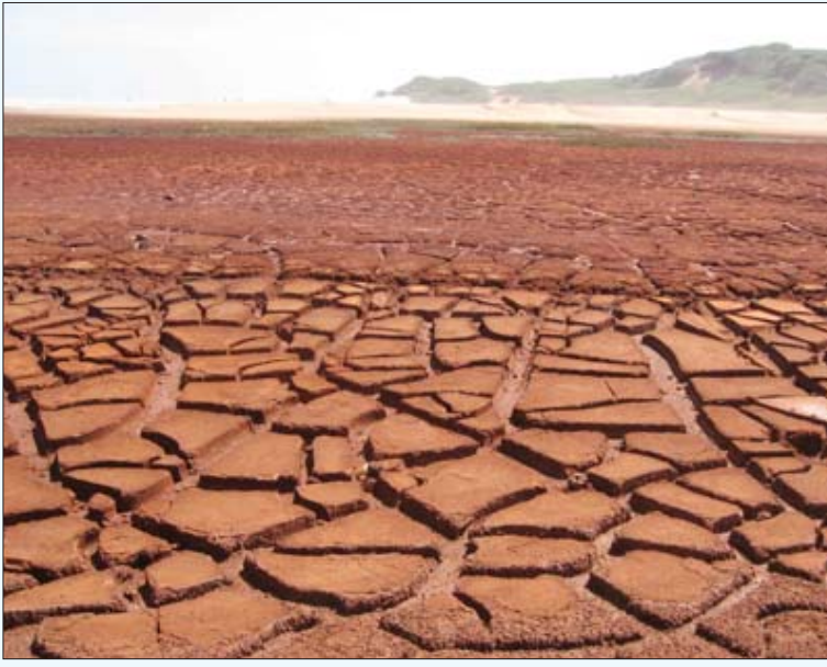
தாது மணற்கொள்ளையால் நாசமாகிக் வெடித்துக் கிடக்கும் நிலம்.