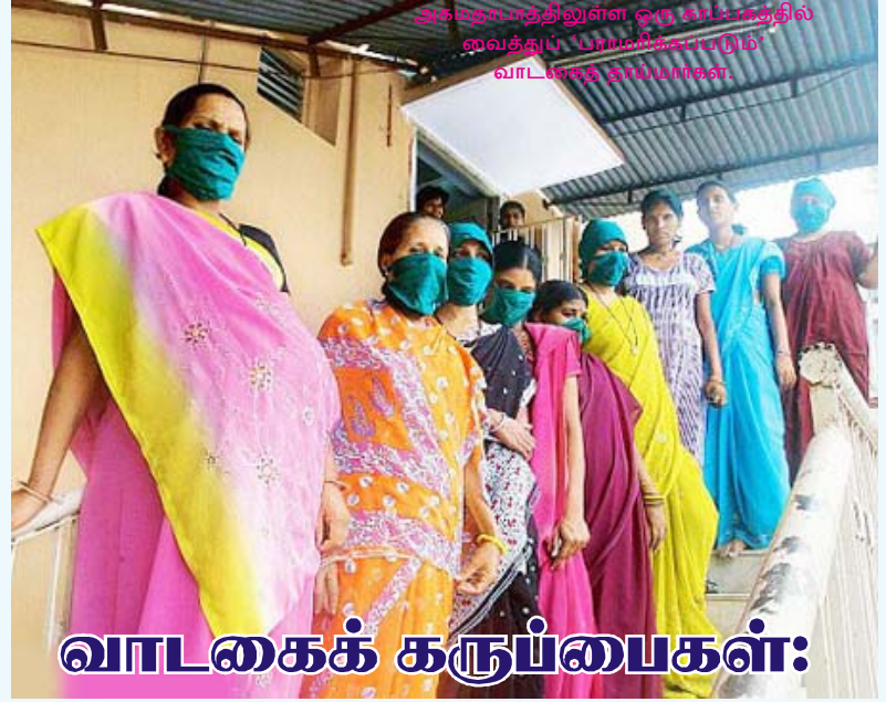
அகமதாபாத்திலுள்ள ஒரு சாப்பாட்டில் வைத்துப் 'பிராமிக்கப்படும்' வாடகைத் தாய்மார்கள்.

மேலும், ஈழவேந்தன் தலைமையிலான குழு TELO - தமிழ் ஈழ விடுதலை முன்னணி என்பதும், பத்மநாபன் தலைமையிலான குழு EROS - ஈழ மாணவர் பொது மன்றம் என்பதும் சமரன் குழுவின் வழக்கமான கற்பனைக் கண்டுபிடிப்புதான்! (தொடரும்)