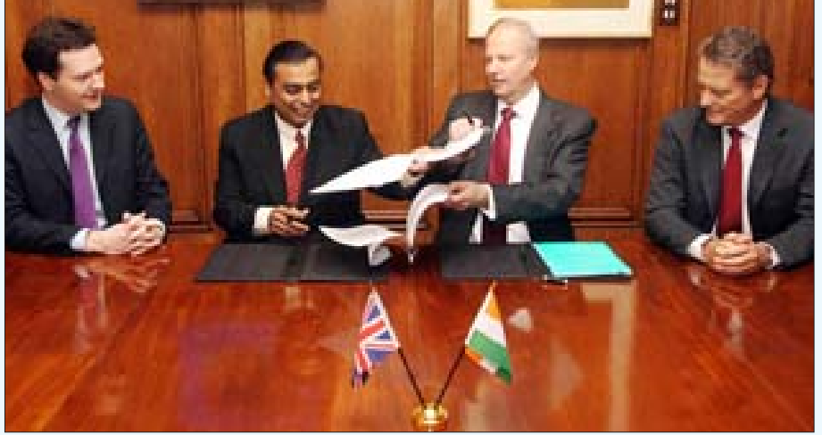
கே.ஜி. எண்ணெய் வயல்களின் 30 சதவீதப் பங்கை, ரிலையன்ஸ் நிறுவனம் பிரிட்டிஷ் பெட்ரோலிய நிறுவனத்திற்குத் தாரை வார்க்கும் ஒப்பந்தங்கள் பரிமாறிக் கொள்ளப்படுகின்றன: ஊரான் வீட்டு நெய்யே, எம் பொண்டாட்டி கையே! (கோப்புப் படம்)