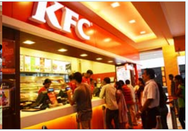
ரேஷன் கடையில் அலைமோதும் ஏழைகளின் கூட்டமும், அமெரிக்க கோழிக்கறியை வெட்டும் புதுப்பணக்கார கும்பலும்: இந்தியாவின் இரு துருவங்கள்.

நிலைமைக்கு இந்தளவிற்கு உணவு உட்கொண்டாலே போதும் என ஆணவமாக நியாயப்படுத்துகிறது.