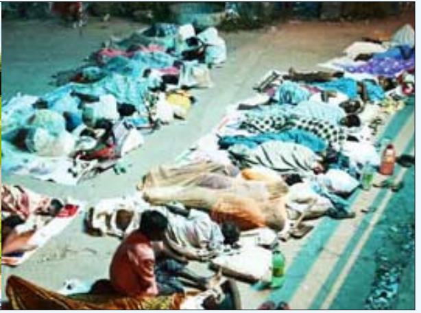
ரியல் எஸ்டேட் துறையின் வளர்ச்சி, உழைக்கும் மக்களை வீதிக்குத் தூரத்தியடித்திருக்கிறது.

ஸ்டான்லி நிறுவனத்தின் ருசிரீ சர்மா (டைம்ஸ் ஆப் இந்தியா, 28.8.13). ஸ்டான்லி அண்டு புவர் நிறுவனம், முதலீடு செய்வதற்கான இந்தியாவின் தரமதிப்பீட்டை (investment rating) (BBB) என்ற ஆகத்தரம் தாழ்ந்த நிலையில் வைத்திருக்கிறது. “குப்பை” என்ற இதற்கடுத்த நிலைக்குத் தாழ்ந்து விட்டால், பிறகு இந்திய அரசோ, தொழில் நிறுவனங்களோ பன்னாட்டு நிதி நிறுவனங்களிடம் கடன் வாங்குவது மிகவும் கடினமாகிவிடும்.