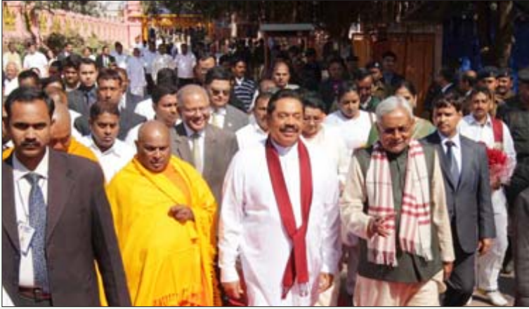
சிங்களப் பேரினவாத இலங்கை அரசின் போர்க்குற்றங்கள் ஒன்றன்பின் ஒன்றாக அம்பலப்பட்டு வரும் வேளையிலும், பீகார் மாநிலத்திற்கு வந்த ராஜபக்சே சும்பலுக்குச் சிவப்புக் கம்பள வரவேற்பு அளிக்கப்பட்டது.

அவ்வாறான ஒருநாடு இலங்கையின் போர்க்குற்றங்கள், மனித உரிமை மீறல்களை விசாரித்து நடவடிக்கை எடுத்திடக் கோரும் ஒரு தீர்மானத்தை சர்வதேச மனித உரிமை அரங்கில் முன்மொழிந்து, அதன் எடுபிடி நாடுகள் ஆதரிக்கின்றன என்றால், இவை அனைத்தும் சர்வதேச பூகோள - அரசியல் மற்றும் இராணுவ உள் நோக்கங்களுக்காக நடத்தப்படும் வெறும் அரசு தந்திர மாறாட்டங்கள் தவிர வேறொன்றும் அல்ல. உலகின் கிழக்கு நாடுகளையும் மேற்கு நாடுகளையும் இணைக்கும் பெருங்கடல் வழித்தடத்தில், சர்வதேச இராணுவ, பொருளாதார, போக்குவரத்து முக்கியத்துவம் வாய்ந்த வழித்தடத்தில் உள்ள இலங்கையை அமெரிக்கா தனது முழுமையான மேலாதிக்கத்தின் கீழ் இருத்திக் கொள்வதற்கான நோக்கங்களை உள்ளடக்கியதுதான். மற்றபடி போர்க்குற்றங்களுக்காகவும் மனித உரிமை மீறல்களுக்காகவும் நடுநிலை விசாரணை நடத்தி இலங்கை அரசு மீதும் ராஜபக்சேக்கள் மீதும் தண்டனை நடவடிக்கை எடுக்கவேண்டும் என்பது அமெரிக்காவின் நோக்கமே கிடையாது.