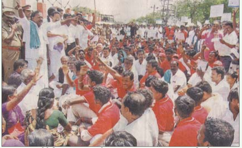
காவிரி மேலாண்மை வாரியத்தை உடனடியாக அமைக்கக் கோரி, திருவாரூர் மாவட்டம் அடியக்கமங்கலத்தில் உள்ள ஓ.என்.ஜி.சி. பெட்ரோலிய கிணறுகளை முற்றுகையிட்டுப் போராட்டம் நடத்தும் காவிரி மீட்டிக் குழுவினர்.

நடைமுறைக்கு வருவதற்கான வாய்ப்பு இருக்கிறது. ஆனால், இதற்கு எவ்வித காலக்கெடுவையும் நிர்ணயிக்காத உச்சநீதிமன்றம், கடந்த பிப்ரவரி 25 அன்று காவிரி மேலாண்மை வாரியத்தை அமைப்பது மைய அரசின் கடமை என்று கூறி எவ்வித உத்தரவும் பிறப்பிக்காமல் நழுவிக்கொண்டுள்ளது. கர்நாடக முதல்வர் ஷெட்டர் மீதான நீதிமன்ற அவமதிப்பு வழக்கு உள்ளிட்டு, தமிழ்நாடு, கர்நாடகம் ஆகிய மாநிலங்களின் சார்பில் தாக்கல் செய்யப்பட்ட துணை மனுக்கள் அனைத்தையும் தள்ளுபடி செய்துள்ளது.