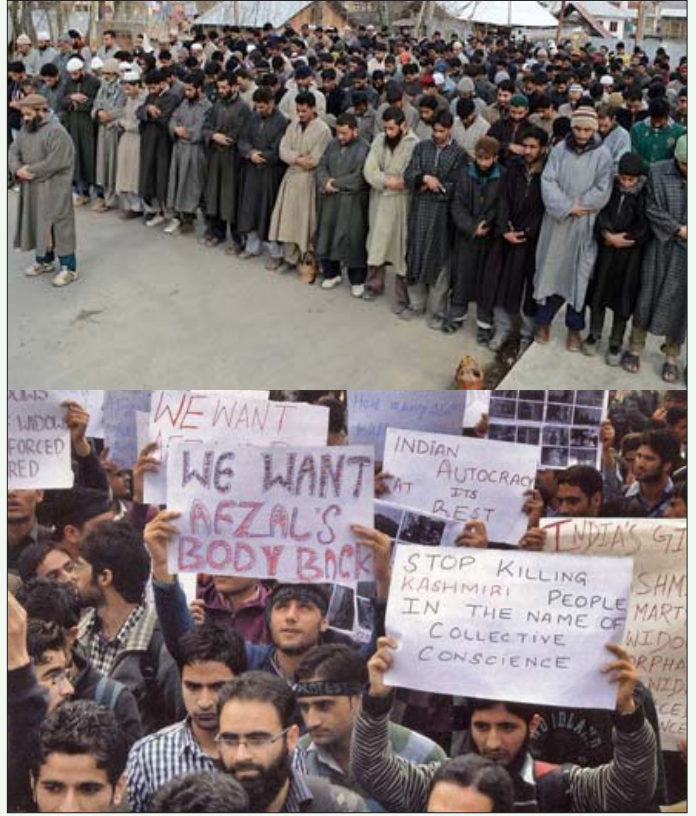
காஷ்மீர் தலைநகர் சிறீநகரில் அப்சல் குருவுக்காக நடத்தப்பட்ட பிரார்த்தனைக் கூட்டம் (மேலே); அப்சல் குருவின் உடலை ஒப்படைக்கக் கோரி, உ.பி. அலிகார் பல்கலைக்கழகத்தில் பயிலும் காஷ்மீர் மாணவர்கள் நடத்திய ஆர்ப்பாட்டம்.

அப்சல் குருவுக்கு வழங்கப்பட்ட தூக்கு தண்டனையை ஆதரிக்கும் ஓட்டுக்கட்சிகள், பத்திரிகைகள் மட்டுமல்ல; சாதாரண பொதுமக்கள்கூட உச்ச நீதிமன்றமே அப்சலுக்கு வழங்கப்பட்ட தூக்கு தண்டனையை உறுதி செய்திருக்கிறது என வாதிட்டு வரு