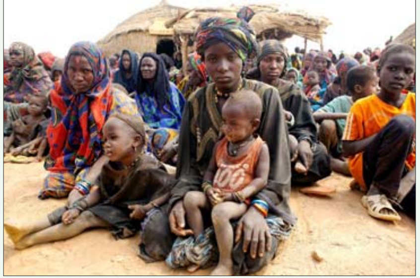
பிரான்சின் ஆக்கிரமிப்புப் போரினால் அகதிகளாக்கப்பட்டு அவலத்தில் உழலும் மாலி நாட்டு மக்கள்.

மாலியின் இஸ்லாமிய தீவிரவாதக் குழுக்கள் ஏகாதிபத்திய ஆக்கிரமிப்பாளர்களுக்கு எதிரான போரை நடத்துவதாக ஒரு தவறான கருத்து நிலவுகிறது. ஆனால் இந்த இஸ்லாமியத் தீவிரவாதிகள், அமெரிக்கக் கைக்கூலியான சலூதி அரேபியாவின் பணத்தில் வளர்ந்தவர்கள். லிபியாவில் கடாஃபியை வீழ்த்த நேற்றுவரை அமெ