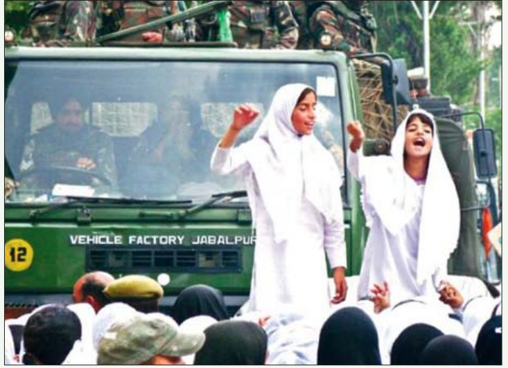
காஷ்மீரிலுள்ள ஷோபியான் என்ற ஊரில் ஒரே குடும்பத்தைச் சேர்ந்த இரு பெண்களைப் பாலியல் வல்லுறவுக்கு ஆட்படுத்திக் கொலை செய்த இராணுவத்தினரைக் கைது செய்து தண்டிக்கக் கோரி நடந்த ஆர்ப்பாட்டம். (கோப்புப் படம்)

இவ்வறிக்கை வெளியான மறுநாளே, “இராணுவத்தையெல்லாம் விசாரணைக்குட்படுத்த முடியாது”