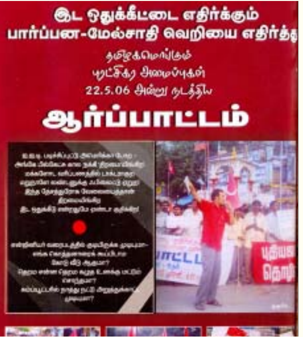
ஒடுக்கப்பட்ட, பிற்பட்ட சாதிகளுக்கு வழங்கப்படும் இடஒதுக்கீட்டை எதிர்க்கும் பார்ப்பன-மேல்சாதிவெறியை எதிர்த்து ம.க.இ.க.வும் அதன் தோழமை அமைப்புகளும் தமிழகமெங்கும் 2006-ஆம் ஆண்டில் நடத்திய ஆர்ப்பாட்டங்கள். (கோப்புப் படம்)

பெரியார் ஈ.வெ.ரா. “யார் சூத்திரன்?” என்ற ஒரு சிறுநூல் வெளியிட்டிருக்கிறார். அதில் கூறப்பட்டுள்ள