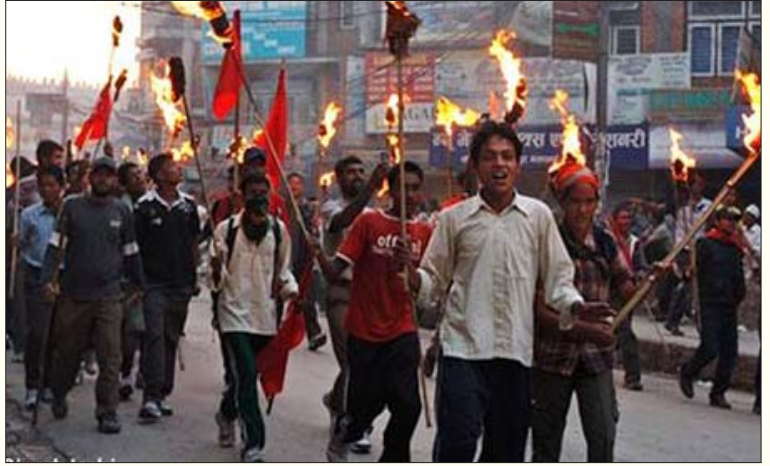
மே, 2009-இல் நடந்த ஆட்சிக் கவிழ்ப்புக்கு எதிராக மாவோயிஸ்டு கட்சித் தலைமையில் நடந்த உழைக்கும் மக்களின் ஆர்ப்பாட்டம். (கோப்புப்படம்)

மறுபுறம், நேபாளப் புரட்சியின் பின்னடைவைக் காட்டி, ‘மன்னராட்சிக்கு எதிரான மக்கள் எழுச்சிக்குப் பின்னர் மாவோயிஸ்டு கட்சி தனது செயல்தந்திரத்தை மாற்றிக் கொண்டு ஆயுதப் போராட்டத்தைக் கைவிட்டு அமைதி நடவடிக்கைக்குச் சென்றதுதான் தவறு. நீண்ட