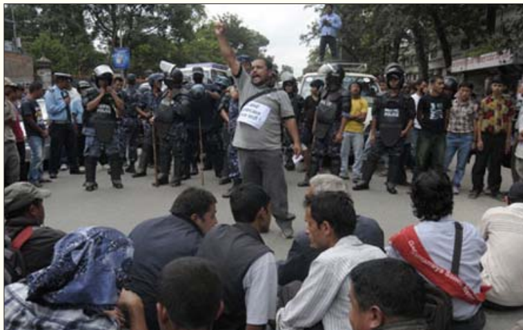
பிரசந்தாவும் பட்டாராயும் செம்படையின் ஆயுதப் பெட்டகங்களின் சாவியை நேபாள இராணுவத்திடம் ஒப்படைத்ததை எதிர்த்து 2011 செப்டம்பரில் தலைநகர் காத்தமண்டுவில் தோழர் கிரண் தலைமையிலான மாவோயிஸ்டு கட்சிக் குழுவினர் நடத்தும் ஆர்ப்பாட்டம்.

கட்சியின் அரசியல் தலைமைக்குழு தோழர்களுையோ, ஏன் கட்சியின் செயலாளரும், கட்சியின் பாதுகாப்புத் துறை பொறுப்பாளருமான பாதலையோ கலந்தாலோசிக்காமல் பிரசந்தாவும் பட்டாராயும் கடந்த ஆண்டு செப்டம்பரில் செம்படை முகாம்களிலுள்ள ஆயுதப் பெட்டகங்களின் சாவியை ராயல் நேபாள இராணுவத்திடம் ஒப்படைத்தனர். கடந்த ஏப்ரல் 10-ஆம் தேதியன்று நடந்த ராயல் நேபாள இராணுவத்துடன் செம்படை இணைப்பு என்பது அப்பட்டமான சரணாகதியாகவே நடந்துள்ளது. ஏறத்தாழ 19,000 பேர் கொண்ட செம்படையில் வெறும் 6500 பேரை மட்டும் நேபாள இராணுவத்தில் சேர்க்கலாம் என்று பிற அரசியல் கட்சிகள் நிர்ப்பந்தித்ததை அப்படியே பிரசந்தாவும் பட்டாராயும் ஏற்றுக் கொண்டனர். எஞ்சியோரைக் கட்டாயமாக விருப்ப ஓய்வு பெறச் செய்து செம்படையிலிருந்து வெளியேற்றியுள்ளனர். இச்சரணடைவை ஆதரிப்போருக்கும் எதிர்ப்போருக்குமிடையே சக்திகோர் செம்படையே முகாமில் மோதல்கள் நடந்தன. அதைத் தொடர்ந்து,