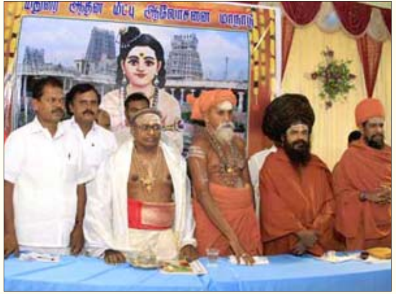
மதுரையில் நடந்த ஆதீன மீட்பு ஆலோசனை மாநாட்டில் கலந்து கொண்ட மகா சந்நிதானங்கள் மற்றும் பலர்.

ஆலயத்திற்குள் சாதி - தீண்டாமை பாராட்டக் கூடாது; அனைத்துச் சாதியினரையும் அர்ச்சகராக நியமிக்க வேண்டும் என்ற கோரிக்கைகள் வலுவாக எழுந்துவரும் 21-ஆம் நூற்றாண்டில், தருமபுரம், திருவாடுதுறை