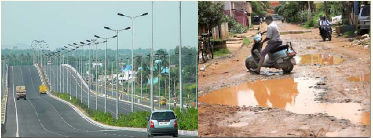
சென்னையையும் திருச்சியையும் இணைக்கும் பளபளக்கும் அதிவிரைவுச் சாலை; குண்டும் குழியுமாகக் கிடக்கும் சென்னை நகரின் உட்புறச் சாலை.

இடமாகப் பயன்படுத்தி வருகிறது. இவர்களைப் போலவே, தனியார் பொறியியல் கல்லூரி பேருந்துகள் மற்றும் ஹூண்டாய், நோக்கியா, இன்ஃபோசிஸ் போன்ற தனியார் நிறுவன ஊழியர்களை ஏற்றிச் செல்லும் பேருந்துகள் யாவும் பொது இடங்களைத்தான் இரவு நேர “பார்கிங்கிற்கு” பயன்படுத்தி வருகின்றன. அண்ணா சாலையிலிருந்து பீட்டர்ஸ் சாலை வழியாக இராயப் பேட்டை செல்லும் வழியில் கட்டப்பட்ட மேம்பாலம், அங்குள்ள சரவணபவன் ஹோட்டலுக்குச் சாப்பிடவரும் வாடிக்கையாளர்கள் தங்கள் வாகனங்களைப் பாதுகாப்பாக நிறுத்தப் பயன்படுகிறதேயொழிய, அப்பாலத்தால் ஆயிரம் விளக்குச் சந்திப்பில் போக்குவரத்து நெரிசல் குறையவில்லை.