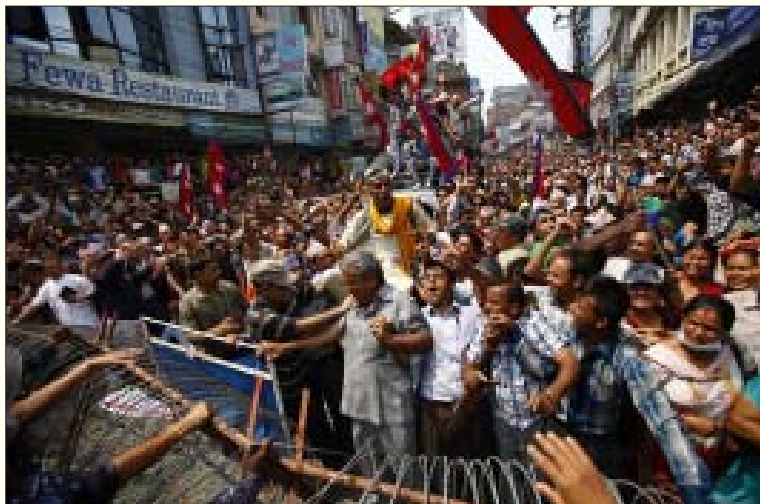
நேபாளத்தை தேசிய இன மற்றும் இனக்குழு அடிப்படையில் சுயாட்சிப் பிரதேசங்களாகப் பிரிப்பதை எதிர்த்து, பார்ப்பன-சத்திரிய ஆதிக்கச் சாதியினரை திரட்டி நேபாள காங்கிரசு மற்றும் ஐக்கிய மா-லெ கட்சியினர் கடந்த மே 27 அன்று அரசியல் நிர்ணயசபையை முற்றுகையிட்டு நடத்தும் ஆர்ப்பாட்டம்.

இடர்ப்பாடுகளால் சுற்றி வளைக்கப்பட்ட சவாலாகவும், அவற்றை முறியடித்து எழும் நம்பிக்கை நட்சத்திரமாகவும் தோன்றிய நேபாள புரட்சி இன்று பெரும் பின்னடைவில் சிக்கித் தவித்துக் கொண்டிருக்கிறது. உலக முதலாளித்துவம் இதனைக் காட்டி, இனி கம்ப்யூனிசப் புரட்சி சாத்தியமே இல்லை என்று எகத்தாளம் செய்வதற்கான நிலைமை ஏற்பட்டுள்ளது.