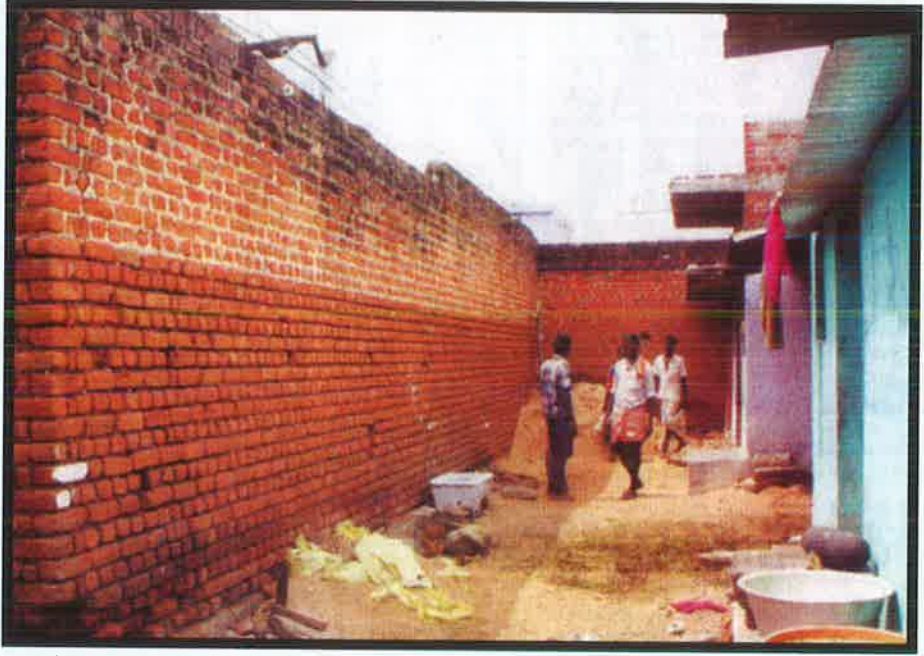
உத்தப்பூர் கிராமத்தில் தாழ்த்தப்பட்டோர் குடியிருப்பையும் மேல்சாதி தெருவையும் பிரித்துக் கட்டப்பட்டுள்ள தீண்டாமைச் சுவரும், அதில் பதிக்கப்பட்டுள்ள மின்வேலியும்.

பேருந்து நிறுத்தத்தையும் மேல்சாதித் தெருவையும் பிரித்துக் கட்டப்பட்டுள்ள மற்றொரு சுவர்.