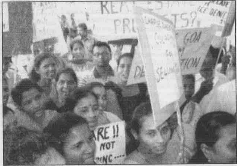
“எங்கள் மண்ணை அந்நியருக்குத் தாரைவார்க்க அனுமதியோம்!” - சிறப்புப் பொருளாதார மண்டலத்துக்கு எதிராக கோவா மக்களின் விடாப்பிடியான போராட்டம்.