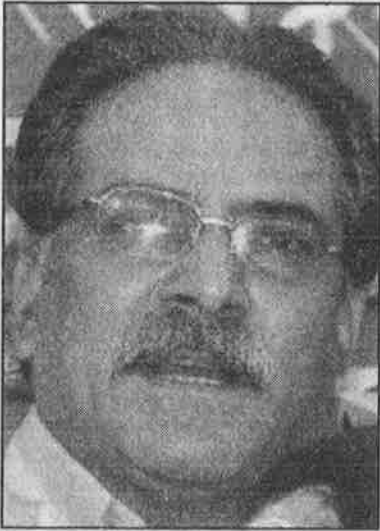
நேபாளக் கம்யூனிஸ்டுக் கட்சி (மாவோயிஸ்டு)-யின் தலைவர் தோழர் பிரசந்தா.

நேபாள அரசியல் நிர்ணயசபைக் கான நடந்து முடிந்த தேர்தலில் நேபாள மாவோயிஸ்டு கட்சி அடைந்துள்ள வெற்றி, அதற்கு முன்பு அதன் சண்டை நிறுத்தம் மற்றும் இடைக்கால அரசியல் பங்கேற்பு ஆகியவற்றை மட்டும் மேலோட்டமாகப் பார்க்கும் சில போலி புரட்சியாளர்கள், போலி முற்போக்குகள், போலி ஜனநாயக அரசியல் அறிஞர்கள் யானையைத் தடவிப் பார்த்த