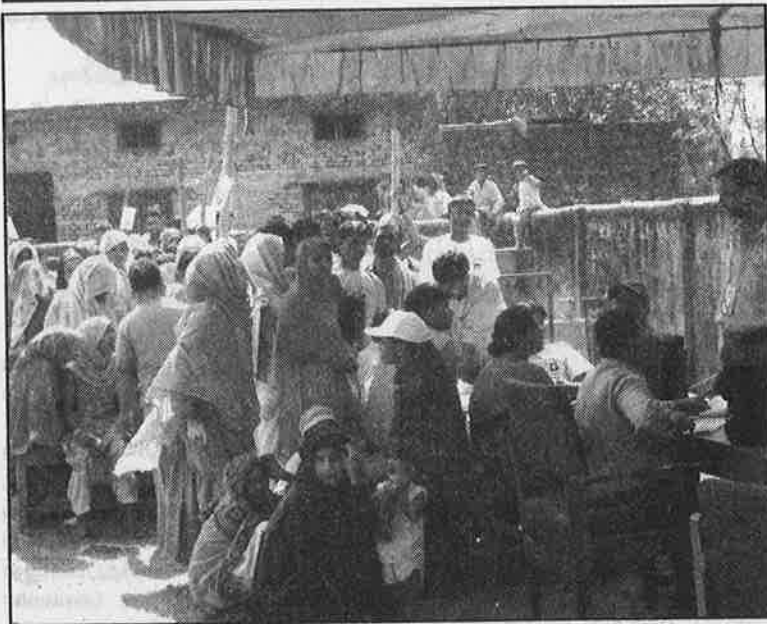
சந்தேகத்திற்கோ, முறைகேடுகளுக்கோ இடமளித்து விடாதபடி, திறந்தவெளியில் அமைக்கப்பட்ட வாக்குச்சாவடி.

டோரைப் படுகொலையும் செய்தனர். இந்தத் தேர்தலைப் புறக்கணிப்பதாகவும் அறிவித்திருந்தனர். எனினும் மாதேசி பகுதிகள் உள்ளிட்ட எல்லாப் பகுதிகளிலும் இத்தேர்தல் வெற்றிகரமாக நடைபெற்றுள்ளது என்பதும் குறிப்பிடத் தக்கது.