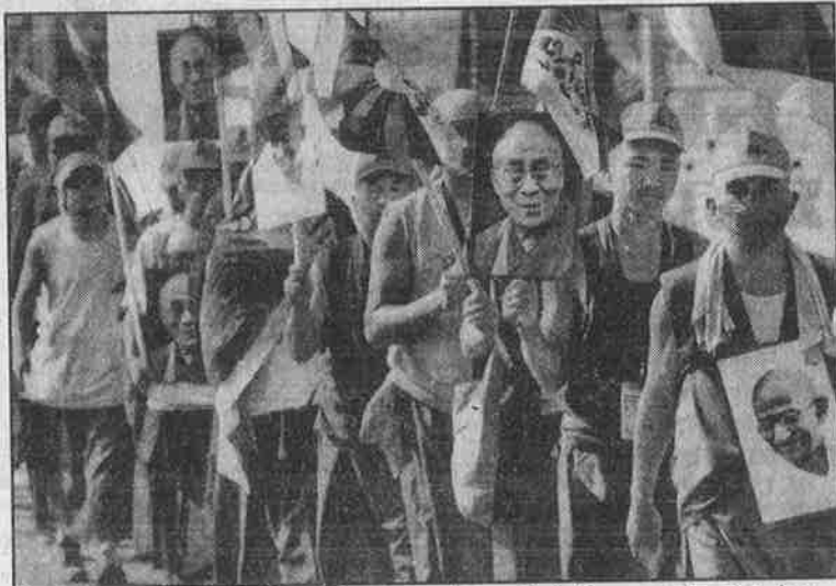
இந்தியாவில் வாழும் திபெத்திய புத்தமதத் துறவிகள் சீன அரசைக் கண்டித்து, இமாச்சலப் பிரதேசத்திலுள்ள தர்மசாலாவில் இருந்து தில்லி வரை நடத்திய பாதயாத்திரை: திபெத்தியர்களின் போராட்டங்களுக்கு ஆதரவு கொடுக்கும் இந்தியா, ஈழ ஆதரவுப் போராட்டங்களை ஒடுக்குகிறது.

மாணவர் போராட்டமாக வெளிப்பட்டது. இரு தரப்பும் முதலாளித்துவத்தின் இரு வேறுபட்ட கும்பல்களாக உள்ள நிலையில் அவற்றில் எதை பாட்டாளி வர்க்கம் ஆதரிக்க முடியும்? இவ்விரு தரப்பையும் நிராகரித்து, இரு தரப்புக்கும் எதிராகப் போராடுவதன் மூலமே மக்கள் ஜனநாயகத்தையும் சோசலிசத்தையும் சீன மக்கள் சாதிக்க முடியும் என்ற நிலைப்பாட்டையே அன்று கம்யூனிசப் புரட்சியாளர்கள் மேற்கொண்டனர்.