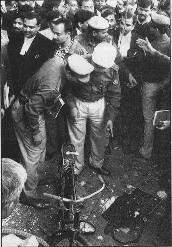
உ.பி. தலைநகர் லக்னோவில் உள்ள சிவில் உரிமை நீதிமன்ற வளாகத்தினுள் நடந்த குண்டு வெடிப்பு.

முசுலீம் தீவிரவாதம் மக்களுக்கு எதிரானதல்ல என்பதோ, முசுலீம் தீவிரவாதிகள் குண்டு வெடிப்புகள் போன்ற அழிவு நடவடிக்கைகளில் ஈடுபடுவதில்லை என்பதோ நமது வாதமல்ல. ஆனால், அனைத்துக் குண்டு வெடிப்புகளுக்கும் முசுலீம் தீவிரவாதத்தை மட்டுமே குற்றவாளியாக்குவதும்;