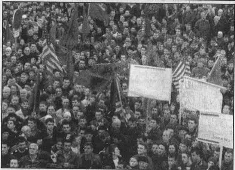
கொசாவோ சுதந்திரக் கொண்டாட்டத்தில் கோலோச்சும் அமெரிக்கக் கொடிகள்: துயரத்தின் முடிவா? தொடக்கமா?

இதன் தொடர்ச்சியாகவே கொசாவோ விடுதலைப் படையின் தலைவரான ஆசிம்தாசி, கடந்த பிப்ரவரி 17-ஆம் நாளன்று கொசாவோவின் தலைநகர் பிரிஸ்தினாவில் நடந்த நாடாளுமன்றக் கூட்டத்தில், கொசாவோவைத் தனியொரு நாடாக பிரகடனப்படுத்தியுள்ளார். இதனை அமெரிக்காவும் பிரிட்டன், பிரான்ஸ், ஜெர்மனி முதலான ஐரோப்பிய ஏகாதிபத்திய நாடுகளும் அங்கீகரித்துள்ளன. அவற்றின் நோக்கம், கொசாவோ மக்களின் நியாயமான சுயநிர்ணய உரிமையை அங்கீகரித்து ஆதரிப்பதல்ல; மாறாக, தமது மேலாதிக்கத்தை நிறுவுவதேயாகும்.