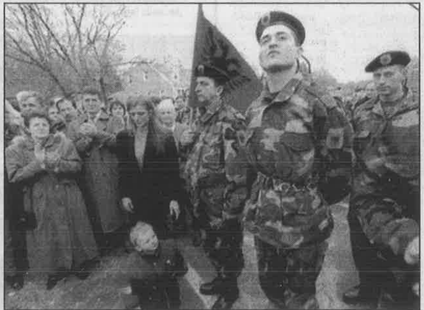
கொசாவோ விடுதலைப் படை: அமெரிக்காவால் சீரழிக்கப்பட்ட படை.

கொசாவோ மக்களைக் காப்பது என்ற பெயரில் ஏகாதிபத்திய கூட்டமைப்பின் (நேட்டோ) படைகள் குவிக்கப்பட்டன. மனித உரிமைகளை மீறிவிட்டதாகக் குற்றம் சாட்டி செர்பியா மீது குண்டுவீச்சுத் தாக்குதல் நடத்திப் போர் தொடுத்தன. கொசாவோவிலிருந்து செர்பியப் படைகள் வெளியேற்றப்பட்டு, ஏகாதிபத்தியங்களின் கைப்பாவையான ஐ.நா. மன்றத்தின் மேற்பார்வை திணிக்கப்பட்டது. கொசாவோ விடுதலைப் படை, அமெரிக்க விசுவாசக் கூலிப் படையாகச் சீரழித்