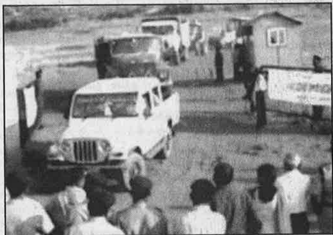
சிறப்புப் பொருளாதார மண்டலத்தின் கட்டுமானப் பணிகளை மேற்பார்வையிட வரும் அதிகாரிகளை முற்றுகையிட்டுப் போராடும் கோவா மக்கள்.

இவ்விரண்டு போராட்டங்களும் ஒட்டுக் கட்சிகளால் நடத்தப்படவில்லை. சுற்றுச் சூழலைக் காப்போம் எனும் முழக்கத்தின் கீழ் திரட்டப்பட்ட மக்களுடன், நடுத்தர வர்க்கம் கூடத் தன்னை இணைத்துக் கொண்டு போராடி இருக்கின்றது. இவர்களின் போராட்டத்தில் ஏகாதிபத்திய எதிர்ப்பு என்பது இல்லை. எனினும் ஏகாதிபத்திய, தரகு முதலாளிகளின் முயற்சி முறியடிக்கப்பட்டுள்ளது. இவ்வாறு கோவாவிலும்,