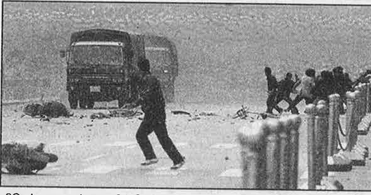
திபெத்தலைநகர் லாசாவில் இராணுவ வாகனங்களைத் தீவைத்து - கல்லெறித் தாக்குதல் நடத்தும் தலாய்லாமாவின் ஆதரவாளர்கள்.

கோலாட்சிக்கு எதிராக தன்னெழுச்சியான கலகங்கள் - கிளர்ச்சிகளில் ஈடுபடுவதும், இவற்றை சீன முதலாளித்துவ ஆட்சியாளர்கள் மிருகத்தனமாக ஒடுக்குவதும் தொடர்கிறது.