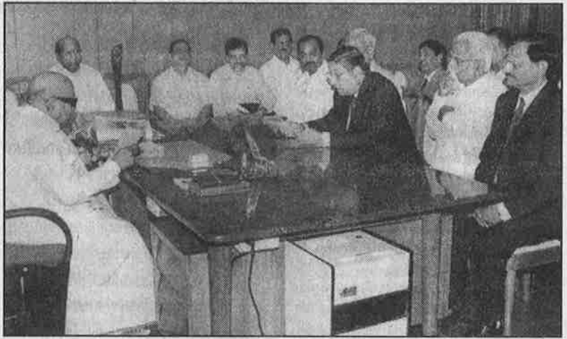
சிமெண்ட் விலையைக் குறைப்பது தொடர்பாக தமிழக முதல்வர் மு.கருணாநிதியிடம் ஆலோசனை நடத்தும் சிமெண்ட் ஆலை அதிபர்கள்: கொள்ளைக்காரனுக்கு பட்டுக் கம்பள வரவேற்பு.

உணவுப் பொருள் விலையேற்றத்துக்கு காரணங்களாகச் சொல்லப்படும் ஆஸ்திரேலியாவில் ஏற்பட்டுள்ள வறட்சியும்; கச்சா எண்ணெய் விலை உயர்வுமும்; உயிரி-எரிபொருள் தயாரிக்க