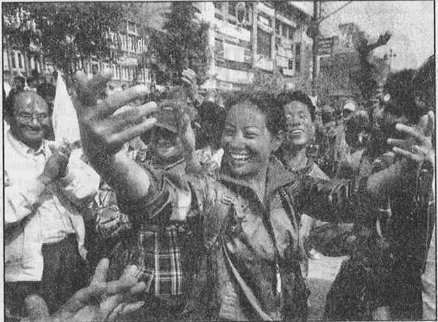
அரசியல் நிர்ணய சபைத் தேர்தலில் மாவோயிசுப் புரட்சியாளர்கள் அடைந்த வெற்றியைக் கட்சியின் ஆதரவாளர்களும், மக்களும் கொண்டாடுகின்றனர்.

நிறுவுவதற்கான மக்கள் எழுச்சி இயக்கம் வெடிக்கும் போதெல்லாம், நேபாள காங்கிரசு தலைமையிலான நேபாள முதலாளிய வர்க்கம் துரோகமிழைத்து முடியாட்சியுடன் சமரசம் செய்து கொண்டு அரசியல் சட்ட அமைப்பின் படியான மன்னராட்சியை நிறுவுவதற்குத்தான் எத்தனித்தது. முதலாளிய ஜனநாயகத்துக்கான கோரிக்கையைக்கூட கைவிட்டு, மன்னராலும் பழைய பிரபுத்துவத்தாலும் திணிக்கப்பட்ட அரசியல் கட்சிகளற்ற பஞ்சாயத்து ஆட்சி முறை போன்ற அதிகாரமில்லாத அரசியல் சட்ட அமைப்பை ஏற்றுக் கொண்டது. பின்னர், மன்னராலேயே பெயரளவுக்கான அந்த ஆட்சி அமைப்பும் தூக்கியெறிப்பட்டு எதேச்சதிகார ஆட்சியே பல ஆண்டுகள் நீடித்தது. 1990-களில் நடந்த மக்கள் எழுச்சி மூலம் பலகட்சி நாடாளுமன்றம் நிறுவப்பட்டு, பின்னர் அதுவும் கலைக்கப்பட்டது. இறுதியாக, 2000-ஆம் ஆண்டு அரண்மனை மன்னர் குடும்பப் படுகொலைகளைகளுக்குப் பின், ஞானேந்திராவின் பாசிச மன்னராட்சி நிறுவப்பட்டது.