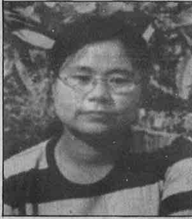
இந்திய இராணுவத்தால் பாலியல் பலாத்காரப்படுத்தப்பட்டுப்படுகொலை செய்யப்பட்ட தன்ஜம் மனோரமா.

இதனையடுத்து மணிப்பூருக்குப் பறந்துவந்த பிரதமர் மன்மோகன் சிங், இராணுவத்துக்கு எதிரான போராட்டத்தில் முன்னணியில் நின்ற தாய்மார்களைச் சந்தித்தார். இச்சட்டத்தை மறுபரிசீலனை செய்யக் கமிட்டியொன்றை அமைப்பதாக வாக்குறுதி கொடுத்தார். ஆனால், அவர் திரும்பிச் சென்ற மறுநிமிடமே, நிர்வாணப் போராட்டத்தில் கலந்து கொண்ட தாய்மார்கள் அனைவரும் தேசியப் பாதுகாப்புச் சட்டத்தின் கீழ்க்கைது செய்யப்பட்டனர். எனினும் அவர்களுள் ஒருவர் கூட - 73 வயதான மூதாட்டிகள் கூட்டு பிணை கேட்டு விண்ணப்பிக்கவில்லை. இந்த அடக்குமுறைக்குப் பிறகும் போராட்டம் தொடர்ந்து போகாமல் வீச்சாக நடந்து வந்ததால், மூன்று மாதங்கள்