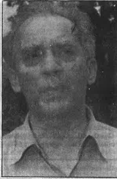
பா.ஜ.க. ஆட்சியில் தனியார்மயமாக்கல் துறையின் அமைச்சராக இருந்த அருண்ஷோரி.

அ த ா வ து , வி.எஸ்.என்.எல். பங்கு விற்பனைமூலம் அரசுக்குக் கிடைத்த தொகை ரூ. 1439.25 கோடி. பங்கு விற்பனையின் போது, வி.எஸ்.என்.எல். -இன் சொத்து மதிப்பில் சேர்க்கப்படாத, வரி வருவாய் வழக்கில் கிடைத்த ஆதாயத் தொகை ரூ.1400 கோடி. ஆக, வி.எஸ்.என்.எல்.