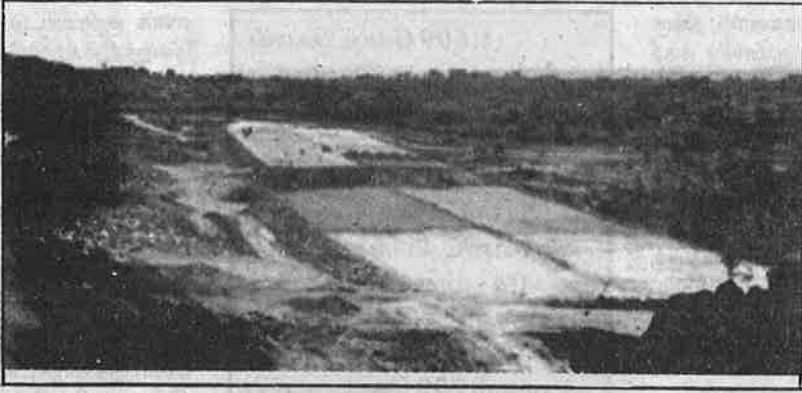
அரசு நிலம் - ஏழை விவசாயிகளின் நிலங்களை ஆக்கிரமித்து அமைக்கப்படும் பெங்களூர் - மைசூர் விரைவு நெடுஞ்சாலை.

‘‘மகேஷ்வர் திட்டம்’’ என அழைக்கப்படும் இந்தத் திட்டத்திற்கான ஒப்புதல் 1994 - ஆம் ஆண்டே மைய அரசால் எஸ்.குமார்ஸ் நிறுவனத்திற்கு வழங்கப்பட்டு விட்டது. 1997-ஆம் ஆண்டிலேயே இத்திட்டத்தைத் தொடங்குவதற்கான அடிக்கல் நாட்டப்பட்டு விட்டா