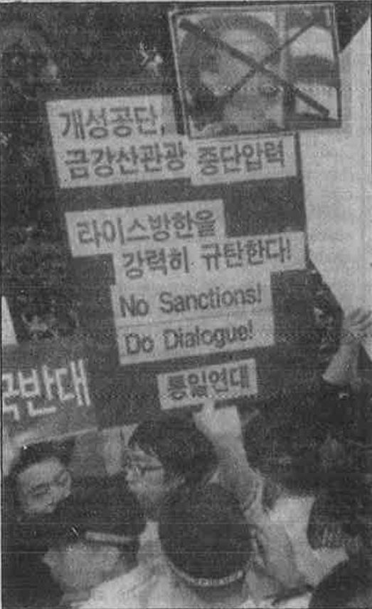
அமெரிக்காவின் தொங்கு சதை நாடான தென்கொரியாவிலேயே அமெரிக்க அயலுறவுத்துறை அமைச்சர் கண்டலிசா ரைஸ் எதிர்த்த போராட்டம்.

தொலைபேசியில் கூப்பிட்டு மிரட்டுகிறார். மன்மோகன் சிங்கோ தண்டனிட்டு தலைமேற்கொண்டு செய்து முடிக்கிறார். மும்பை குண்டு வெடிப்பில் பாசில்தான் உளவு நிறுவனத்தின் பங்கு குறித்த ஆதாரங்களை அமெரிக்க அதிகாரிகளின் காலடியில் சமர்ப்பிக்கிறது. இந்தியா - ஏதோ அமெரிக்க சி.ஐ.ஏ.வுக்குத் தெரியாத இரகசியம் போல!