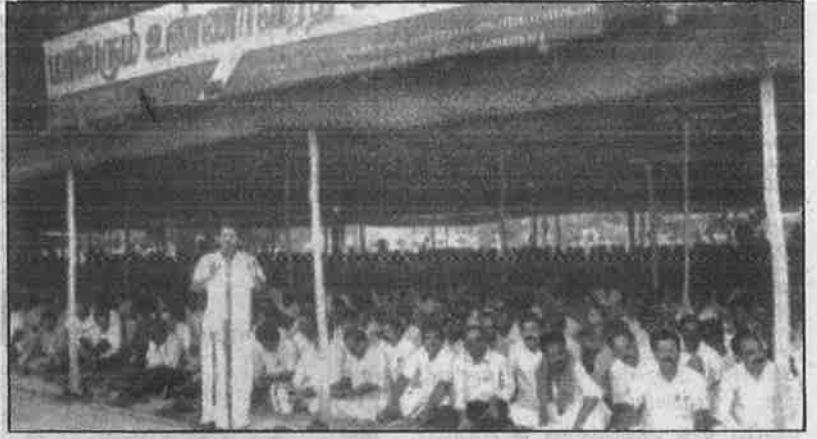
நெய்வேலி பழுப்பு நிலக்கரி நிறுவனத்தின் பங்குகளைத் தனியாருக்கு விற்க முடியாது எடுக்கப்பட்டதை எதிர்த்து நடந்த தொழிலாளர்கள் கூட்டமையின் உண்ணாவிரதப் போராட்டம். (கோப்பு படம்).

எனவேதான், தணிக்கை கட்டுப்பாட்டு அதிகாரியின் அறிக்கை எனும் பல் பிடுங்கப்பட்ட பாம்பு சீறுவதைப் பார்த்து, முந்தைய பா.ஜ.க. ஆட்சியாளர்களும் தரகுப் பெருமுதலாளிகளும் கைகொட்டிச் சிரித்து ஏளனம் செய்கின்றனர். முதலாளிகள் பொதுச் சொத்தைச் சூறையாடுவதற்கென்றே உருவாக்கப்பட்ட பங்கு விற்பனைத் துறையின் முன்னாள் பா.ஜ.க. அமைச்சரான அருண்ஷோரி, "இந்த அறிக்கையானது குறுகிய பார்வை கொண்டது; நடைமுறைக்கு ஒவ்வாத பரிந்துரைகளைக் கூறுகிறது; இப்படி முட்டுக்கட்டைகள் போட்டால் பங்கு விற்பனை எனும் அரசின் கொள்கையைச் செயல்படுத்தவே முடியாமல் போய்விடும்" என்று மிரட்டுகிறார். அதாவது, தனியார்மயமாக்கம் என்பது அரசின் கொள்கை; தனியார்மயம் என்றால் பொதுச்சொத்தைச்