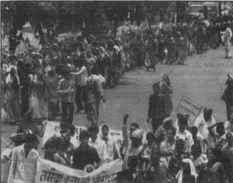
மகேஷ்வர் அணைக்கட்டுத்திட்டம் உள்ளிட்டு நர்மதை ஆற்றின் மீது கட்டப்பட்டு வரும் ஆறு பெரிய அணைகளால் பாதிக்கப்பட்ட மக்கள், ம.பி. தலைநகர் போபாலில் நடத்திய ஆர்ப்பாட்ட ஊர்வலம்.

இத் தொழில்கள் ஒருபுறமிருக்க, ம.பி. மாநிலத்தின் கர்கோன் மாவட்டத்திலுள்ள மண்டலேஷ்வர் என்ற ஊருக்கு அருகே, நர்மதை ஆற்றின் குறுக்கே அணையொன்றைக் கட்டி, (நர்மதை ஆற்றின் குறுக்கே கட்டத்திட்டமிடப்பட்டுள்ள 30 பெரிய அணைகளுள் இதுவும் ஒன்று) அதிலிருந்து நீர் மின்சாரம் தயாரிக்கும் திட்டத்திலும் எஸ்.குமார்ஸ் குழுமம் இறங்கியிருக்கிறது.