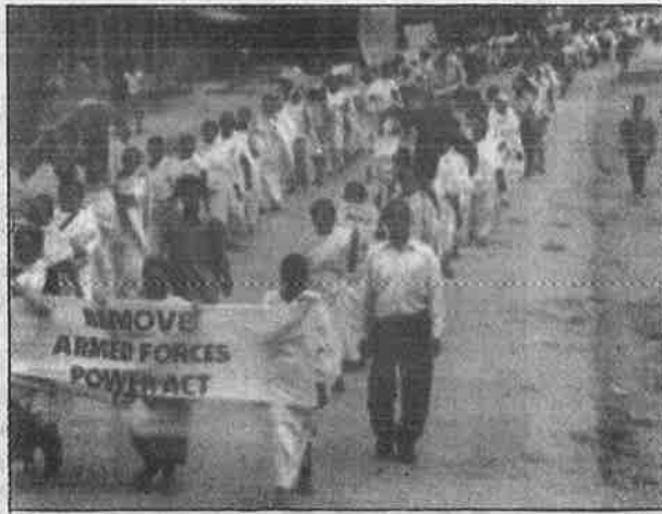
மணிப்பூர் மாநிலத்தில் இருந்து முற்றிலுமாக ஆயுதப் படை சிறப்பு அதிகாரச் சட்டத்தை நீக்கக் கோரி நடந்த ஆர்ப்பாட்ட ஊர்வலம். (கோப்பு படம்).

பாகிஸ்தானில் நேரடியான இராணுவ சர்வாதிகார ஆட்சி நடக்கிறது என்றால், வடகிழக்கிந்தியாவின் அசாமிலும், மணிப்பூரிலும், நாகலாந்திலும் மற்றும் ஜம்மு - காஷ்மீரிலும் மறைமுகமான வழியில் சட்டபூர்வ இராணுவ சர்வாதிகார ஆட்சிதான் நடக்கிறது. ஈரக்கை அமெரிக்கா ஆக்கிரமித்திருப்பது போல, இத்தேசிய இன மக்களை இந்தியா இராணுவம் ஆக்கிரமித்திருக்கிறது.