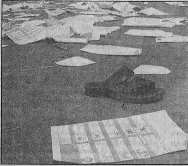
சென்னை தெருக்களில் ஜனநாயகத்துக்கு செருப்படி.

இதற்காக ஆளும் தரப்பினர் ஆத்திரத்தைத் தூண்டும் வகையிலான அறிக்கைகளை ஜெயா-சசி கும்பல் வெளியிட்டு வந்தது. "கருணாநிதியின் வாரிசுகள் துரியோதனன் கூட்டத்தை விட மோசமானவர்களாக இருக்கிறார்கள். கடைசி நேர தேர்தல் அராஜகங்களைப் பார்த்துக் கொதித்தெழுந்து, அவர்களை மக்கள் காலால் மிதித்து நசுக்கி மண்ணோடு மண்ணாக துவம்சம் செய்யக் காத்திருக்கிறார்கள். அந்த நரகாசுர வதம் நிச்சயம் நடக்கத்தான் போகிறது" என்றார் ஜெயலலிதா. ஜெயலலிதாவின் இந்த முயற்சிக்கு வழக்கமான கோழைத்தனத்தைக் கருணாநிதி வெளிப்படுத்தவில்லை. மாறாக "ஜெயலலிதாவின் சவாலுக்குப் பின்னால் சதி ஒளிந்திருக்கிறது. தேன் அடை போலிருக்கும் கூட்டத்தைக் கலைக்க யாராவது முயற்சி செய்தால் என்ன ஆகும் என்பது எல்லோருக்கும் தெரியும். நீங்கள் கலைக்கப்பட்டால், கலவரத்துக்கு ஆளானால் அந்த நேரத்தில் எப்படி இருப்பீர்கள் என்பதும் எனக்குத் தெரியும். ஆட்சி பொறுப்புக்கு வந்துவிட்டோம் என்பதற்காகக் கோழைகளாக வாழ முடியாது. துறவிகளாக இருக்க முடியாது" என்று தனது உடன்பிறப்புக்களைப் பார்த்து உசுப்பேற்றி பதிலடிக்க கொடுத்தார் கருணாநிதி. இந்த பதிலடி, தி.மு.க. அரசியல் இனிமேலும் கருணாநிதியின் அறிக்கை அரசியலாக மட்டும் இருக்காது. ஸ்டாலின் - தயாநிதிமாறன் இணையின் புதிய பாணியிலானதாக இருக்கும் என்பதையே