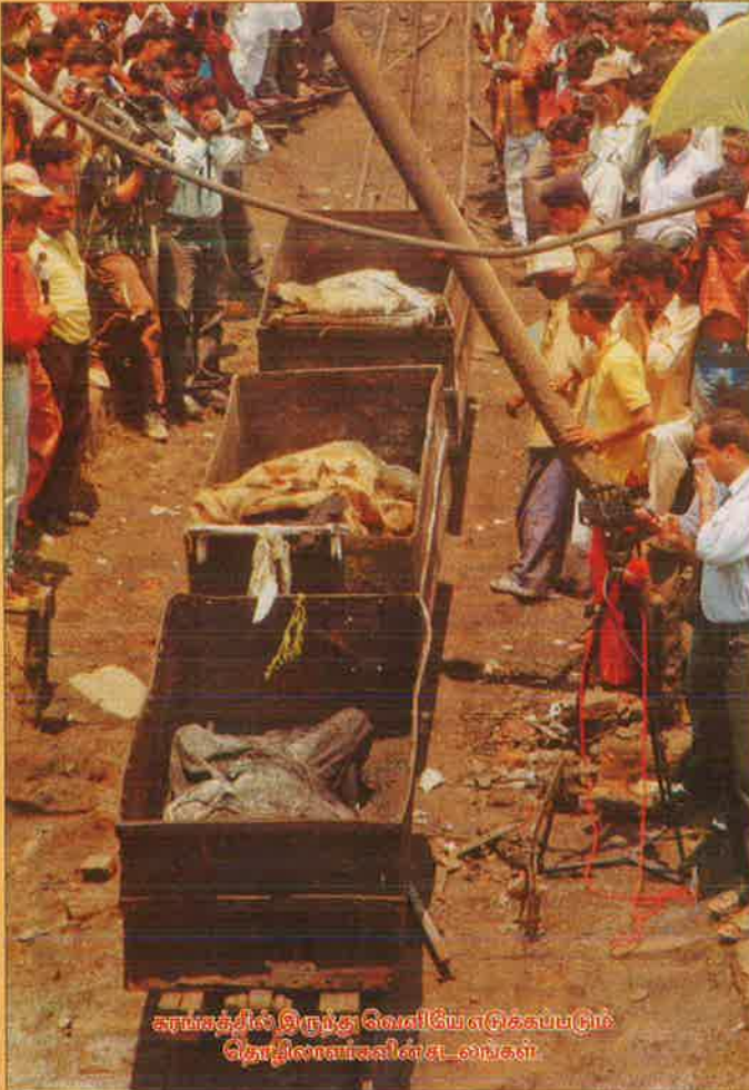
காங்காசில் இறந்து போனவர்களை எடுக்கப்பட்டுள்ள தொழிலாளர்களின் உடல்கள்

இந்த 'விபத்து' நடந்த அதே சமயத்தில், வேலை வாய்ப்பில்லாத 30 ஏழை இளைஞர்கள் மேற்கு வங்க மாநிலத்தில் கைவிடப்பட்ட ஒரு நிலக்கரிச் சுரங்கத்திலிருந்து நிலக்கரியை எடுத்து வருவதற்காகச் சுரங்கத்தினுள் இறங்கியிருக்கிறார்கள். அப்பொழுது சுரங்கத்தினுள் ஏற்பட்ட திடீர் வெள்ளத்தில் மாட்டிக் கொண்ட இவர்களைக் காப்பாற்ற அதிகார வர்க்கம் பெரிய முயற்சி எதுவும் செய்யவில்லை. மாறாக, இந்த இளைஞர்கள் நிலக்கரியைத் திருடுவதற்காகச் சட்ட விரோதமாக சுரங்கத்தினுள் இறங்கியதாகத் திருட்டுப் பட்டம் கட்டித் தங்களின் பொறுப்பைத் தட்டிக் கழித்தார்கள். இப்படிப்பட்ட கல் நெஞ்சுக்காரர்கள் ஏழைகள் மீதும், தொழிலாளர்கள் மீதும் காட்டும் இரக்கம் உண்மையானதாக இருக்க முடியுமா?