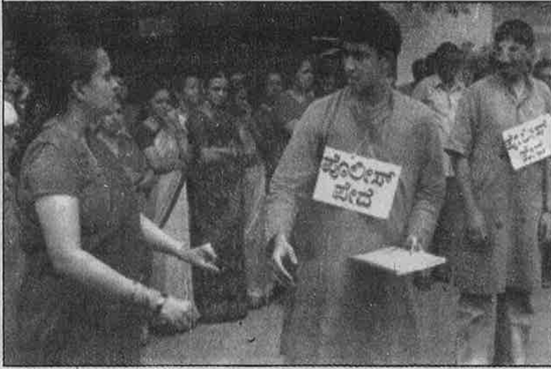
“கிரஹக் சக்தி” என்ற தன்னார்வத் தொண்டு நிறுவனம் தகவல் அறியும் உரிமைச் சட்டத்தை விளக்கி பெங்களூர் நகரில் நடத்திய தெரு நாடகம்.

அதன் போதா மையை உணர்ந்த ஏகாதிபத்திய பன்னாட்டுத் தொழில் கழகங்களின் முன் முயற்சியினால், சோனியா காந்தியைத் தலைவராகக் கொண்ட தேசிய ஆலோசனைக் குழுவேறொரு தகவல் அறியும் சட்டத்தைக் கொண்டு வரும்படி நிர்ப்பந்தித்து, 2005, மே மாதம் நாடாளுமன்றத்தில் நிறைவேற்றப்பட்டது.