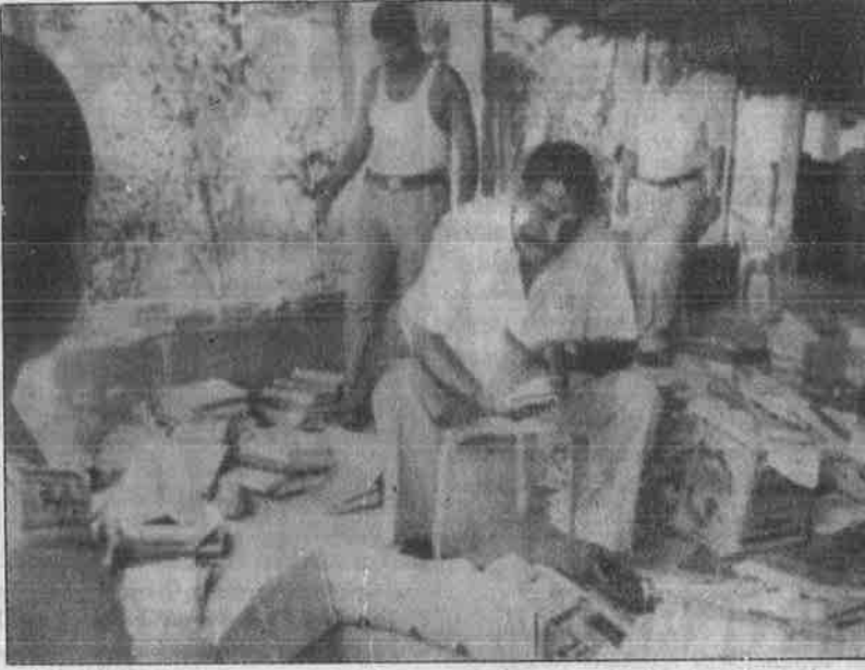
போலி முதல் தகவல் அறிக்கை வழக்கு தொடர்பாக சி.பி.ஐ. நாமக்கல் போலீசு நிலையத்தில் விசாரணை நடத்தியபோழுது, அவ்வழக்கு சம்மந்தப்பட்ட ஆவணங்களைத் தேடும் போலீசார்.

மிரட்டிப் பணம் பறிப்பதும், கிரிமினல் குற்றக் கும்பல்களை வைத்து வீடு-வீட்டுமனைத் தொழில் புரிந்ததாகவும், இரண்டு காங்கிரசு அமைச்சர்கள், ஏழு சி.பி.எம்.-தலைவர்கள், அரசியல் பிரமுகர்கள், போலீசு, ஐ.ஜி வரைபல அதிகாரிகள் உட்பட பல முக்கியப் புள்ளிகள் அந்தத் தரகு பெண்ணின் வாடிக்கையாளர்கள் என்பதும் வெளியே வரத் தொடங்கியது.