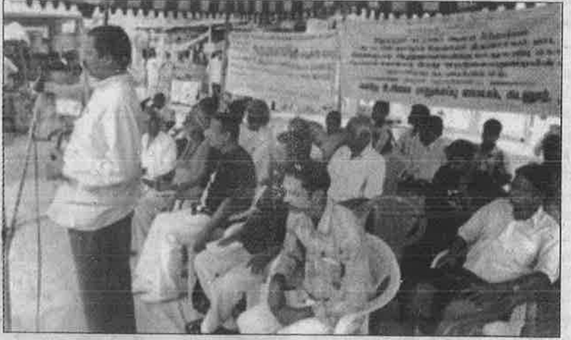
தீண்டாமையை உறுதி செய்யும் உரிமையியல் நீதிமன்றத் தீர்ப்பைக் கண்டித்து சிதம்பரம் நகரில் நடந்த தொடர்முழக்க ஆர்ப்பாட்டம்.

"இந்தக் கோயிலுக்குச் சொந்தமாக, 1000 ஏக்கர் நிலமுள்ளது; உண்டியல் வைக்காமல், பக்தர்களிடமிருந்து தீட்சிதர்களே நேரடியாகப் பணம் பெறுகிறார்கள். நகைகள் காணாமல் போயிருப்பதாகக் கூறப்படுகிறது. இந்தக் காரணங்களால் இக்கோவிலில் அரசு நிர்வாக அதிகாரியை நியமிப்பது சரி" என சென்னை உயர்நீதி மன்ற நீதிபதி வெவ்