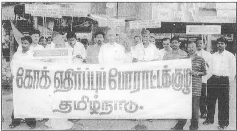
அமெரிக்க ஆக்கிரமிப்பின் சின்னமான கோக்கை நாட்டை விட்டு வெளியேற்றக் கோரி, நெல்லையில் நடந்த ஆர்ப்பாட்டம்.