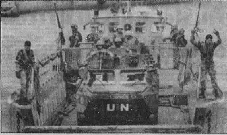
போர் நிறுத்தத்திற்குப் பிறகு, லெபனானின் டயர் நகரத்திற்கு அருகிலுள்ள நாகுரா துறைமுகத்திற்கு வரும் ஐ.நா. படைகளைச் சேர்ந்த பிரான்சு நாட்டு வீரர்கள்: ஏகாதிபத்தியங்களின் மறைமுக மேலாதிக்க ஆக்கிரமிப்பு.

இயக்கத்தினருக்கு ஆயுத உதவிகிடைப்பதைத் தடுப்பதும் ஹிஸ்புல்லர் வையும் லெபனான் மக்களையும் முடமாகும் மேலாதிக்க சதி நடவடிக்கையே ஆகும். போர் நிறுத்தம் - அமைதியின் பெயரால் மீண்டும் அங்கே அமெரிக்கா தலைமையிலான ஏகாதிபத்தியங்களின் மேலாதிக்கத்தை நிறுவுவதற்கும் "புதிய மத்திய கிழக்கு திட்டத்தை" சுற்றி வளைத்து செயல்படுத்துவதற்குமான ஏற்பாடுகளே நடக்கின்றன. இனவெறி பயங்கரவாத இஸ்ரேலுடனும் அமெரிக்காவுடனும் கூடிக்கூலாவும் இந்திய அரசோ இப்பன்னாட்டு ஏகாதிபத்திய மேலாதிக்கத்துக்கு விசுவாசமாக இந்தியப் படைகளை அனுப்பத் துடித்துக் கொண்டிருக்கிறது. இதே வழியில் இன்னும் பல ஏழை நாடுகள் இத்தகைய கைக்கூலி சேவை செய்யக்காத்து நிற்கின்றன.