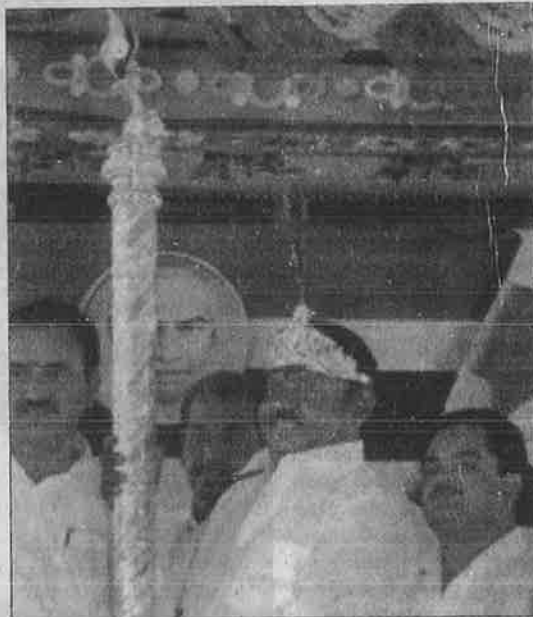
முன்றாவது சக்தியாக முன்னிறுத்தப்படும் விஜயகாந்தின் தேசிய முற்போக்கு திராவிடர் கழகத்திலும் தனிநபர் துதி-வழிபாடு போன்ற பிற்போக்குத்தனங்கள்தான் நிரம்பிக் கிடக்கின்றன.

இப்போதும் தமிழர் என்பதற்குப் பதிலாக “திராவிடர்” என்ற பெயரைத் தனது கட்சிக்குத் தெரிவு செய்து கொண்டிருப்பதற்குக் காரணம் தனது சாதியையும் அதில் உள்ளடக்கிக் கொள்ள முடியும் என்பதுதான். ஏற்கெனவே தமிழ்நாட்டில் உள்ள நாயுடு சாதிச் சங்கத்தினரும் அவர்களின்