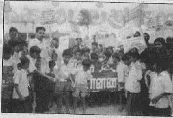
ஒசூரில் பு.ஜ.தொ.மு. நடத்திய கோக் எதிர்ப்புப் போராட்டத்தில், அந்த அமெரிக்க மூத்திரத்தைத் தரையில் கொட்டும் பள்ளிச் சிறுவர்கள்.

அந்த வரையறையை அவர்கள் வெளியிடுவதற்கு ஒரு நாள் முன்னதாக மக்கள் துரோகி அன்புமணி இராமதாசு பொறுப்பில் உள்ள சுகாதார மற்றும் குடும்பநலத்துறை அமைச்சகச் செயலாளர் தனது முடிவை வெளியிடாதது தள்ளி வைக்கும்படி இந்தியத் தரக் கட்டுப்பாட்டுக் கழகத்துக்கு கடிதம் எழுதினார். குளிர்பானங்களில் அனுமதிக்கப்படக்கூடிய நச்சுப் பொருட்களின் அளவை வரையறுத்து அறிவிக்கை வெளியிடவில்லை என்கிற இந்த ஒரு காரணத்தை வைத்தே கோக்-பெப்சி கம்பெனிகள் தனது கொலைகார குளிர்பான விற்றணையைத் தடையின்றி நடத்தி வருகின்றன.