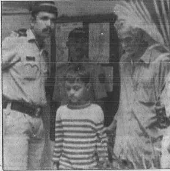
விசாரணை என்ற பெயரில் மாற்றிப் போலீசு நிலையத்தில் சிறை வைக்கப்பட்டுள்ள அப்பாவி முசுலீம்களைப் பார்த்துத் திரும்பும் அவர்களது உறவினர்கள்.