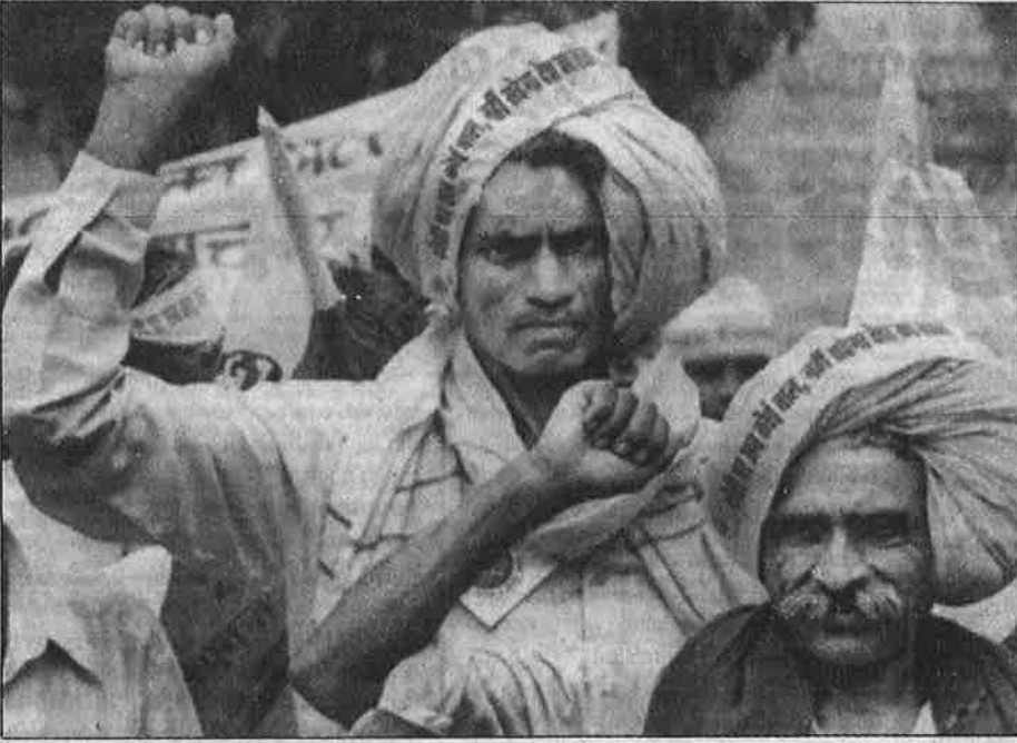
ஏழை நாடுகளின் விவசாயத்தைத் தாராளமயமாக்க உலக வர்த்தகக் கழகத்தில் நடக்கும் பேச்சு வார்த்தைகளை எதிர்த்து ம.பி. மாநிலத் தலைநகர் போபாலில் நடந்த விவசாயிகளின் ஆர்ப்பாட்ட பேரணி.