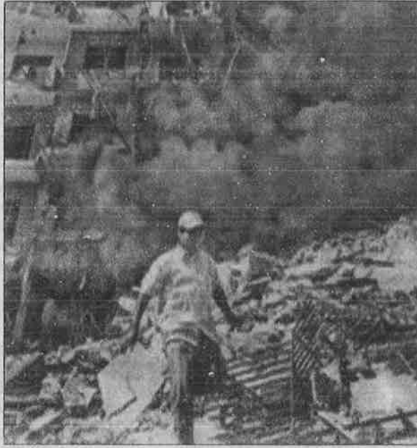
மக்கள் வசிக்கும் குடியிருப்புப் பகுதிகளின் மீது கொத்துக் குண்டுகளை வீசி அழிக்கும் இஸ்ரேலிய பயங்கரவாதம்.

லெபனானின் தெற்கு பகுதியில் செல்வாக்கு பெற்றுள்ள ஹிஸ்புல்லா இயக்கத்தைத் தாக்கி அழித்து முடமாக்குவது; ஹிஸ்புல்லா போன்ற தீவிரவாத இயக்கங்களைக் கட்டுப்படுத்தத் தவறிவிட்டதாகக் கூறி லெபனானை ஒடுக்கி தனது மேலாதிக்கத்தின் கீழ் கொண்டு வருவது; தம்மிடம் முரண்பட்டு நிற்கும் ஈரானையும் சிரியாவையும் தாக்குவதற்கான முன்னோட்டமாகவும் எச்சரிக்கை விடுப்பதாகவும் இப்போரை நீட்டிப்பது; மேற்காசியா எனப்படும் தற்போதைய மத்தியக் கிழக்கு நாடுகளை புதிய எல்லைகளுடன் மறுஒழுங்கமைப்பது - என்ற அமெரிக்க ஈழமானர்களின் போர்த்தந்திர திட்டப்படியே அதன் அடியாளான இஸ்ரேல் இப்போரைக் கட்டவிழ்த்து விட்டுள்ளது. "புதிய மத்தியக் கிழக்கை நிறுவும் நேரமிது; புதிய மத்தியக் கிழக்கு திட்டத்தை யார் ஏற்கவில்லையானாலும் அவர்களை நிர்பந்தித்துப் பணியச் செய்வோம்" என்று அமெரிக்காவின் நோக்கத்தை வெளிப்படையாகவே கூறியுள்ளார். அமெரிக்க வெளியுறவுச் செயலரான கண்டலீசா கெரல்.