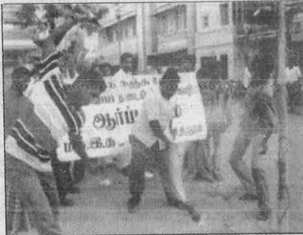
தஞ்சையில் ம.க.இ.க. - பு.மா.இ.மு. இணைந்து நடத்திய கோக் உடைப்புப் போராட்டம்.

இதனால், இந்தியத் தரக் கட்டுப்பாட்டுக் கழகம், பல அறிவியலாளர்கள், அறிவியல் மற்றும் சுற்றுச்சூழல் மையம், கோலா கம்பெனிகளின் பிரதிநிதிகள் ஆய்வு செய்து, விற்கப்படும் குளிர்பானங்களில் அனுமதிக்கக் கூடிய நச்சுப் பொருளின் அளவை வரையறுத்தனர்.