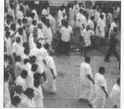
போலீசு பாதுகாப்போடு, கௌரவமாக பரிவட்டம் கட்டி தேரிழுக்க அழைத்து வரப்படும் நாட்டார்கள்.

நீதிமன்றமே கூட, அனைவரும் சமத்துவமாக தேர்வடமிழுக்க வேண்டும் என்று உத்தரவிடாமல், முதலில் நாட்டார்கள் இழுக்க பின்னர் அனைவரும் இழுக்க வேண்டும் என்றுதான்