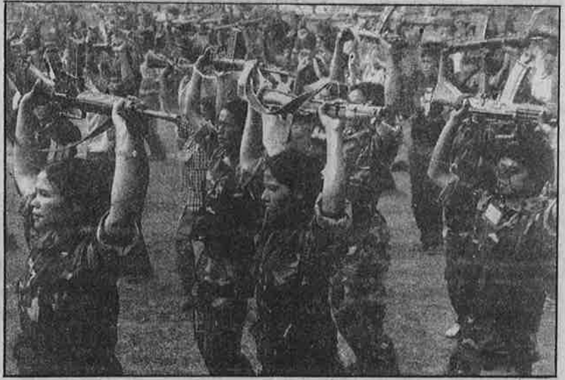
“மக்கள் படை ஒன்று இல்லாவிட்டால், மக்களுக்கு ஒன்றுமே இல்லை” — பயிற்சியில் ஈடுபடும் மாவோயிஸ்டுகளின் செம்படை.

தைச் சீர்குலைப்பதிலும் கம்யூனிஸ்டுகளுக்கு எதிரான உள்நாட்டுப் போரைத் தொடுப்பதிலும் இறங்கியது. அமெரிக்காவின் கைப்பாவையாகிவிட்ட கோமிண்டாங் பிற்போக்கு அரசின் அதிபர் சியாங்கை வேட்க, சதிகள் - சூழ்ச்சிகள் - துரோகங்களில் இறங்கி நாட்டு மக்களிடம் அம்பலப்பட்டுத் தனிமைப்பட்டுப் போனான். சீனக் கம்யூனிஸ்ட் கட்சியின் சமாதானம், ஜனநாயகம், கூட்டு அரசாங்கத்திற்கான முயற்சிகளை அதன் பயம், பலவீனம், கையாலாகாத தனத்தின் அறிகுறிகளாகக் கருதிக் கொண்டான். ஒப்பந்தத்தைக் கிழித்தெறிந்துவிட்டு, அமெரிக்காவின் துணையுடன் கம்யூனிஸ்டுகளுக்கு எதிரான உள்நாட்டுப் போரைக் கட்டவிழ்த்து விட்டான். ஆனால், கோமிண்டாங் பிற்போக்கு ஆட்சியாளர்களின் எத்தணிப்புகள் பெருந்தோல்வியில் போய் முடிந்தன. சீனக் கம்யூனிஸ்ட் கட்சிக்கு ஆதரவாக முன்வைக்கப் பெருமளவில் மக்கள் திரண்டார்கள். செம்படையில் சேர மேலும் பல்லாயிரக்கணக்கில் முன்வந்தனர். சிவப்பு விடுதலைப் பிரதேசங்கள் மேலும் விரிவடைந்தன. கோமிண்டாங் பிற்போக்கு - பாசிசக் கும்பலுக்கு எதிராக, புரட்சிகர வர்க்கங்கள் - ஜனநாயக சக்திகளுடன் ஐக்கிய முன்னணியைக் கட்டியமைத்து, உக்கிரமான உள்நாட்டுப் போரில் வென்று, சீன கம்யூனிஸ்ட் கட்சி சீன மக்கள் ஜனநாயகக் குடியரசை நிறுவியது.