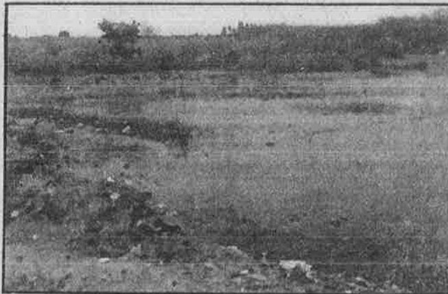
பொதுமக்களும் சத்திரப்பட்டி பெருந்து நிறுத்தம் அருகில் உள்ள, நோயை உற்பத்தி செய்யும் கழிவுநீர் குட்டை: அரசின் மெத்தனம்.

"சாதாரண வைரஸ் நோய்தான்; இதனால் உயிருக்கு ஆபத்து ஏற்ப டாது" என்று ஆரூடம் சொல்கிறது அரசு. ஆனால், அச்சாதாரண நோய்க்குக் கூட அரசு மருத்துவமனைகளில் உரிய சிகிச்சை கிடைப்ப தில்லை. சாதாரண நோய் புதிய வீரியத்துடன் தாக்கு வதற்குக் காரணம் என்ன என்பதைப் பற்றியும் அரசு அக்கறை காட்டுவ தில்லை. சிக்குன்குன்யா மட்டுமல்ல; ஏற்கெனவே ஒழிக்கப்பட்டு விட்டதா கக் கூறப்படும் காலரா, மலேரியா, பிளேக், அம்மை நோய், மூளைக் காய்ச்சல் முதலான பல வும் ஆண்டுதோறும்