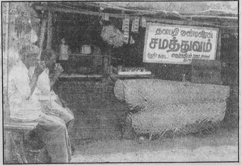
சாதி ஆதிக்கவாதிகள் விதித்துள்ள பொருளாதாரத் தடையை உடைக்கும் விதமாக, கே.வேலாயுதபுரம் தாழ்த்தப்பட்டோரால் திறக்கப்பட்டுள்ள தேநீர் கடைக்கு "சமத்துவம்" எனப் பெயர் வைக்கப்பட்டுள்ளது.

தங்களுடைய உயிருக்கும் வாழ்க்கைக்கும் உத்திரவாதம் இல்லாமல் அலுவலகத்தை விட்டுப் போக முடியாது என்று கூறி அங்கேயே அடுப்பு வைத்து சோறு பொங்கத் தொடங்கினார்கள் மக்கள். அடுப்பிலிருந்து புகை வருவதற்குள் போலீசு வந்தது. போலீசின் மிரட்டலுக்கு அஞ்சி மக்கள் கலைய மாட்டார்கள் என்பது புரிந்த பின்னர் 55 கி.மீ தூரத்திலுள்ள தூத்துக்குடியிலிருந்து மாவட்ட ஆட்சியர் வந்தார்.