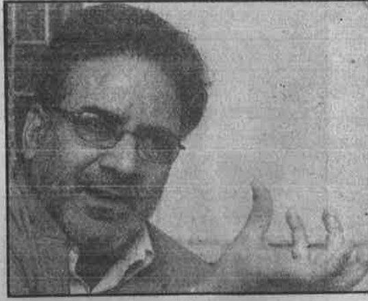
நேபாள மாவோயிஸ்டு கம்யூனிஸ்டு கட்சித் தலைவர் தோழர் பிரசந்தா.

மாவோயிஸ்டுகள் நாடாளுமன்றப் பாதைக்கு வந்துவிட்டதாகவும், அதே பாதையை இந்திய மாவோயிஸ்டுகளும் பின்பற்ற வேண்டும் என்றும் உபதேசிக்கிறார், வலது கம்யூனிஸ்டுக் கட்சி பொதுச் செயலாளரான பரதன். துப்பாக்கிக் குழாயிலிருந்து அதிகாரம் பிறக்கிறது என்ற மாவோவின் கூற்று பொய்த்துப் போய்விட்டது என்று மனநோயாளிபோல் அவர் உளறுகிறார். "இந்திய கம்யூனிஸ்டுகள் நாடாளுமன்ற ஜனநாயகத்தில் இணைந்து செயல்படுவதிலும் தேர்தல்கள் மூலம் அதிகாரத்துக்கு வருவதிலும் நீண்ட அனுபவம் பெற்றுள்ளார்கள். நேபாள மாவோயிஸ்டுகள் எங்கள் அனுபவத்திலிருந்து கற்றுக் கொள்ளவும் அமைதி வழிப் பாதையில் செல்லவும் விரும்புகிறார்கள்" என்று புளுகுவதோடு, மாவோயிஸ்டுகளைக் கொச்சைப்படுத்துகிறார் சி.பி.எம். கட்சியின் தலைவர்களில் ஒருவரான எச்சூரி. இதோடு, மாவோயிஸ்டுகள் ஆயுதங்களைக்