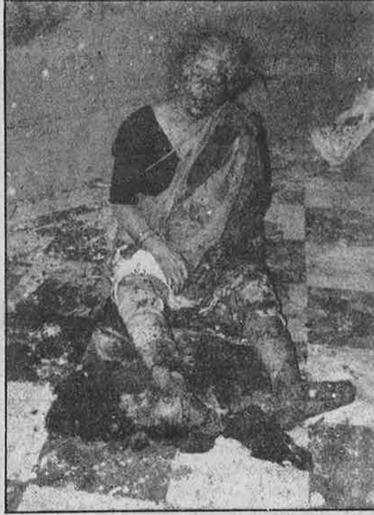
வாரணாசியில் நடந்த குண்டு வெடிப்பில் படுகாயமடைந்த பெண்.

மூன்றாவதாக, அயோத்தி பாபரி மசூதி இடிப்பு - அதைத் தொடர்ந்து,