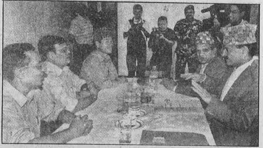
மேலாதிக்கவாதிகளின் முகத்தில் கரிபூசிய ஜூன் 16 ஒப்பந்தத்திற்காக, மாவோயிஸ்டுகளும் தற்காலிக அரசின் பிரதிநிதிகளும் நடத்தும் பேச்சுவார்த்தை.

இப்புதிய ஒப்பந்தப்படி, தற்போதைய தற்காலிக நாடாளுமன்றம் கலைக்கப்பட்டு புதிய இடைக்கால அரசு நிறுவப்படும்; புதியதொரு இடைக்கால சட்டம் இயற்றப்படும்; அதனடிப்படையில் அரசியல் நிர்ணய சபைக்கான தேர்தல் நடத்தப்படும்; அச்சபை, புதிய அரசிமலமைப்புச் சட்டத்தை இயற்றும்; அதைத் தொடர்ந்து நேபாள ஜனநாயகக் குடியரசு பிரகடனப்படுத்தப்பட்டு, புதிய அரசியலமைப்புச் சட்டப்படி பல கட்சி நாடாளுமன்ற ஜனநாயகம் நிறுவப்படும். இதற்கான கால வரையறை தீர்மானிக்கப்பட்டுள்ளதோடு, 31 பேர் கொண்ட போர் நிறுத்தக் கண்காணிப்புக் குழுவையும் இருதரப்பும் நிறுவியுள்ளன. 8 அம்சங்களைக் கொண்ட இந்த ஒப்பந்தத்தை