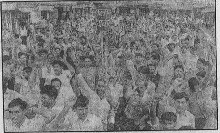
போலீசாரின் சட்டவிரோதக் கைது - கொட்டிடச் சித்திரவதை - தாக்குதல்களைக் கண்டித்து "லிபர்டி" நிறுவனத் தொழிலாளர்கள் நடத்தும் ஆர்ப்பாட்டம்.

பிரிட்டிஷ் ஆட்சிக் காலத்தில் 1926-ஆம் ஆண்டு இயற்றப்பட்ட சட்டத்தின் படி தொழிலாளியிடம் நன்னடத்தைப் பத்திரம் எழுதி வாங்குவதும்; முதலாளிகள் தொழிலாளர்களைப் பழி வாங்க திடீர் கதவடைப்பு செய்வதும், பணி இடைநீக்கம் செய்வதும் சட்டவிரோதமானவை. ஆனால், இந்தக் காலனியச் சட்டத்தைக் கூட முதலாளிகளும் மதிப்பில்லை; அரசும் மதிப்பில்லை. ஏற்றுமதி சார்ந்த உற்பத்திக்கு முன்னுரிமை தரப்படும் சிறப்புப் பொருளாதார மண்டலங்களில் முதலாளிகள் வைத்ததுதான் சட்டம். எஸ்மா, டெஸ்மா போன்ற சட்டங்கள் தொழிற்சங்க இயக்கங்களைப் பயங்கரவாத இயக்கங்களைப் போலத் தண்டிக்கின்றன. இந்த நிலைமைகள், வெள்ளைக்காரனுக்கு நாடு அடிமையாக இருந்த காலத்தில் தொழிலாளி வர்க்கம் நசுக்கப்பட்டதைவிடக் கேவலமான நிலைக்குச் செல்வதை எடுத்துக் காட்டுகின்றன.