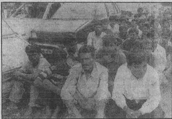
நள்ளிரவில் வீடு புழுந்து சோதனை நடத்தி, விசாரணைக்காக மாஹிம் போலீசு நிலையத்திற்கு இழுத்து வரப்பட்ட மும்பை நகர்ப்புறச் சேரிகளைச் சேர்ந்த ஏழை முகலீம்கள்.

மேலும், பாகிஸ்தான் ஏவிவிட்டு எல்லைக்கு அப்பாலிலிருந்து வரும்