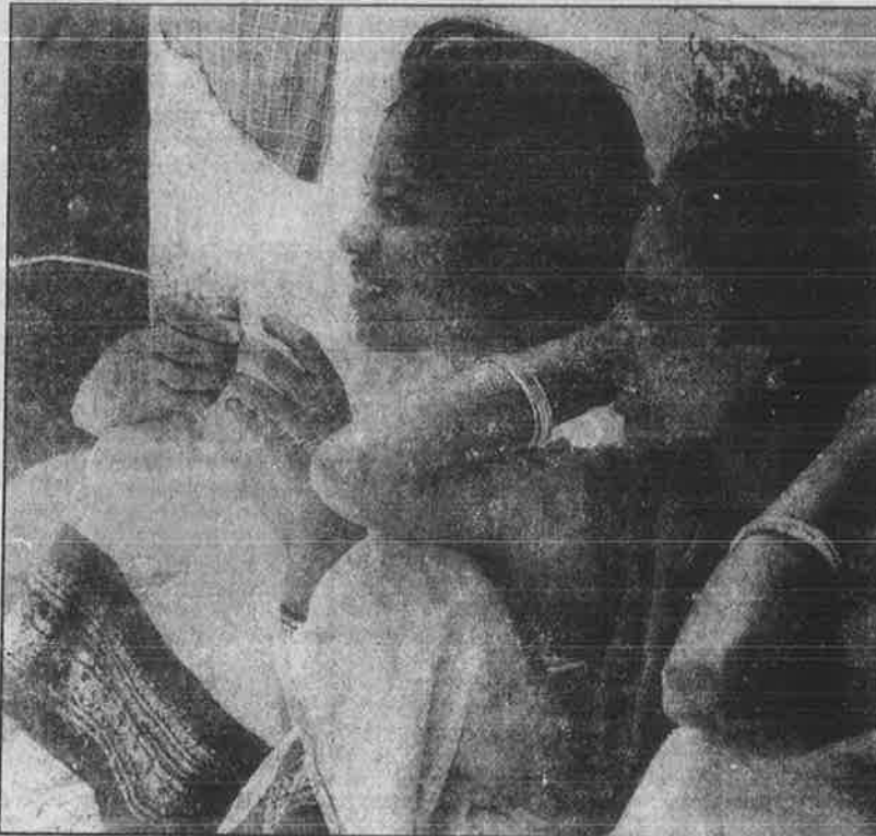
மாங்கல்யத் திட்டத்தின் கீழ் கொத்தடிமையாக அவதிப்பட்டு ஊர்திரும்பியுள்ள கீழ்குயில்குடி கிராமத்து தலித் சிறுமிகள்.

இச்சிறுமிகள் ஓய்வில்லாத வேலை, சத்தில்லாத உணவு, சிறிய அறையில் கும்பலாகத் தங்க வைப்பது, உடல்நிலை சரியில்லை என்றாலும் சிகிச்சை செய்ய மறுப்பது, ஆண்டுக்கு ஒரு முறை 5 நாட்கள் மட்டுமே விடுமுறை என கொத்தடிமைகளாக வதைபடுகின்றனர். இதுதவிர பல சிறுமிகள் பாலியல் கொடுமைகளையும் சந்திக்கின்றனர். கசக்கிப் பிழியப்படும் இச்சிறுமிகள் மூன்றாண்டு களுக்குப் பிறகு வீடு திரும்பும் போது காசநோய், ஆஸ்துமா, இரத்தசோகை, கருப்பைபாதிப்பு