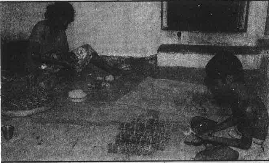
சிவகாசி அருகே விஜயகரிசல்குளத்தில் உயிருக்கு ஆபத்தான பட்டாசு தயாரிப்புத் தொழிலில் பெற்றோருடன் கொத்தடிமையாக உழலும் சிறுவன்.