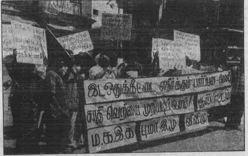
இட ஒதுக்கீட்டை எதிர்க்கும் பார்ப்பன - மேல்சாதி வெறியை அம்பலப்படுத்தி புரட்சிகர அமைப்புகள் மதுரையில் நடத்திய ஆர்ப்பாட்டம்.

* நிலவும் சமுதாயப் பொருளாதார, அரசியல் அமைப்பின் மீது வெறுப்புறும் பல்வேறு பிரிவு மக்களும் தங்களுக்கு எதிரான கலகத்தில் இறங்கிவிடக் கூடாது என்பதற்காகவே, "இந்த ஆட்சியில் தாங்களும் பங்கு பெறுகிறோம்" என்கிற மாயையை உருவாக்குவதற்காகவே, கொண்டு வரப்பட்டதுதான் இட ஒதுக்கீடு என்ற "நிறுவனமயமாக்கும் கொள்கை." இந்த அடிப்படையில்தான் உலகின் பல நாடுகளிலும் ஆளும் வர்க்கங்களே இட ஒதுக்கீடு ஏற்பாட்டைச் செய்கின்றனர். ஆங்கிலேயக் காலனியவாதிகள் முதல் ஆளும் காங்கிரசு - ஐக்கிய முற்போக்குக் கூட்டணி அரசுவரை இப்படித்தான், இதற்காகத்தான் செய்கின்றனர். தமிழினவாதிகள் உட்பட சமூக அநீதிக்காரர்கள் கருதுவதைப் போல நீதிக்கட்சியினரோ, திராவிடர் கழகத்தினரோ முன்வைத்துப் போராடிப் பெற்ற உரிமையல்ல. ஆட்சியாளர்களால் புகுத்தப்பட்ட நிறுவனமயமாக்கும் இட ஒதுக்கீட்டுக் கொள்கையை சாதி இந்துக்களுக்குச் சாதகமாகத் திருப்பிக் கொண்டதுதான் நீதிக்கட்சிக்காரர்களின் "வகுப்புரிமைப் போர்." தங்களது ஏகபோக ஆதிக்கம் "பறிபோகிறதே" என்று ஆத்திரமுற்று இட ஒதுக்கீட்டுக் கொள்கையை பார்ப்பனர்கள் எதிர்த்தபோது, அதை முறியடிக்கத் திராவிடர் கழகத்தினர் நடத்தியதுதான் பார்ப்பனிய எதிர்ப்புப் போராட்டம்.