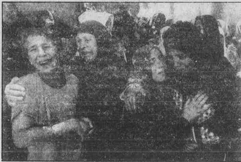
காசாமுனை கடற்கரையில் கூடியிருந்த பாலஸ்தீன மக்கள் மீது இஸ்ரேல் நடத்திய வான்வழித் தாக்குதலில் கொல்லப்பட்டோரின் உறவினர்கள் கதறியழும் வேதனை.

றது. இன்று பாலஸ்தீன மருத்துவமனைகளில் அத்தியாவசிய மருந்துகள் கூட இல்லை. ஏறத்தாழ 1,60,000 அரசு ஊழியர்களுக்குப் பல மாதங்களாக சம்பளம் கொடுக்க முடியவில்லை. ஏறத்தாழ 12 லட்சம் பாலஸ்தீன மக்கள் பட்டினிச் சாவின் விளிம்பில் நிற்பதாக ஐ.நா. மன்றமே ஒப்புக் கொண்டுள்ளது. கடந்த ஜனவரி முதல் பாலஸ்தீன அதிகாரத்துக்கு உட்பட்ட பகுதிகளுக்கு அத்தியாவசிய உணவுப் பொருட்களை