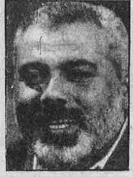
இஸ்ரேல் அரசின் கொலைப் பட்டியலில் சேர்க்கப்பட்டுள்ள பாலஸ்தீன பிரதமர் இசுமாயில் ஹனியே.

1948 முதல் இஸ்ரேலிய ஆக்கிரமிப்பை எதிர்த்து தமது மண்ணை மீட்க பாலஸ்தீன மக்கள் தொடர்ந்து போராடிவந்த நிலையில், பாலஸ்தீனத்துக்கும் இஸ்ரேலுக்குமிடையே இணக்கமாக உறவை ஏற்படுத்துவதாகவும், சுயாட்சிக்கான பாலஸ்தீன அதிகார அமைப்பைத் தோற்றவிட்பதாகவும் கூறிக் கொண்டு அமெரிக்கா தலைமையிலான ஏகாதிபத்தியங்கள் "ஆஸ்லோ ஒப்பந்தம்" எனப்படும் துரோக ஒப்பந்தத்தைத் திணித்தன. அதை ஏற்றுக் கொண்டு தற்காலிகத் தீர்வைத் தேடி யது, அராபத் தலைமையிலான பாலஸ்தீன விடுதலை இயக்கம். ஒப்பந்தப்படி, பாலஸ்தீன அதிகார அமைப்பு தோற்றுவிக்கப்பட்டது. ஆனால், அது ஒரு பஞ்சாயத்துக்கு உள்ள அதிகாரம் கூட இல்லாமல் வெறும் கொலு பொம்மையாகவே இருந்தது. மறுபுறம், ஆஸ்லோ ஒப்பந்தத்தைக் கழிப்பறைக் காகித மாக்கி விட்டு எல்லா வகையான பயங்கரவாத அட்டூழியங்களிலும் இஸ்ரேல் இறங்கியது. பல்லாயிரக்கணக்கான