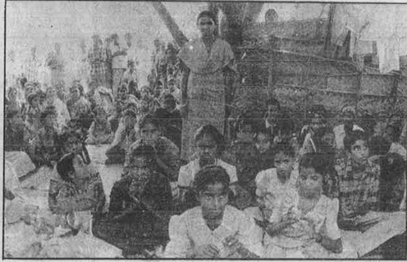
கடன் தொகையை வட்டியுடன் செலுத்தி, குடியாத்தத்தில் தன்னார்வக் குழுவினரால் கொத்தடிமைத்தனத்திலிருந்து மீட்கப்பட்ட குழந்தைகள்.

குழந்தைத் தொழிலாளர் உழைப்பு முறையிலும் கொத்தடிமைத்தனத்திலும் முன்னணியில் நிற்கும் மாநிலங்களில் ஒன்றாக தமிழகம் திகழ்கிறது. தமிழகத்தில் 2003-ஆம் ஆண்டில் 70,344 குழந்தைத் தொழிலாளர்கள் இருந்தனர் என்றும்,