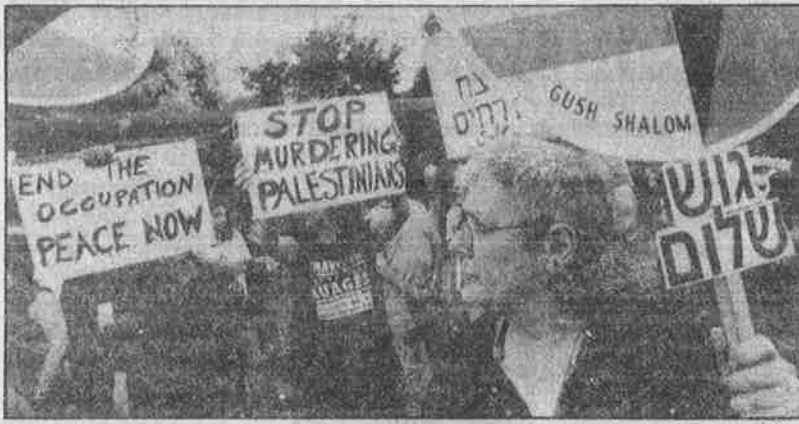
காசா முனை கடற்கரைப் பகுதியில் இஸ்ரேல் நடத்திய வான்வழித் தாக்குதலைக் கண்டித்து, இஸ்ரேலைச் சேர்ந்த அமைதி இயக்கத்தினர் இஸ்ரேல் ராணுவத் தளபதி வீட்டின் முன் நடத்திய ஆர்ப்பாட்டம். எதிரி நாட்டில் நடந்த இத்தகைய கண்டன ஆர்ப்பாட்டங்கள் கூட, இஸ்லாமிய நாடுகளில் நடக்கவில்லை.

பாலஸ்தீன மக்கள் வீடிழந்து வாழ் விழந்து உற்றார் - உறவினர்களை இழந்து பரிதவித்தனர். ஏகாதிபத்திய உலகமோவாய்ப்புடிக் கிடந்தது.