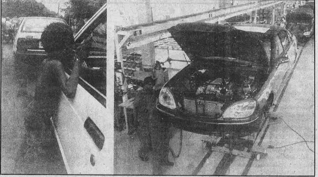
ஏழ்மையும், வளர்ச்சியும் - வல்லரசாகக் களவு காணும் இந்தியாவின் எதிர் எதிரான முகங்கள்.

ஆதாயம் பெற வேண்டும்" என்கிறார், உலக மென்பொருள் ஏகபோக முதலாளி பில்கேட்ஸ்.