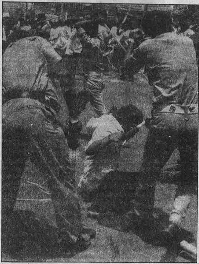
சமூக நீதிக் காவலர்களுள் ஒருவரான நிதிஷ்குமாரின் ஆட்சி நடக்கும் பீகாரில், இட ஒதுக்கீட்டிற்கு ஆதரவாகப் போராடிய மருத்துவக் கல்வி மாணவர்களைக் கொடுரமாகத் தாக்கும் போலீசு.

கேள்வியை அழைக்கும் முறை, மாற்றுக் கருத்துக்களைக் காமாலைக்கண் கொண்டு பார்க்கும் பார்வை, மாற்றாரும் எண்ணிப் பார்க்காத வகையில் அவர்களுடைய நிலைக்கு இவர்களே தரும் வியாக்கியானம் எல்லாவற்றிலும் பாசிசத்தனமான கருத்துத் திணிப்புத்தான் இருக்கிறது. காசுமீர் பிரச்சினையில் இந்தியாவின் நிலையை ஆதரிக்கிறீர்களா, இல்லையா என்ற கேள்விக்கு