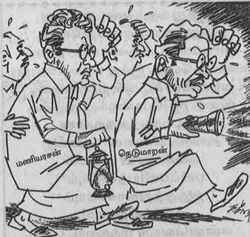
மார்வாடி - குஜராத்தி சேட்டுகளை எதிர்க்கும் தமிழ் முதலாளிகளைத் தேடி...

அரசு எந்திரத்திற்கான இடஒதுக்கீட்டில் பங்கேற்பதற்கு பெரியாரின் உயிர்மூச்சான சமூகநீதித் தத்துவத்தையும், நாடாளுமன்ற - சட்டமன்றப் புறக்கணிப்புக்குப் பண்டித நேருவின் கொள்கையையும் அடிப்படையாகக் கொண்டிருக்கிறார்கள் என்பதை