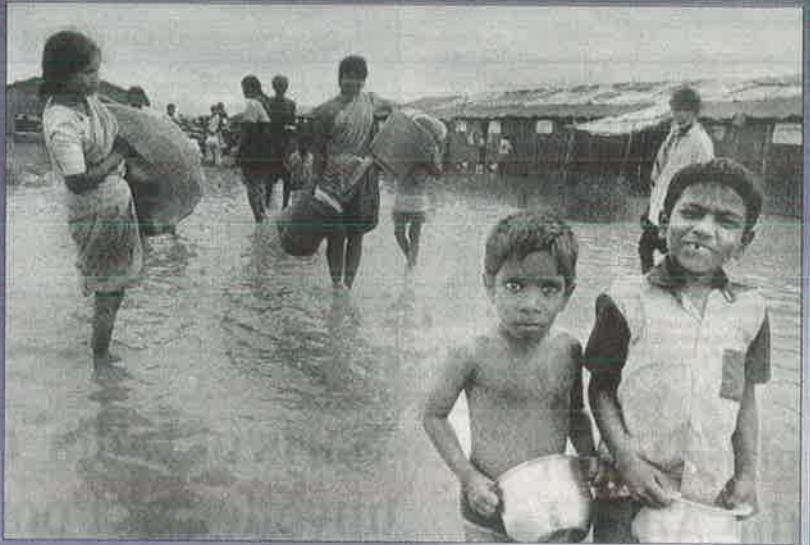
தென்சென்னை - சுண்ணகி நகரில் தற்காலிக வீடு என்ற பெயரில் கட்டிக் கொடுக்கப்பட்ட தரைக் கொட்டகைகள் மழை - வெள்ளத்தில் மிதக்கத் தொடங்கி விட்டதால், மூட்டை முடிச்சுகளோடு வெளியேறும் மீனவர்கள்.

"தமிழக அரசு மீனவர்களுக்கு 1,30,000 நிர்ந்தர வீடுகள் கட்டிக்