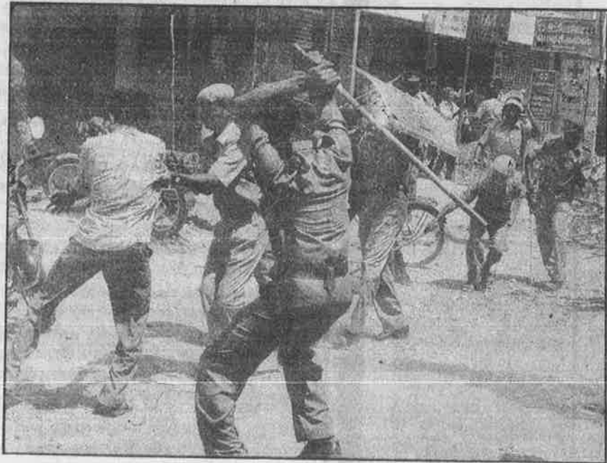
அடிப்படை வசதிகோரி மனு கொடுக்கப்போனபொழுது, சென்னை - அடையாறில் போலீசாரால் சுற்றி வளைத்துத் தாக்கப்பட்ட பொது மக்கள் (மேல்படம்); சென்னை - துரைப்பாக்கத்தில், அடிப்படை வசதி கோரியதற்காக போலீசாரால் மிருகத்தனமாகத் தாக்கப்படும் இளைஞர்.

இந்த நாட்டு ஆட்சி நிர்வாகம் அதிகாரபூர்வமாகவும், சட்டபூர்வமாகவும், நிர்வாகபூர்வமாகவும் எப்படி ஒழுங்கமைக்கப்பட்டிருக்கிறது? தொழில், விவசாயம், சட்டம் - ஒழுங்கு, நீதி-சிறை, கல்வி, மருத்துவம், பொதுமராமத்து, சமூக நலன், தொழிலாளர் நலன், கூட்டுறவு, உணவுப் பொருள் விநியோகம், வருவாய் - வரி, விளையாட்டு, கால்நடை, கைத்தறி, செய்தித் தொடர்பு - இப்படிப் பல பத்துத் துறைகளாக நிர்வாகம் பிரிக்கப்பட்டுள்ளது. தலைநகர் முதல் கிராமப் பஞ்சாயத்து வரை ஒன்றின் கீழ் ஒன்றாக பல அடுக்குகளில் நிர்வாகப் பொறுப்பாளர்கள் உள்ளனர். இலட்சக்கணக்கான அதிகாரிகளும், அலுவலர்களும், ஊழியர்களும் அந்தந்தத் துறைப் பணிகளைச் செய்திட வேண்டும். அந்தந்தத் துறைசார்ந்த அமைச்சுப் பொறுப்பு அதிகாரிகளும், அமைச்சர்களும் கூட உண்டு.