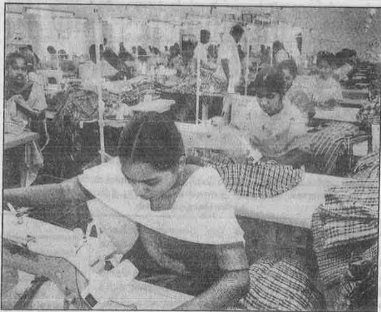
ஏற்றுமதியின் மூலம் அரசும், முதலாளிகளும் அமெரிக்க டாலர்களைச் சம்பாதிக்க, எவ்வித உரிமைகளும் இன்றிக் கொத்தடிமைகளைப் போல நடத்தப்படும் ஆயத்த ஆடை தொழிலாளர்கள்.

இறங்குவதும் புதிதல்ல என்னினார்கள், தொழிலாளர்கள். அந்நகர போலீசார் பலருக்கு தனது ஸ்கூட்டர்களை அன்பளிப்பாக வழங்கியிருக்கிறது ஹோண்டா நிர்வாகம். ஐ.இலை 25 போலீசு அராகஜம் நாடெங்கும் அம்பலமான பிறகும் "தொழிலாளர் போராட்டங்கள் நசுக்கப்பட வேண்டும்" என்று பத்திரிகைகளுக்குப் பேட்டி கொடுக்கிறார் அந்நகரின் போலீசு ஆணையர்.