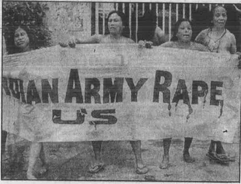
மணிப்பூர் மாநிலத்தில் நடந்து வரும் சுயநிர்ணய உரிமை போராட்டத்தை ஒடுக்கும் முகமாக, இந்திய இராணுவம் நடத்திவரும் பாலியல் வன்முறைகளை, போலி மோதல் கொலைகளை அம்பலப்படுத்தி நடந்த நிர்வாணப்போராட்டம்: பெண்ணியவாதிகளுள் எத்தனைபேர் இந்தப் போராட்டத்தை ஆதரித்துக் கருத்துச் சொல்லியிருக்கிறார்கள்?

பெரும்பாலான தமிழ் பெண்கள் “கட்டுப்பெட்டித்தனமாக” வாழும் போதே, ஆண்கள் வழிதவறிப் போன தற்கு பெண்கள் தான் காரணம், அவர் கள் உடுத்தும் உடைதான் காரணம் என்ப பழிப்போடும் ஆணாதிக்கத் திமி