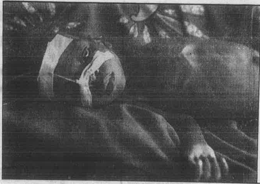
ஏகாதிபத்தியங்கள் செயற்கையாக உருவாக்கிய பஞ்சம் - பட்டினியால் பாதிக்கப்பட்டு, எலும்பும் தோலுமாக உயிருக்குப் போராடும் நைஜர் நாட்டுச் சிறுவன்.

மாக்கிய ஏகாதிபத்தியங்களின் சதி ஒரு புறம் இருக்கட்டும். "வளர்ச்சிக்கும், முன்னேற்றத்துக்கும் இட்டுச் செல்லும் நல்லாட்சி" என்பதன் உண்மையான பொருள் என்ன தெரியுமா?