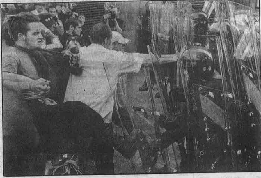
ஸ்காட்லாந்தின் க்ளென் ஈகிள்ஸ் நகரில் நடந்த ஜி-8 நாடுகளின் மாநாட்டின் மோசடித்தனத்தைக் கண்டித்து, எடின்பர்க் நகரில் நடந்த ஆர்ப்பாட்டத்தின் பொழுது, போலீசாரோடு நடந்த மோதல்.

நிற் கு ம் பொழுது, அந்நாட்டுத் தலைநகரில் உள்ள ஐந்து நட்சத்திர விடுதியில் ஒரு காபிக்கு ஏழு வகை யான ஜீனி பரிமாறப்படு வதைக் குறிப் பிட்டு, அந் நாட்டில் செல் வம் ஒரு பக்க மும்; ஏழ்மை யும் பட்டினி யும் ஒரு பக்க மும் குவிந்து கிடப்பதை அம்பலப்ப டுத்துகிறார். ஒரு பத்திரி கையாளர்.