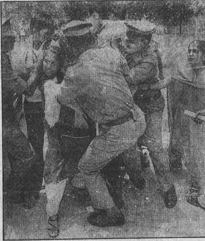
கல்விக் கட்டணத்தைக் குறைக்க வேண்டும் எனக் கோரி மனு கொடுக்கப் போன இந்திய மாணவர் சங்கத்தைச் சேர்ந்த பெண்கள் மீது பாய்ந்து குதறும் போலீசார்.

ஜெயலலிதா, நிர்வாக சூரப்பிலி என்ற பெயரெடுத்த கருணாநிதி — இரு வருமே போலீசை நம்பித்தான் அரசு நிர்வாகத்தை நடத்துகின்றனர். போட்டி போட்டுக் கொண்டு போலீசுக்கு சலுகைகளை வாரி இறைக்கின்றனர். அரசு நிர்வாகம் மட்டுமல்ல, சொந்தக் கட்சியினரையும், மாற்றுக் கட்சி