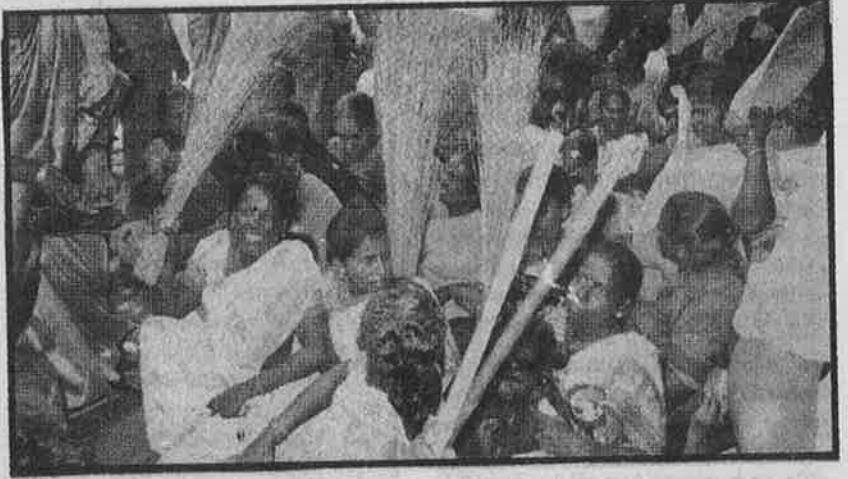
நடிகை குஷ்புவைக்கு எதிராக சென்னையில் நடந்த ஆர்ப்பாட்டம்.

ஒருபுறம் மேட்டுக்குடி பெண்களிடம் “பாலியல் புரட்சி” கருத்துக்களைத் தோற்றுவிக்கும் தாராளமயம், இன்னொருபுறமோ அடித்தட்டு வர்க்குப் பெண்களின் “கற்புக்கே” உலைவைத்து விடுகிறது. தனியார்மயம் - தாராளமயம் விவசாயத்தையும், கைத் தொழிலையும், சிறு தொழில்களையும் அழித்துக் கொண்டே போவதால்,