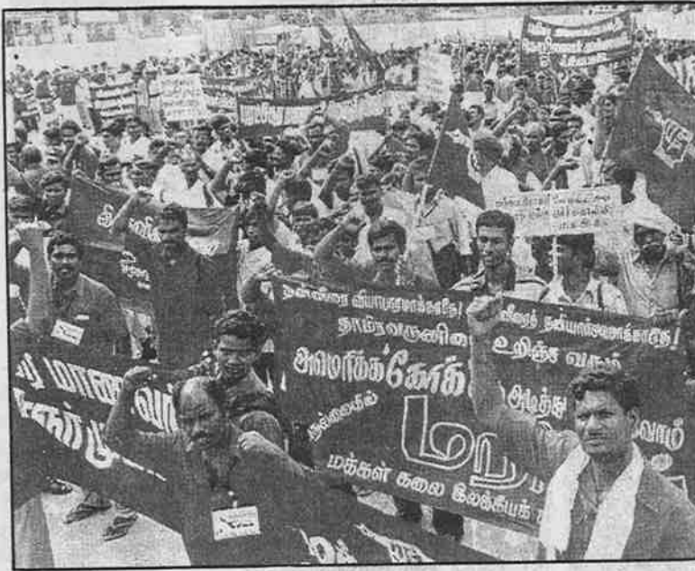
தாமிரவருணியை உறிஞ்சுவரும் கோக் ஆலையை எதிர்த்து நெல்லை நகரில் நடந்த ஆர்ப்பாட்டப் பேரணி.

கம் செய்யப்பட்ட பிளக்ஸ் கேலிச் சித்திரங்கள் ஆகியவற்றுடன் அங்கே இரண்டு நாட்கள் நடைபெற்ற பிரச்சாரம் பல்வேறு மலையாள நாளிதழ்களில் வெளியாகி உள்ளது. நெல்லை போராட்டம் குறித்த செய்திகளையும் இந்நாளேடுகள் வெளியிட்டுள்ளன. ஏற்கெனவே பிளாச்சிமடா போராட்டத்தினூடாக கோக் எதிர்ப்பு உணர்வு பெற்றிருக்கும் கேரளத்து மக்களிடம் இப்போராட்டம் வரவேற்பு பெற்றுள்ளது.