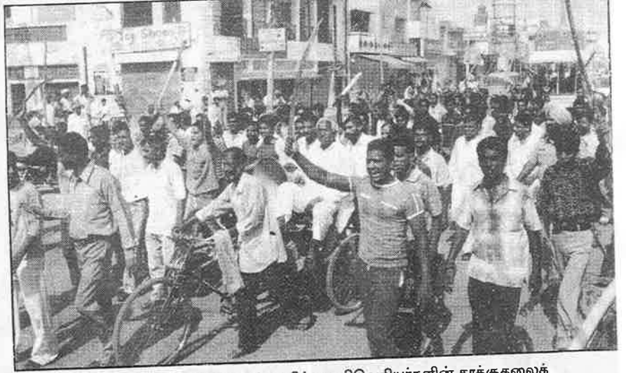
நான்குநாள்கள் அதிகரித்து வரும் ஆதிக்க சாதிவெறியர்களின் தாக்குதலைக் கண்டித்து தாழ்த்தப்பட்டோர் நடத்தும் ஊர்வலம்.

ஆனால், கோஹனா நகரத்து தலித்துகள், சினிமா கழிசடைகள் போன்றோ, ஒட்டுப் பொறுக்கி அரசியல்வாதிகள் போன்றோ அல்லது கந்து வட்டி, மணல் திருட்டு, கள்ளச்சாராயம் காய்ச்சும் திடீர் பணக்கார பொறுக்கிகள்