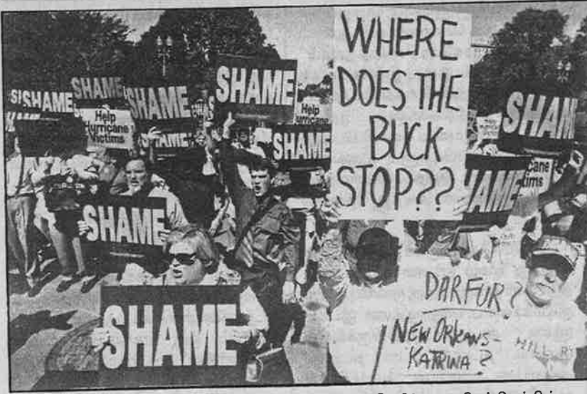
குறாவளியில் இருந்து மக்களைக் காப்பாற்றாத அமெரிக்க ஏகாதிபத்தியத்தின் அலட்சியத்திமிரை, "வெட்கக் கேடு" எனக் கண்டித்து அதிபர் மானிகையின் முன் நடந்த ஆர்ப்பாட்டம்.

முழக்க காரணம், கடந்த 5 ஆண்டு களாக பராமரிப்பு இல்லாமல் இருந்த கடலோரப் பாதுகாப்புத் தடை அரண்கள் குறாவளி தாக்கி உடைந்து விட்டன. இதனால் 3 இடங்களில் மொத்தம் 1000 அடிநீள் உடைப்புகள் ஏற்பட்டு, அதன் வழியாகத்தான் கடல்நீர் புகுந்து நகரைச் சூறையாடி விட்டது.