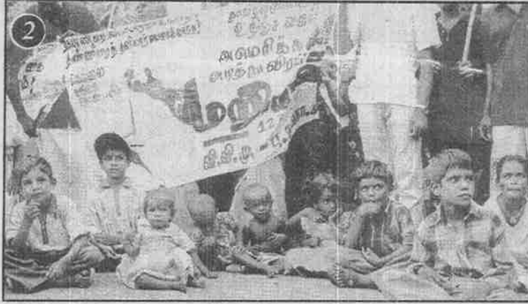
கங்கை கொண்டானில் நடந்த மறியலில் பங்கெடுத்துக் கொண்ட தோழர்கள் மற்றும் குழந்தைகள்.

வேண்டிய நிர்ப்பந்தத்தையும், ஏதேனும் செய்தாக வேண்டிய கட்டாயத்தையும் இப்போராட்டம் ஏற்படுத்தி வருகிறது.