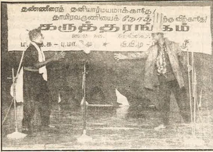
தண்ணீரைக் கொள்ளையடிக்கும் அமெரிக்காவின் மேலாதிக்கத்தை அம்பலப்படுத்தும் ம.க.இ.க.வின் நாடகம்.

“நிலத்தடி நீர் ஆதாரங்களைப் பயன்படுத்துவது பற்றித் கூறும் இக் கொள்கை, சென்னைக்கு வீராணம் ஏரியில் இருந்தும்; கிருஷ்ணாவில் இருந்தும் தண்ணீர் கொண்டு வருவதற்கு 200 கோடி ரூபாய் செலவாகிறது. இதற்குப் பதிலாக, சென்னைக்கு அடுத்துள்ள கிராமப்புறங்களில் உள்ள நிலத்தடி நீரை கொண்டு வந்தால், 20 கோடிதான் செலவாகும். இதற்கு, சென்னையைச் சுற்றியுள்ள கிராமப்புற விவசாயிகளை, நெற் பயிர் போட வேண்டாம் எனக் கட்டாயப்படுத்த வேண்டும் என ஆலோசனை கூறுகிறது.”