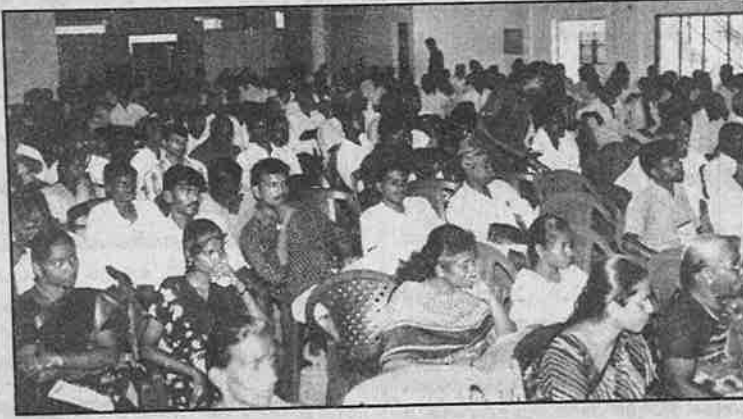
சுருத்தரங்கில் கலந்துகொண்ட பார்வையாளர்களில் ஒரு பகுதி.

கொள்ளை தடைப்பட்டுப் போகும் என்பதால்தான் தண்ணீர் திறந்துவிடுவதில்லை. ஏற்கெனவே ஸ்டெட்ரலைட், ஸ்பிக் ஆகிய ஆலைகள் தாமிரவருணி தண்ணீரை உறிஞ்சிக் கொள்வதால், தண்ணீர் பஞ்சம் நிலவுகிறது. இடையே அந்நியர்களையும் தண்ணீரை உறிஞ்ச அனுமதிப்பது மன்னிக்க முடியாத குற்றம்”