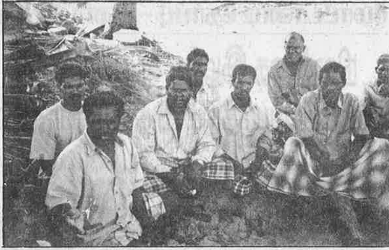
"உங்களுக்காக உயிரைக் கொடுத்திருக்கிறோம்; எங்களை எப்பொழுது கடலுக்கு அனுப்புவீர்கள்?" எனக் கேட்கும் தேவனாம்பட்டின கட்டுமர மீனவர்கள்.

"சுனாமி மீண்டும் வராது. வதந்தியை நம்பாதீர்கள்" என்று போலீசு மூலம் திடீரென அறிவிப்பு செய்யும் அரசாங்கம், சுனாமி என்பது என்ன? ஏன் மீண்டும் வராது என்று ஒரு பிரசுரம்