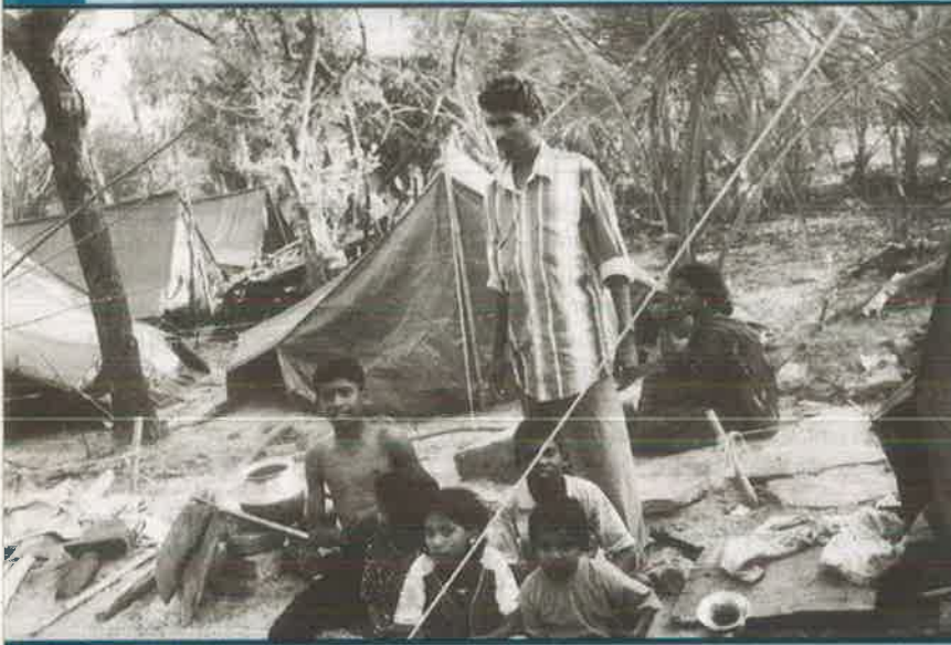
விவேக் ஓபராய் கட்டிக் கொடுத்த 'வீடு'; இராணுவம் போட்டுக் கொடுத்த கூடாரங்கள் (கீழே) - மீனவர்களின் வாழ்க்கையோ வெட்ட வெளியில்...

எப்படியும் தீண்டி விடுவதென சூடுகாட்டில் அலையும் பாம்புகள் போல் மீனவர்களின் பிணங்களைச் சுற்றித் திரிகின்றன ஆர்.எஸ்.எஸ். கும்பல், இப்போது விவேக் ஓபராய் போன்றவர்களை முன்நின்று வெளிப்படையாகவே சீறிக்கின்றன!