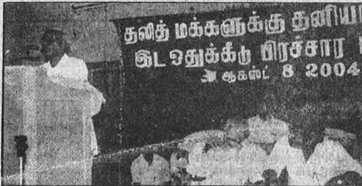
எஸ்.சி./எஸ்.டி. நலச் சங்கத்தினர் தனியார்துறையில் இடஒதுக்கீட்டை அமல்படுத்தக் கோரி நெய்வேலியில் நடத்திய மாநாடு.

அதேசமயம் பிற்படுத்தப்பட்ட சாதிகள் என்றுகூறிக் கொண்டு உண்மையில் ஆதிக்கசாதிகள் இடஒதுக்கீட்டைப் பயன்படுத்தி பதவிச் சண்டையில் ஈடுபடுவதையும், பார்ப்பன மற்றும் பிற மேல் சாதிகள் இடஒதுக்கீட்டிற்கு எதிராக வரிந்து கட்டிக் கொண்டு நிற்பதையும் கடுமையாக எதிர்த்துள்ளோம்.