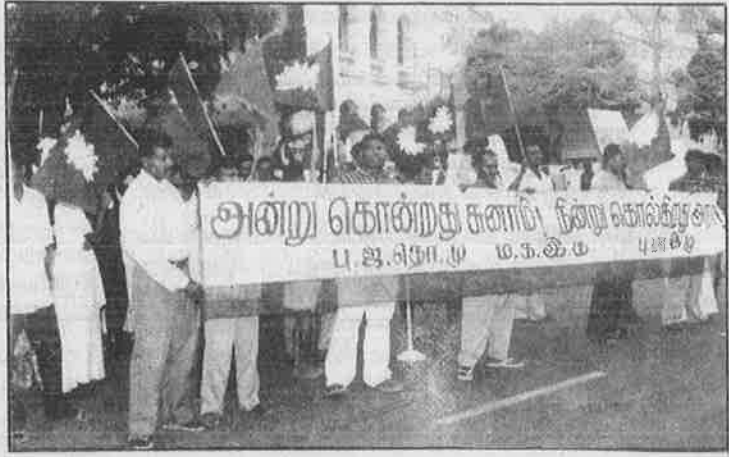
நிவாரணப் பணிகளை மெத்தனமாகச் செய்து அலட்சியப்படுத்தி வரும் அரசை எதிர்த்து சென்னையில் நடத்தப்பட்ட ஆர்ப்பாட்டம்.

இருப்பினும், தனியார் முதலாளிகளின் இந்த 'இரக்கவுணர்ச்சி' நாலே நாளில் வற்றிக் காய்ந்துவிட்டது. ஜனவரி முதல் நாளன்றே திருவாரூர் மெரினா ஹாலின் உரிமையாளரும், அ.தி.மு.க. காலிகளும் சேர்ந்து கொண்டு மக்களை