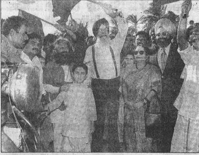
தேவனாம்பட்டினம் கிராமத்தில் மீனவர்கள் மீண்டும் 'தொழிலுக்குப் போவதை'க் கொடி அசைத்துத் துவக்கி வைக்கும் ஆளுநர் பர்னாலா: அதிகார வர்க்கத்தின் மோசடி பிரச்சாரம்.

மனிதாபிமான அடிப்படையில் பொது மக்கள் நிவாரணத்தில் பங்கு கொள்வதையும், அரசு சாரா நிறுவனங்கள் செய்யும் 'சேவையையும்' ஒன்றாகப் பார்க்க முடியாது. தேவனாம்பட்டினத்தைச் சேர்ந்த மீனவப் பெண், "விவேக் ஓபராய் எங்கள் நாட்டை அடமானம் வைத்து டாலர் வாங்குகிறார். எவ்வளவு பணம் வாங்குகிறார்கள்? என்ன செலவு? யாருக்குத் தெரியும்?" என்றார். அவரின் இந்தச் சாட்டையடி, விவேக் ஓபராய்க்கு மட்டுமல்ல, எல்லா அரசு சாரா அமைப்புகளுக்கும்