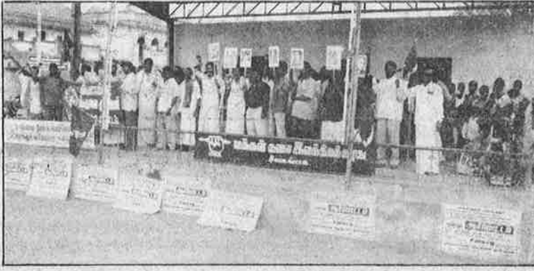
தாழ்த்தப்பட்ட ஏழை விவசாயியின் நிலம் அநியாயமாகப் பறிக்கப்படுவதையும், போலி கம்ப்யூனிஸ்டுகளின் அடாவடித்தனங்களையும் எதிர்த்து காளையார் கோவிலில் வி.வி.மு. நடத்திய ஆர்ப்பாட்டம்.