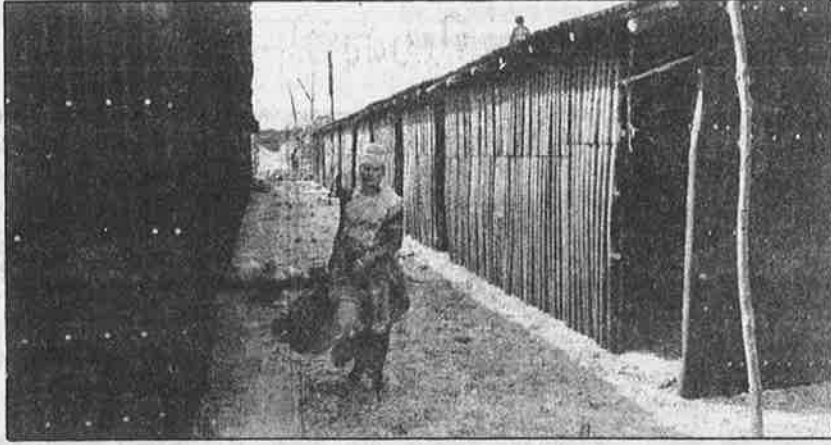
காற்றுப் புகக் கூட ஜன்னல் இல்லாமல் தமிழக அரசு கட்டி வரும் இந்தத் தகரக் கொட்டகைகளை வீடென்றா சொல்ல முடியும்?

சுனாமி யால் பெரிதும் பாதிக்கப்பட்ட நாகப்பட்டினத்தைச் சேர்ந்த மீனவர்கள் சனவரி மாத மத்தியிலேயே கடலுக்குப் போகத் தொடங்கிவிட்டதாகப் பத்திரிகைகளில் புகைப்படங்கள் வெளியிடப்பட்டன.