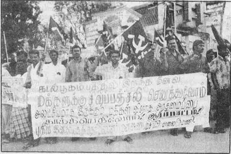
திருவாரூரில் நிவாரண முகாமில் இருந்து மக்களை வெளியேற்ற முயன்ற போலீசு அதிகாரிகளையும், அ.தி.மு.க. காலிகளையும் கண்டித்து நடத்தப்பட்ட சாலை மறியல் (மேலே); ஓசூரில் நடைபெற்ற ஆர்ப்பாட்டம்.

டையே தோழர்கள் உரையாற்றிக் கொண்டிருக்கும் போதே "அனுமதி வாங்காமல் எப்படிக் கூட்டம் நடத்தலாம்" என்று கூட்டத்தைத் தடுக்க முயன்றார் டி.எஸ்.பி. கூடியிருந்த மக்களோ "தோழர்களே, நீங்க பேசுங்க. போலீசு நாங்க பாத்துக்குறோம். எங்கள் வேலும்னா கைது பண்ணட்டும்" என்று குரல் கொடுத்தார்கள். பாதிக்கப்பட்ட கடலோர மாவட்டங்கள் மட்டுமின்றி நாங்கள் இயங்கிவரும் பிற மாவட்டப் பகுதிகளிலும் புரட்சிகர அமைப்புகள் ஆர்ப்பாட்டங்களையும், தெருமுனைக் கூட்டங்களையும் நடத்தின.