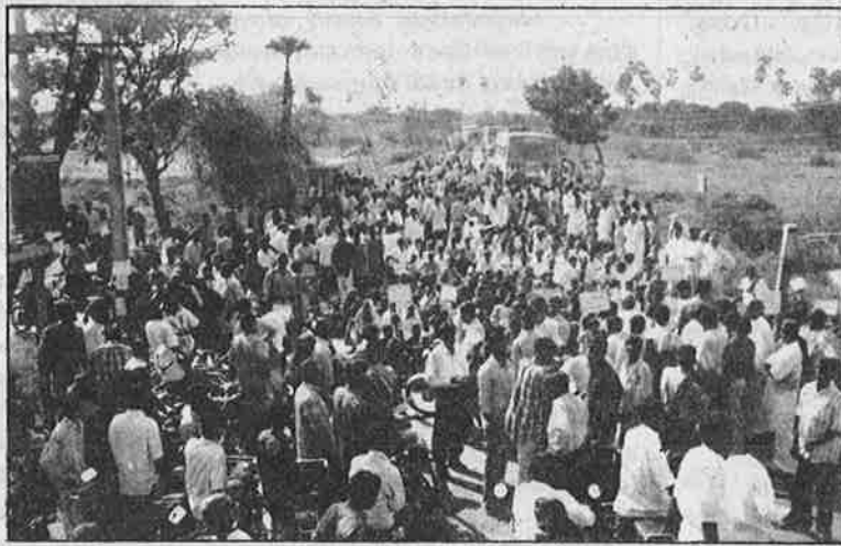
உரிய நிவாரணம் வழங்கக் கோரி சாலை மறியலில் ஈடுபட்ட புதுவை மாநிலத்தைச் சேர்ந்த கீழ்வாஞ்சூர் விவசாயிகள்.

வேதாரண்யம் நகரிலிருந்து தண்ணீர் லாரி வருமா என எதிர்பார்த்துக் காத்துக் கிடக்கிறார்கள். இப்படிப்பட்ட நிலையில் நிலத்திற்குத் தண்ணீர் பாய்ச்சுவதைப் பற்றி அவர்களால் நினைத்துக் கூடப் பார்க்க முடியாது.