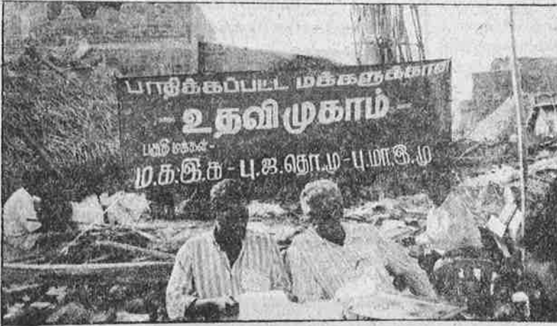
சென்னை - பட்டினப்பாக்கம் (மேலே) மற்றும் கடலூரில் அமைக்கப்பட்ட நிவாரண முகாம்கள்.

சீர்காழி பகுதியைச் சேர்ந்த தோழர்கள் திருமுல்லைவாயில் கிராமத்தில் இறந்த உடல்களை மீட்டு அடக்கம் செய்தனர்.