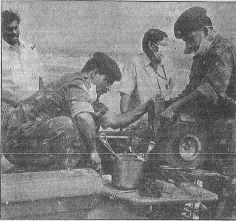
தேவனாம்பட்டினக் கிராமத்தில் படகு இன்ஜின்களைப் பழுது பார்ப்பதாக இந்திய இராணுவம் நடத்திய நாடகம்.

5,000 கோடி ரூபாய் பெறுமான இந்தக் கோமாளித் திட்டம் நிறைவேறினால், ஓட்டுக் கட்சிகளைச் சேர்ந்த காண்டிராக்டர்களும், எல் அண்ட் டி போன்ற கட்டுமான நிறுவனங்களும்