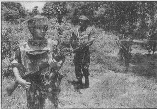
திரிபுரா மாநிலத்தலைநகர் அகர்தலாவில் தேடுதல் வேட்டை நடத்தும் இந்திய இராணுவம்.

இல்லை என்பதைத்தான் இந்த அமைதிப் பேச்சுவார்த்தைகள் எடுத்துக் காட்டுகின்றன. இப்படிப்பட்ட நிலையில் இராணுவச் செலவு, முந்தைய ஆண்டைவிட ஊதிப் பெருக்க வேண்டிய அவசியம் எதனால் வருகிறது என்பதுதான் கேள்வி.