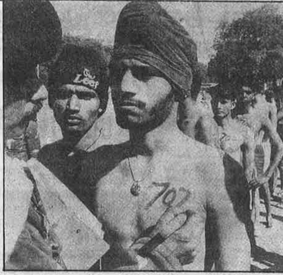
பட்ஜெட் பற்றாக்குறையைக் காட்டி அரசு வேலைகளுக்கு ஆளெடுப்பதற்குப் போடப்பட்டுள்ள தடை, இராணுவத்துக்கும், போலீசுக்கும் பொருந்தாது: பஞ்சாப் பாட்டியாலாவில் நடந்த இராணுவ ஆளெடுப்புத் தேர்வு.

● 22,327 ச.கி.மீ பரப்பளவும், 24 இலட்சம் மக்கள் தொகையும் கொண்ட மணிப்பூரில், அசாம் துப்பாக்கி படையைச் சேர்ந்த 13 பட்டாலியன்கள்; மத்திய ரிசர்வ் போலீசு படையைச் சேர்ந்த 8 பட்டாலியன்கள்; மணிப்பூர் துப்பாக்கி படையைச் சேர்ந்த 10 பட்டாலியன்கள்; இந்திய ரிசர்வ் படையைச் சேர்ந்த 4 பட்டாலியன்கள்; இந்த துணை இராணுவப் படைகளோடு இந்திய இராணுவத்தைச் சேர்ந்த 2 பிரிகேடுகள் நிறுத்தப்பட்டுள்ளன.