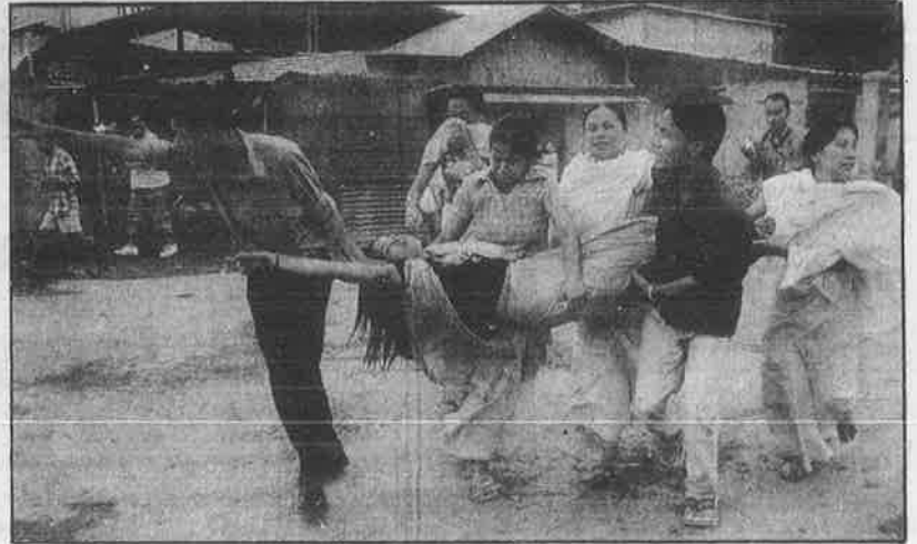
ஆயுதப்படை சிறப்பு அதிகாரர் சட்டத்தை நீக்கக் கோரி பள்ளி மாணவர்கள், தங்கள் பாட புத்தகங்களை எரிக்கிறார்கள் (மேலே). ஜூலை 23 அன்று இம்பாலில் நடந்த ஆர்ப்பாட்டத்தின் பொழுது, போலீசின் கண்ணீர் புகைக் குண்டு தாக்குதலில் காயமடைந்த பெண்.