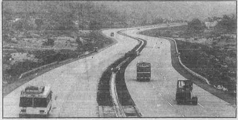
நவீன சொகுசுக் கார்கள் வழக்கிச் செல்வதற்காகவே உருவாக்கப்பட்டுள்ள மும்பய் - புனா அதிவிரைவுச் சாலை.

ஆறேழு ஆண்டுகளுக்கு முன்பு, தில்லி நகரின் சுற்றுப்புறச் சூழலைப் பாதுகாப்பது என்ற பெயரில், அந்நகரில் பெட்ரோல் / டீசலில் ஓடும் ஆட்டோக்கள், பேருந்துகளை, இயற்கை எரிவாயுவின் கீழ் ஓடுவதாக மாற்ற வேண்டும் என அதிரடியாக நீதிமன்றம் உத்திரவிட்டது. இந்தத்தீர்ப்பு தில்லி நகரின் சுற்றுப்புறச் சூழலைத் தூய்மையானதாக மாற்ற உதவியதைவிட, பேருந்து மற்றும் ஆட்டோ தயாரிக்கும் நிறுவனங்களின் (டாடா, பஜாஜ், அசோக் லேலண்டு) விற்பனை உயர்வதற்குத்தான் நன்றாக உதவியது. மேலும், தில்லி போன்றே எல்லா பெரு நகரங்களிலும் உத்திரவிட வேண்டும் என கார் தயாரிப்பாளர்கள் சுற்றுப்புறச் சூழலைக் காட்டித் தங்களின் விற்பனையை உயர்த்திக் கொள்ளத் திட்டம்