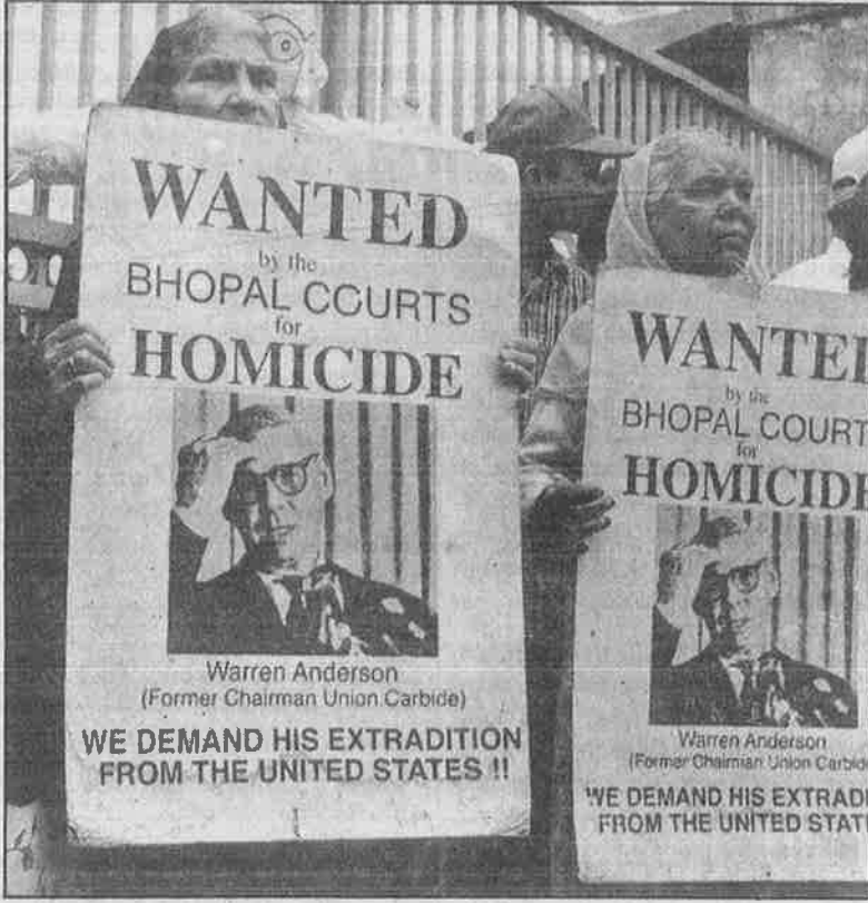
யூனியன் கார்பைடு நிறுவனத்தின் தலைவராக இருந்த வாரன் ஆண்டர்சனைக் கைது செய்யக் கோரி போபால் நகரில் நடந்த ஆர்ப்பாட்டம்.

அறிக்கை கொடுத்தது. 'நச்சுக் கழிவுகளை அகற்றப் போவதாக அறிவித்த ம.பி. மாநில அரசு இதற்காக ஆசிய வளர்ச்சி வங்கியிடம் கடன் வாங்கவும், கடனையும், வட்டியையும் மக்கள் வரிப்பணத்திலிருந்து செலுத்தவும் முடிவு செய்தது. இந்த அயோக்கியத்தனமான முடிவை எதிர்த்து போபால் மக்களும் சுற்றுச் சூழல் - மனித உரிமை அமைப்புகளும் போராட்டத்தில் குதித்தனர். 'நச்சுக் கழிவுகளை யூனியன் கார்பைடும் டோவ் கெமிக்ஸ் நிறுவனமும் தான் அகற்றுவதற்குப் பொறுப்பு பேற்க வேண்டும்; அரசு இதற்கு உத்தரவிட்டு செயல்படுத்த வேண்டும்; கொலைகார அமெரிக்க நிறுவனங்களால் ஏற்பட்ட பேரழிவுகளுக்கு மக்களிடமிருந்து வழிப்பறி செய்வது இயற்கை நீதிக் கே எதிரானது; அமெரிக்க நிறுவனங்களிடமிருந்து நச்சுக் கழிவுகளை அகற்ற நிதியை வாங்கு!' என்ற கோரிக்கையுடன் போராடினர்.