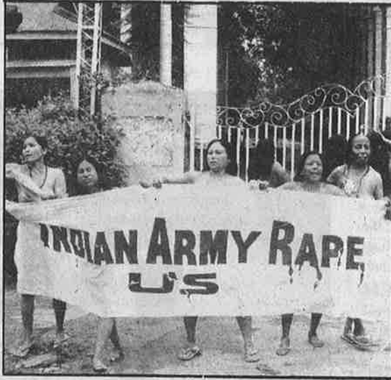
"இந்திய இராணுவமே எங்களையும் பாலியல் பலாத்காரப்படுத்து" என அசாம் துப்பாக்கிப் படை தலைமை முகாம் முன்னிர்வாணமாக ஆர்ப்பாட்டம் நடத்தும் மணிப்பூரி பெண்கள்.