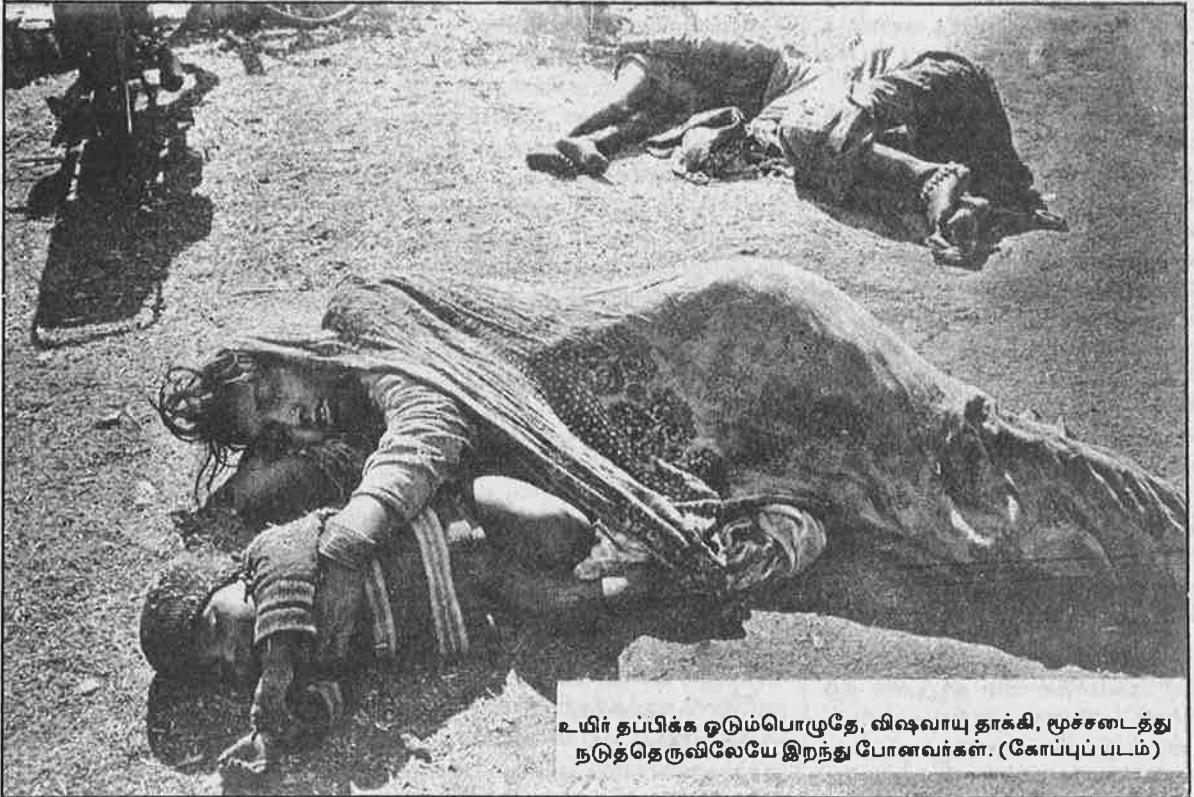
உயிர் தப்பிக்க ஓடும்பொழுதே, விஷவாயு தாக்கி, மூச்சடைத்து நடுத்தெருவிலேயே இறந்து போனவர்கள். (கோப்புப்படம்)

2001-இல் ஒரு கனடா நாட்டு நிறுவனம் யூனியன் கார்பைடு ஆலையில் குவிந்துள்ள நச்சுக் கழிவுகளை அகற்றி தூய்மைப்படுத்த ஏறத்தாழ ரூ. 200 கோடி செலவாகும் என்று மதிப்பீட்டு