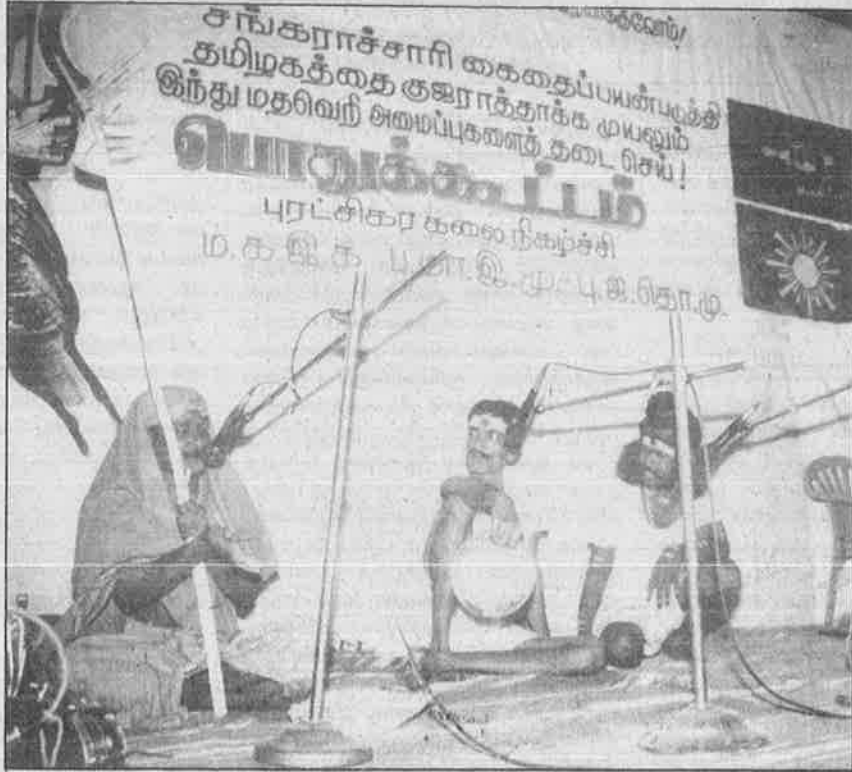
தமிழக மக்களின் பெரும் பாராட்டைப் பெற்று வரும் "சிறைக்குள் ஜெயேந்திரன் - பிரேமானந்தா சந்திப்பு" நாடகத்தின் ஒரு காட்சி.

ரவாதிகளின் கூடாரமே 'சங்கரமடம்' என்ற தலைப்பில் வாழிற்கூட்டம் நடைபெற்றது. சூத்திரர்களை வேசி மக்கள் என்றும் தாய்மொழியும் தமிழை நீச பாஷை என்றும் பார்ப்பன சும்பல் இழிவுபடுத்துவதையும், தீண்டாமை ஷேமகரமானது; வேலைக்குப் போகும் பெண்கள் நடத்தை கெட்டவர்கள் என்று மட சங்கராச்சாரிகள் திமிராகக் கொக்கரிப்பதையும் எதிர்த்தும், சங்கரமட கல்வி நிறுவனங்களில் பிற சாதியினருக்கு "தனிப் பந்தி"யைப் பின்பற்றுவதை அம்பலப்படுத்தும் முன்னணியாளர்கள் உரையாற்றினர்.