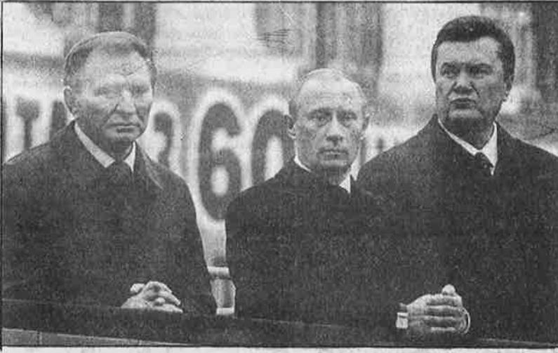
அதிபர் தேர்தலில் ஆளுங்கட்சி சார்பில் போட்டியிட்ட விக்கர் யானுகோவிச்சிற்கு (வலது) ஆதரவு தெரிவிக்கும் ரசிய அதிபர் விளாதிமிர் புடின் (நடுவில்).

“புதிய அமெரிக்க நூற்றாண்டுக்கான திட்டம்” என்ற அமெரிக்காவின் மேலாதிக்கத் திட்டத்தை ஆதரிக்கும் “ஹெரி டேஜ் பவுண்டேஷன்” என்ற அமெரிக்க அமைப்பு, “உக்ரைனை நமது பக்கம் வென்றுவிட்டால், முன்னாள் சோவியத் ஒன்றிய நாடுகள் அனைத்திலும் அரண்மனை புரட்சியினை நடத்தி விடலாம்” என்ற மேலாதிக்கக் கனவில் மிதக்கிறது.