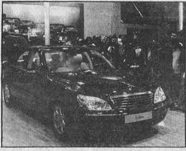
கார் கண்காட்சியில் நவீன சொகுசு காரைப் பார்த்து பரவசமடையும் பத்தர்கள் கூட்டம்.

பட்டெட்டி பற்றாக்குறையைக் காட்டி, அரிசிக்கும், கோதுமைக்கும், மண்ணெண்ணெய்க்கும், சமையல் எரிவாயுவுக்கும் தரும் 'மானியத்தை'ப் படிப்படியாக வெட்டி வரும் ஆளும் பல், கார் நிறுவன முதலாளிகளுக்கு வரி குறைப்பு என்ற