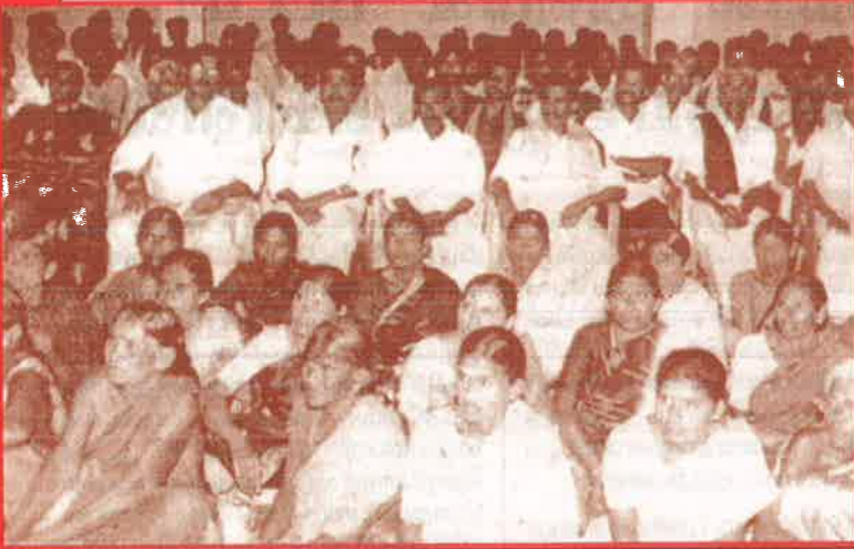
அதிரடிப் படையினர் மீது நடவடிக்கை எடுக்கக் கோரி சென்னையில் நடத்தப்பட்ட கருத்தரங்கில் கலந்து கொண்ட பாதிக்கப்பட்ட மலைவாழ் மக்கள்.