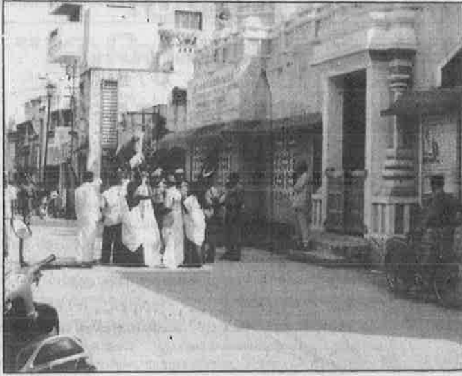
விழுப்புரத்தில் உள்ள சங்கர மடக் கிளையின் முன்பு (இறந்து போன சங்கராச்சாரி பிறந்து வளர்ந்த வீடு) கொடும்பாவி எரிக்க முயன்றபோது வி.வி.மு. தோழர்கள் கைது செய்யப்படுகிறார்கள்.

இக்கொடும்பாவி எரிப்புப் போராட்டத்தை ஆயிரக்கணக்கான உழைக்கும் மக்கள் கூடி நின்று உற்சாகத்துடன் வரவேற்றனர். நெல்லிக்காய் வியாபாரி ஒருவர் கட்டுக்கடங்காத உற்சாகத்துடன், உங்களுக்கு நன்கொடை கொடுக்க இப்போது என்னிடம் காசில்லை என்று கை நிறைய நெல்லிக்காயை அள்ளி தோழர்களுக்குக் கொடுத்து நெஞ்சார வாழ்த்தினார். இதுதவிர இன்னும் சில வியாபாரிகளும், ஒரு போலீசகாரரும் சிலவோ கணக்கில் சாக்கெட் மிட்டாய்களை வாங்கி அனைவருக்கும் அள்ளிக் கொடுத்து பெருமகிழ்ச்சியுடன் வரவேற்றனர்.