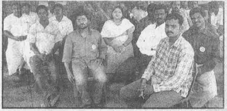
கமிசன் தொகையைக் கொடுக்காமல் ஏப்பம் விட்ட ரிலையன்சை எதிர்த்து, ரிலையன்ஸ் மொபைல் போன் டீலர்கள் நடத்திய உண்ணாவிரதம்.

இதற்கிடையில், செல்லுலர் உரிமம் பெற்ற நிறுவனங்கள் தமது "நெட் வொர்க்" கில் ரிலையன்ஸின் அமைப்புகளை அனுமதிக்க மறுத்தன. அரசாங்க ஆதரவோடு கொள்ளையடித்து வந்த ரிலையன்ஸ் நிறுவனம், இப்போது