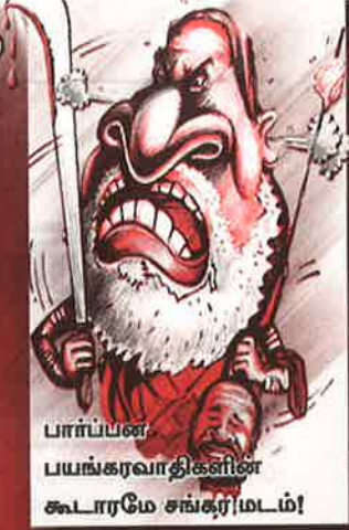
பாப்பன் பயங்கரவாதிகளின் கூடாரமே சங்கரமடம்!