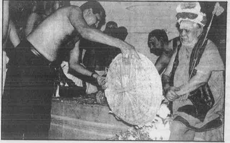
ஜெயேந்திரனுக்கு மலர்களால் பாதபூஜை செய்யும் கூலிப்படை தலைவன் அப்பு: ரவுடியிசத்தை அரவணைத்துக் கொள்ளும் பார்ப்பன ஆன்மீகம்.

இந்து சமயப் பணி என்ற பெயரில் அரசியல் புரோகிதர் வேலை செய்யும் காஞ்சி மடத்தின் ‘சமயத் தொண்டு’ பற்றி இண்டியன் எக்ஸ்பிரஸில் மாய்ந்து மாய்ந்து துதி பாடும் அம்பிகளுக்கு இதெல்லாம் தெரியாதா என்ன? இருந்தாலும் தங்கள் சாதி பிராண்டைத் தூக்கிப் பிடிப்பதில் அப்படியொரு பத்திரிகா தர்மம். “சங்கரமடத்திலிருந்து ஒரு துண்டுச் சீட்டு வந்தால் உடனே டிரான்ஸ்பர், உடனே புரமோஷன், உடனே லைசன்ஸ்...” என்று ‘பெரிவாளுடைய’ செல்வாக்கை வியந்து போற்றுகிறார்களே, அது ஆன்மீகப் பணி