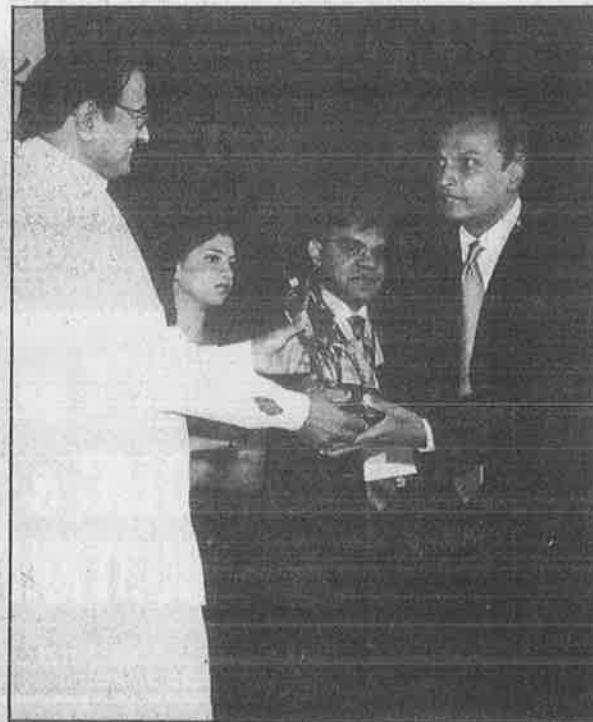
பல வியாபார மோசடிகளை நடத்தியுள்ள ரிலையன்ஸிற்கு, "மிகவும் மதிப்பிற்குரிய நிறுவனம்" என்ற பரிசுக் கோப்பையை அதன் துணைத் தலைவர் அனில் அம்பானியிடம் கொடுக்கிறார், ப.சிதம்பரம்.

உறுதி செய்யவே செல்லுலர் சேவைக்கென்று "ஜிஎஸ்எம்" (GSM) என்ற தனித்தொழில்நுட்பத்தை வரையறுத்து அதிலேயே உரிமமும் கொடுக்கப்பட்டது. இவையெல்லாம் ஒழுங்காக நடைபெறுவதைக் கண்காணிக்க ஒழுங்குமுறை ஆணையம் (TRAI); இவற்றில் பிரச்சினை வந்தால், முறைகேடுகளை விசாரிக்கை தொலை தொடர்பு மேல்முறையீட்டு தீர்ப்பாயம் (TDSAT), பொதுத் துறை பங்குகளை விற்பதற்கென்றே தனி அமைச்சகம் என்று ஏராளமான அமைப்புகள் மக்கள் வரிப்பணத்தில் அமைக்கப்பட்டன.