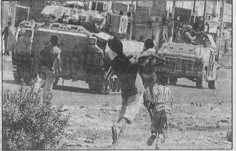
அமெரிக்க டாங்குகள் மீது கல்லைக் கொண்டு தாக்கும் ஈராகிய சிறுவர்கள்: இந்த வீரம் தோற்றுப் போகுமோ?

ஈராக் மீது அமெரிக்கா விதித்த பொருளாதாரத் தடை, பத்தே ஆண்டுகளில் ஐந்து இலட்சத்துக்கும் அதிகமான குழந்தைகளின் உயிரைக் குடித்தது. இது பற்றி பி.பி.சி. நிருபர்கள் கேட்டதற்கு, கிளிண்டனின் ஆட்சியில் அரசுச்செயலராக இருந்த மெட்லைன் ஆல்பிரைட், "அது கொடுக்கத்தக்க விலைதான்"