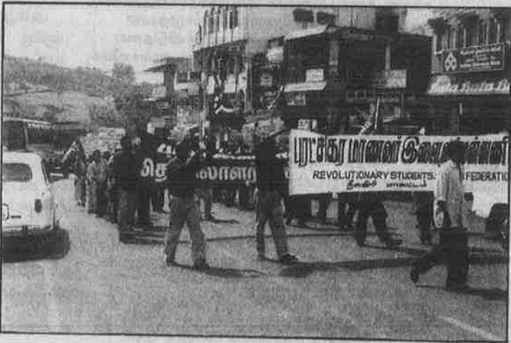
கோத்தகிரியில் போலீசு தடையை மீறி புரட்சிகர அமைப்புகள் நடத்திய மே நாள் பேரணி.

இப்பொதுக்கூட்டமும் அதைத் தொடர்ந்து ம.க.இ.க. நடத்திய "பாசிசப்பேயோட்டல்" கலை நிகழ்ச்சியும் விவசாயிகளிடம் பெருந்த வரவேற்பைப் பெற்றது.