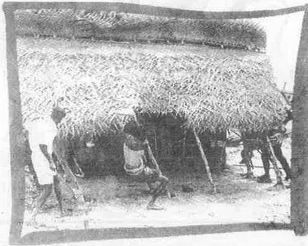
மக்களின் பேரெழுச்சி: பிய்த்தெறியப்படும் இறால் பண்ணை கொட்டகைகள்.