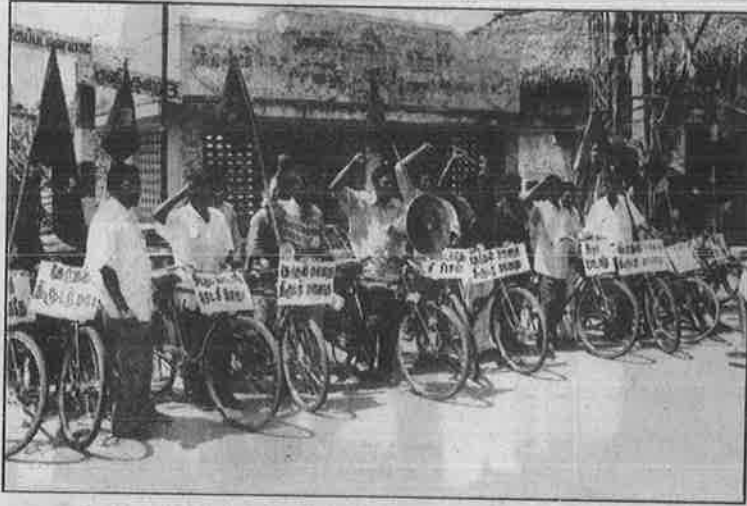
திருவாரூர் அம்மையப்பனிலிருந்து திருத்துறைப்பூண்டி வரை பு.மா.இ.மு. தோழர்கள் நடத்திய தேர்தல் புறக்கணிப்பு சைக்கிள் பிரச்சார ஊர்வலம்.

மக்கள், இந்த அரசியல் பிரச்சார இயக்கத்துக்குப் பெரிதும் ஆதரவளித்தனர். கோவை மாநகரில் குரும்பர் வீதி - இடையர் வீதி சந்திப்பில் மே 9-ஆம் நாளன்று தேர்தலைப் புறக்கணிக்கக் கோரி துண்டுப் பிரசாரம் விநியோகித்து பிரச்சாரம் செய்த 4 தோழர்கள் போலீசாரால் கைது செய்யப்பட்டு, தேர்தல் முடிந்த பின்னர் பிணையில் விடுவிக்கப்பட்டனர்.