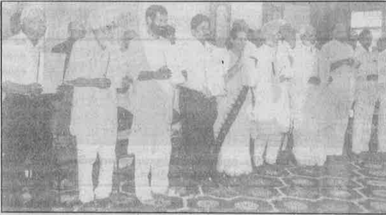
குறைந்தபட்ச செயல் திட்டத்தை வெளியிடும் ஐக்கிய முன்னேற்றக் கூட்டணித் தலைவர்கள்.

ஆனால் காங்கிரசு, மேற்கு ஏகாதிபத்திய ஏகபோகங்களுக்கும் இந்தியத் தரகு அதிகாரவர்க்க முதலாளிகளுக்கும், நிலப்பிரபுக்களுக்கும் சேவை செய்வதற்கென்றே உருவாக்கப்பட்ட பார்ப்பன - பனியா ஆளும் வர்க்கக் கட்சி. பின்னர் ருசிய சமூக ஏகாதிபத்தியத்தையும் சேர்த்துக் கொண்டு சோசலிச முற்போக்கு நாடகமாடியது. சமூக ஏகாதிபத்தியத்தின் வீழ்ச்சியைத் தொடர்ந்து, ஏகாதிபத்திய உலகமயமாக்கம் - தாராளமயமாக்கம் - தனியார்மயமாக்கம் என்கிற புதிய பொருளாதாரக் கொள்கையைப் புகுத்தியக் கட்சி. இடையில் ஆட்சியதிகாரத்தை இழந்துவிட்டிருந்ததால் தன் நிறத்தை மாற்றிக் கொண்டு முற்போக்கான கட்சியாக மாறிவிட்டது என்று நம்புவதற்கு இடமே கிடையாது. இருந்த போதும் பா.ஜ.க. - ஆர்.எஸ்.எஸ். மதவெறி பாசிச கும்பலைக் காட்டி வலதுசாரி எதிர்ப்பு என்கிற போர்வையில் மீண்டும் காங்கிரசுக்கு சேவகம் செய்வதற்குத் துடிக்கிறார்கள், போலி கம்யூனிஸ்டுகள்.