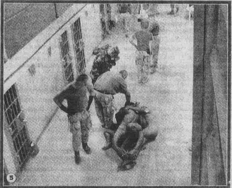
ஈராக்கிய கைதிகளை நிர்வாணமாக்கி, ஒருவர் மேல் ஒருவர் பிரமிடு போல படுக்க வைக்கும் வக்கிர சித்திரவதை.

● ஈராக் கைதிகளின் முகங்களில் சீறுநீரைப் பெய்து அவமானப்படுத்தியிருக்கிறார்கள், பிரிட்டிஷ் இராணுவ