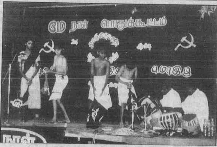
சென்னை - மே நாள் பொதுக்கூட்டத்தில் இளந்தோழர்களின் புரட்சிகர கலைநிகழ்ச்சி.

'போலி ஜனநாயகத் தேர்தலைப் புறக்கணிப்போம்! மக்கள் சர்வாதிக்காரமன்றங்களைக் கட்டியமைப்போம்!' என்ற முழக்கத்துடன் தஞ்சை நகரிலும் கற்றுப்புற சிறுநகரங்களிலும் ம.க.இ.க., பு.மா.இ.மு. ஆகிய அமைப்புகள் தெருமுனைக் கூட்டங்கள் நடத்தின. மே நாளன்று