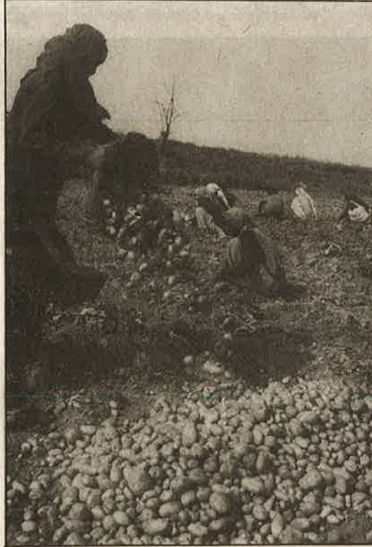
உத்திரப்பிரதேச மாநிலத்தில் உருளைக்கிழங்கிற்கு உரிய விலை கிடைக்காததால் நிலத்திலேயே கொட்டி அழிக்கப்படுகிறது; ஒருபுறம் அபார விளைச்சல்; இன்னொருபுறம் பட்டினி இந்தியா - "இந்தியா ஒளிர்கிறது!"

தனியார்மயம் - தாராளமயம் - உலகமயம் என்ற இந்தப் பொருளாதார ஒழுங்கமைப்பின் கீழ் சாலையில் பயணம் செய்யும் உரிமை முதல் இயற்கையான குடிநீர் நிலைகள் கூட தனியார்மயமாக்கப்படும். எல்லாவற்றுக்கும் கட்ட