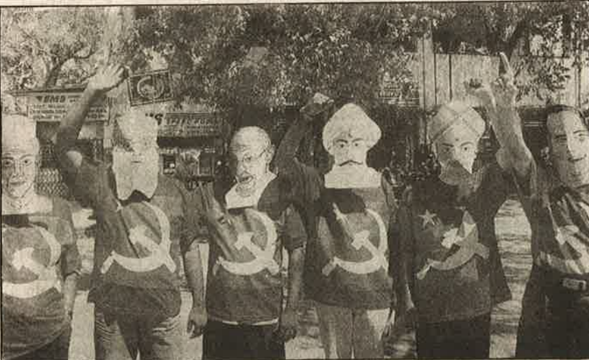
காந்தி, நேரு, பாரதி, ராஜீவ்காந்தி ஆகிய கம்யூனிச விரோதிகளை கம்யூனிச ஆதரவாளர்களாக சித்தரித்து மதுரை ‘மார்க்சிஸ்ட்’ கட்சியினரின் நூதன தேர்தல் பிரச்சாரம்: காந்திய சோசலிசம்.