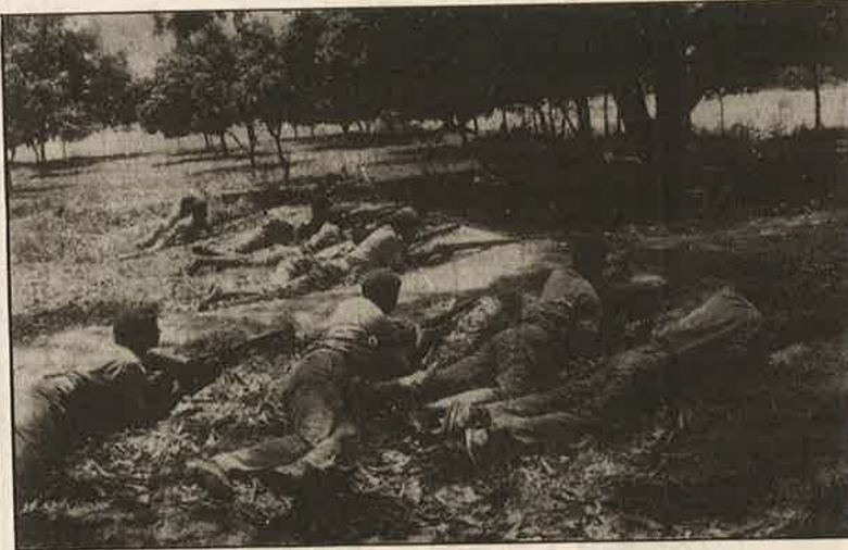
இந்திய துணை இராணுவம்: அந்நியப் படையெடுப்புக்கு எதிராக அல்ல. வாக்குச் சாவடியை கைப்பற்றும் முயற்சிக்கு எதிராக. பீகார் மாநிலம் சாப்ரா தொகுதியில் முசேப்பூர் கிராமத்தில்.

அதற்கு மாறாக, ஒரு ஆக்கப்பூர்வமான, திட்டமிட்ட மாற்று அரசியல் அமைப்பையும், அதை அடைவதற்கான வழிமுறையையும் வைத்துக் கொண்டு தான் தேர்தல்களைப் புறக்கணிக்கும்படி அறைகூவி அழைக்கிறார்கள், புரட்சியாளர்கள். அனைத்துத் தரப்புச் செய்திகளையும் விருப்பு வெறுப்பின்றி மக்கள் முன் வைப்பதுதான் தமது புனிதமான கடமை என்று செய்தி ஊடகம் கூறிக் கொள்கிறது. அதற்காகப் பல தனிச்சிறப்பான சலுகைகளையும், உரிமைகளையும் கூட அனுபவித்து வருகிறது. ஆனால் அது, கம்யூனிச புரட்சியாளர்