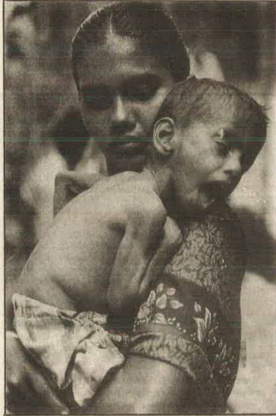
சத்தான உணவு கிடைக்காமல் மரணத்தோடு போராடும் விஜயவாடா நகரைச் சேர்ந்த குழந்தை: "ஹை-டெக்" முதல்வர் சந்திரபாபு நாயுடு ஆட்சியின் இலட்சணம்.

சுதந்திர சந்தைப் பொருளாதாரம், தடையற்ற, தொய்வற்ற சந்தைவிரிவாகக் கத்துக்கான ஏகாதிபத்தியப் போட்டிக்கும் போருக்கும் தான் வழிவகுக்கும் என்பதை இரண்டு உலகப் போர்களிலும் கண்டோம். இன்றும் ஆப்கான், ஈராக் என்று பலநாடுகளின் மீது ஆக்கிரமிப்பு அழிவுப்போர்களுக்கு அது காரணமாக இருப்பதைக் காண்கிறோம்.