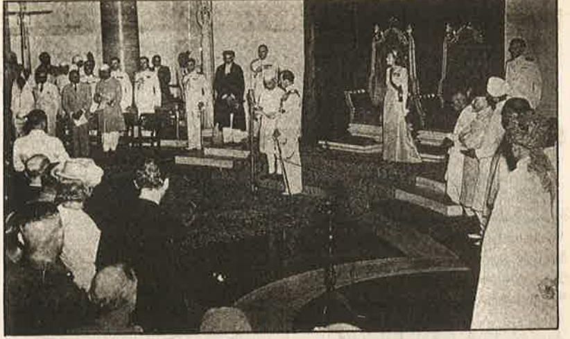
ஆகஸ்டு 15, 1947 அன்று இந்தியாவின் பிரதமராகப் பதவியேற்கும் நேர: போலி சுதந்திரம்.

சுதந்திரம் வழங்குவது என்ற பெயரில், தங்களது அடிவருடிகளிடம் அரசியல் அதிகாரத்தை மாற்றிக் கொடுத்து விட்டு பின்வாங்கிக் கொள்வது; தங்களது மூலதனம் தொழிற்சாலைகள், சொத்துக்களுக்கு எவ்விதக் குந்தகமும் ஏற்படாத வகையில் சட்டபூர்வ பாதுகாப்பைப் பெற்றுக் கொள்வது; இதன் மூலம் முன்னாள் காலனிய நாடுகளை அரைக்காலனிய நாடாகவோ (பல ஏகாதிபத்தியங்களின் மறைமுக வேட்டைக்காடு), நவீன காலனி நாடாகவோ (ஓரேயொரு ஏகாதிபத்தியத்தின் மறைமுக வேட்டைக்காடு) மாற்றித் தங்களது அரசியல் பொருளாதார, இராணுவ ஆதிக்கத்தை மறைமுக வடிவில் தக்கவைத்துக் கொண்டனர். இந்த அரைக்காலனிய, நவ காலனிய சுரண்டலை தக்கவைக்கவும், விரிவுபடுத்தவும் உலக வங்கி, சர்வதேச நாணய நிதியம் என்ற இரு நிறுவனங்களை அமெரிக்கா தலைமையில் அமைந்த ஏகாதிபத்திய முகாம் உருவாக்கியது.