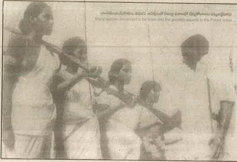
1948 தெலுங்கானாப் பேரெழுச்சியின்போது அமைக்கப்பட்ட பெண்கள் கொளில்லாப்படை.

ஆனால், மக்கள் மீது, மக்களுக்கு எதிரான சர்வாதிகாரம் செலுத்தும் இந்த சட்டதிட்டங்கள் எவையும் மக்களின் ஒப்புதலோடு, மக்கள் பிரதிநிதிகளால் உருவாக்கப்பட்டவை அல்ல. மேலிருந்து, மக்களின் சம்மதமின்றியே திணிக்கப்பட்டவை. அனைத்து மக்களுக்கும் வாக்குரிமை வழங்கப்படாமல் சொத்துடைமையுள்ள வாக்காளர்களால் தேர்தெடுக்கப்பட்ட இடைக்கால அரசின் உறுப்பினர்களாக இருந்தவர்களும், சமஸ்தான அரசர்களாலும் ஆங்கிலேய காலைய ஆட்சியாளர்களாலும் நியமிக்கப்பட்டவர்களும் உறுப்பினர்களாக இருந்த அரசியல் நிர்ணய சபையால் எழுதி நிறைவேற்றப்பட்டது தற்போதைய அரசியல் நிர்ணயச் சட்டம்.