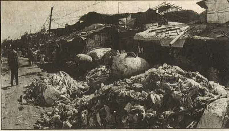
தில்லியில் உள்ள ஒரு தொழிலாளர் குடியிருப்பு: ஒளிரும் இந்தியாவில் அடுக்குமாடிக் கட்டிடத் தொழில் கொழிக்கிறது. தொழிலாளர்களின் குடியிருப்பு சுகாதார வசதி ஏதுமின்றி குப்பைத் தொட்டியாகிறது.

டிக்கைகள் என்று போலி கம்யூனிஸ்டுகள் ஆதரித்தனர். அமெரிக்க ஏகாதிபத்திய அடிவருடியும் பார்ப்பன அரசியல் குருவுமான இராஜாஜி தலைமையிலான சுதந்திரா கட்சியும் ஆர்.எஸ்.எஸ். -இன் பா.ஜ.க.வின் முன்னோடி ஜனசங்கம் கட்டியும் எதிர்த்து வந்தன.