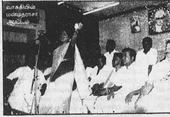
மன்மதராசா ஆட்டம்; ஆபாச பிரச்சாரம்.

"குடிநீர் பிரச்சினைக்காக, "எதிரணி"யைச் சேர்ந்த கருணாநிதி இப்போது திடீர் கரிசனையோடு குடம் குடமாகக் கண்ணீர் வடிக்கிறார். "மக்