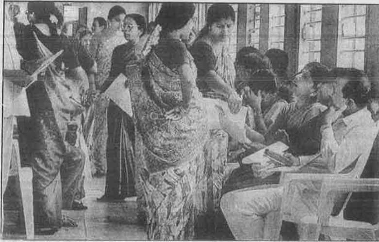
சட்டவாதப் போராட்டத்தின் தோல்வி: மன்னிப்புக் கடிதம் எழுதிக் கொடுத்து மீண்டும் பணியில் சேரக் காத்துக் கிடக்கும் தமிழக அரசு ஊழியர்கள்.

நாடாளுமன்றத் தேர்தலில் போட்டியிடும் எந்தவொரு ஒட்டுக்கட்சியாவது, தாராளமயம் - தனியார்மயத்திற்கு மாற்றாக, வேறு பொருளாதாரக் கொள்கைகளை முன்வைத்து வாக்கு கேட்கிறதா? ஒட்டுக் கட்சிகள் ஆட்சியைப் பிடித்த பிறகு, மக்களுக்குக் கொடுத்த வாக்குறுதியின்படி தான்கள் என்பதற்கு உத்