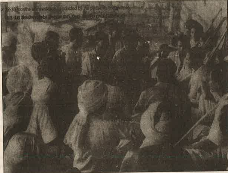
1948 தெலுங்கானாப் பேரெழுச்சியின்போது 12-18 மாதங்களாக புரட்சிகர அரசு நிர்வாகத்தை நிறுவியிருந்த விவசாயிகள் கமிட்டி: மக்கள் சர்வாதிகார மன்றம்.

மக்கள் சர்வாதிகார மன்றம் மற்றும் மக்கள் போர்ப்படை ஆகிய அமைப்புகளைப் புரட்சிகர எழுச்சியினூடாக நிறுவுவது, அதன் மூலம் மக்கள் அதிகாரத்தைக் கைப்பற்றுவது முற்றிலும் புதிய முயற்சி அல்ல. பல்வேறு சந்தர்ப்பங்களிலும், பல்வேறு நாடுகளிலும் இப்படிப்பட்ட முயற்சிகள் நடந்து வெற்றியும் பெற்றுள்ளன. பிரெஞ்சு சர்வாதிகார மன்னனுக்கு எதிராக 1871-லும், ரஷ்யாவின் கொடுங்கோலன் ஜாருக்கு எதிராக, 1905 மற்றும் 1917-ஆம் ஆண்டுகளிலும், சீனாவில் - கோமிங்டாங் பாசிச சர்வாதிகாரத்திற்கு எதிராக 1927-லும் நமது நாட்டிலேயே ஆங்கிலேய காலனி ஆட்சிக்கு எதிராக 1942 - இல் ஷோலாப்பூரிலும் ஐதராபாத் நிஜாமின் பிரபுத்துவ ஆட்சிக்கு எதிராக தெலுங்கானாவிலும் 1947-48-லும் இன்னும் உலகின்