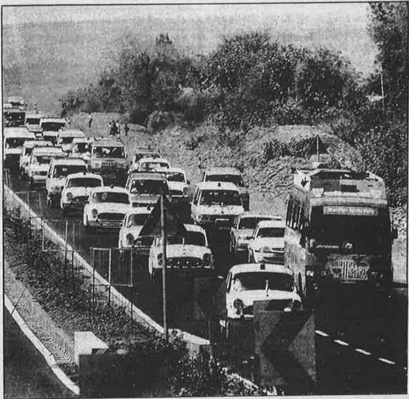
ஓட்டு வேட்டையாட போலீசு பாதுகாப்போடு பவனி வரும் அத்வானியின் ரத யாத்திரை: இந்த நன்னடைத்தை விதி மீறலை தேர்தல் ஆணையம் கண்டுகொள்ளவில்லை.