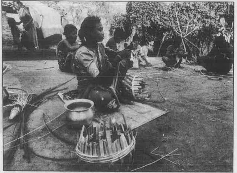
வல்லரசாகப் போகும் இந்தியாவில், மூங்கில் கூடைகளைப் பின்னி விற்றுக் காலந்தள்ளும் சபர் பழங்குடியின மக்கள்.

1960-களின் முதல் பாதியிலேயே இந்திரா அரசு உலகவங்கி மற்றும் ஐ.எம்.எஃப். கடன்கோரிப் பிச்சையெடுத்தது. 5000 கோடி டாலர் கடன்பெற்ற இந்திய அரசு ஏகாதிபத்திய நிபந்தனைகள் - கட்டளைகளை ஏற்று நாட்டை மறு காலனியாக்கும் - மறு அடகுவைக்கும் கட்டளைகளை ஏற்க வேண்டியதாகியது. அதன்பிறகு "காட்" (GATT) ஒப்பந்தத்துக்கான பேச்சு வார்த்தைகள் தொடங்கின. நாடாளுமன்ற - சட்டமன்ற ஒப்புதலின்றியே இரகசியமான முறையில் இந்திய அரசு "காட்" ஒப்பந்தத்தில் கையெழுத்திட்டது. தனியார்