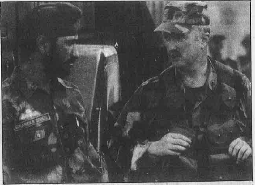
ஆக்ராவில் நடந்த அமெரிக்க-இந்தியப் படைகளின் கூட்டுப் பயிற்சியில் இந்திய மற்றும் அமெரிக்க சிப்பாய்கள்: இது உறவின் நெருக்கமா? அமெரிக்க இராணுவ ஆதிக்கமா?

தனியார்மயம் - தாராளமயத்தை எதிர்த்துப் போராடும் தொழிலாளர்கள் மீது "எஸ்மா"வும், "டெஸ்மா"வும் பாய்கின்றன. "தீவிரவாதத்தை ஒழிக்க வந்த" பொடா, மறுகாலனி ஆதிக்கத்தை எதிர்க்கும் நக்சல்பாரிகள் மீது பாய்கிறது. கருப்புச் சட்டங்களைப் போட்டு அரசு பாசிசமயமாகி வருவதையும், நாடு மறுகாலனியாவதையும் பிரித்துப் பார்க்க முடியாது. மறுகாலனி ஆதிக்கத்தையும், பாசிசத்தையும் எதிர்த்துச் சட்ட