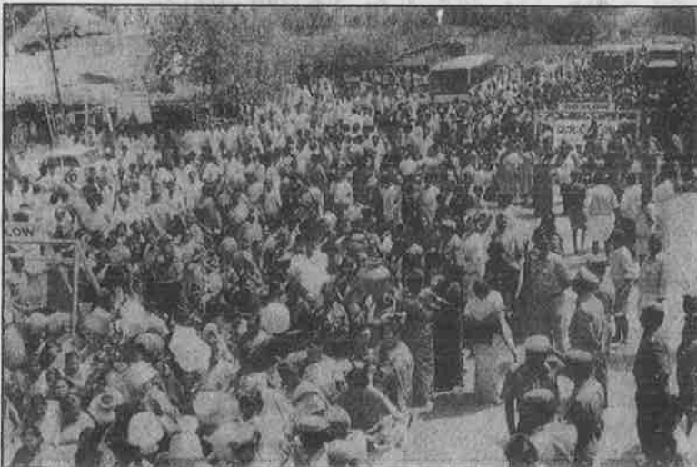
மதுரை - திண்டுக்கல் ரோட்டில் சின்னாளம் பட்டி மக்கள் குடிநீர் கோரி நடத்திய சாலை மறியல்.

(எனும் ஆளுங்கட்சிகளுக்குப் பாடம் புகட்ட ஆத்திரத்துடன் காத்திருக்கிறார்கள்.