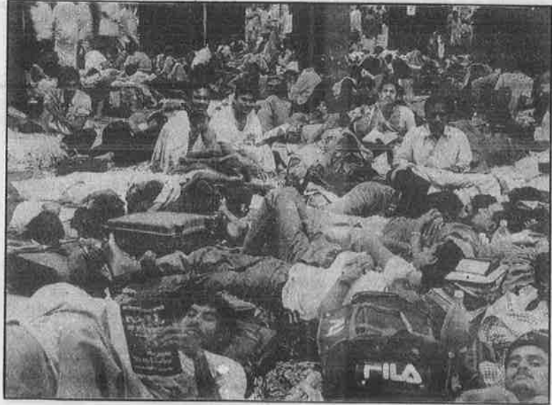
"இந்தியா ஒளிக்கிறது" என்ற பா.ஜ.க. கூட்டணி அரசின் கோயபல்சு பாணி பிரச்சார விளம்பரங்கள் (மேலே); (கீழே) இந்தியத் தொடர்வண்டித்துறை நடத்திய வேலைக்கான தேர்வுகளை எழுத, வட மாநிலங்களில் இருந்து சென்னைக்கு வந்து குவிந்த வேலை தேடும் இளைஞர்கள்: எதிரும் புதிருமான இந்தியா.

னையைக் கிளப்புவதற்கு நேரு அரசு துணைபோனது; மூடப்பட்டிருந்த பாபரி மசூதியில் இந்துமத வெறியர்கள் பூசை நடத்த பேரன் ராஜீவ் கதவு திறந்துவிட்டார். இடிப்பதற்கு நேரு பரம்பரையின் விசுவாசி நரசிம்ம ராவ் துணைபோனார். இந்து மதவெறியர்களுக்கு இணக்கமாக இருந்து காங்கிரசு ஆளும் மாநில அரசுகள் துணைபோகின்றன. மொத்தத்தில் மிதவாத இந்து மதவாதமே மதச்சார்பற்ற கூட்டணிக் கட்சிகளின் அணுகுமுறையாக உள்ளது என்பது பலமுறை நிரூபிக்கப்பட்டிருக்கிறது.