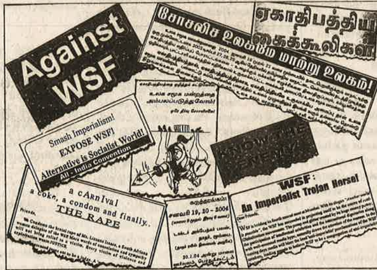
உ.ச.ம.வை அம்பலப்படுத்தி ம.க.இ.க. - பு.ஐ.தொ.மு. இணைந்து வெளியிட்ட பல்வேறு துண்டுப் பிரசுரங்கள், வெளியீடுகள்.

மானால், உள்நாட்டில் ஏகாதிபத்திய நிறுவனங்களை ஒழித்துக் கட்ட வேண்டும்." சரிதான், ஆனால் யார் ஒழித்துக் கட்டுவது? உ.ச.ம. கஞ்சாப் போதையில் ஆடிக் களித்த இந்த அரும்போராளிகளைக் கொண்டா? இன்னொரு இடத்திலிருந்தும் அழைப்புவருகிறது. "மும்பை எதிர்ப்பியக்கம் - 2004" அறைகூவி அழைக்கிறது, "போர்க்குணமிக்க போராட்டங்களில் உ.ச.ம.வுடன் இணைந்து போராடுவோம்!" ஆணுறை விநியோகமும், ஆபாச ஆட்டங்களும், ஆரவாரக் கேளிக்கைகளும், பலவண்ண அரசியல் கோட்பாடுகளும் போர்க்குணமிக்க போராட்டங்களில் ஈடுபட்டால், அது ஏகாதிபத்திய எதிர்ப்பாக இருக்காது. மாறாக, சோசலிச எதிர்ப்பாகவே இருக்கும். எதிரி சக்திகளின் தலைமைக்குக் கட்டுப்பட்டு இயங்கும் எதிர்ப்புரட்சி சக்திகளை தோழமை சக்திகளாக வென்றெடுக்க முயற்சித்தால், விளைவு நேர் எதிராகத்தான் இருக்கும்.