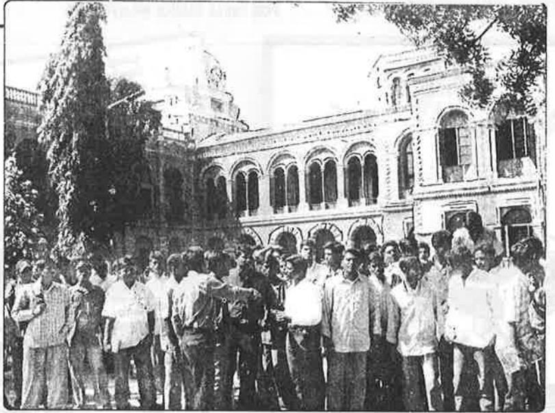
தேர்வு கட்டணங்கள் மற்றும் கல்வி கட்டணங்கள் உயர்த்தியதை கண்டித்து சென்னை மாநிலக்கல்லூரி மாணவர்கள் இன்று காலை கல்லூரி வளாகத்திற்குள் ஆர்ப்பாட்டம் நடத்திய போது எடுத்தபடம்.

சென்னைப் பல்கலைக் கழகத் துடன் இணைக்கப்பட்டுள்ள அரசு மற்றும் அரசு உதவி பெறும் கல்லூரி மாணவர்களுக்கான தேர்வுக் கட்டணத்தை பாசிச ஜெயா அரசு திடீரென பல மடங்கு உயர்த்தியுள்ளது. மாணவர்கள் தேர்வுக்கு விண்ணப்பிக்கும் நேரத்தில் இதை அறிவித்து, கட்டணத்தைச் செலுத்தியே தீர வேண்டும் என்ற நிர்நந்தத்தையும் உருவாக்கியது. சென்னையில், புரட்சிகர மாணவர் -இளைஞர் முன்னணியின் சார்பில், "தேர்வுக் கட்டணத்தை உயர்த்தாதே! ஏழைமாணவர்கள் கல்வி பெறும் உரிமையைப் பறிக்காதே! உத்தரவிடுகிறது உலக வங்கி; உயருகிறது தேர்வுக் கட்டணம்! மயிரைப் புடுங்கவா மந்திரிகள்? மாணவர்களே, பெற்றோர் - ஆசிரியர் - உழைக்கும் மக்களுடன் இணைந்து வீதியில் இறங்கிப் போராடுவோம்! உலக வங்கி கைக்கூலி பாசிச ஜெயாவின் ஆணவத்திற்கு முடிவு கட்டுவோம்!" என்ற முழக்கங்கள் அடங்கிய சுவரொட்டிகள் கல்லூரிகள் மற்றும் விடுதிகளில் ஒட்டப்பட்டன.