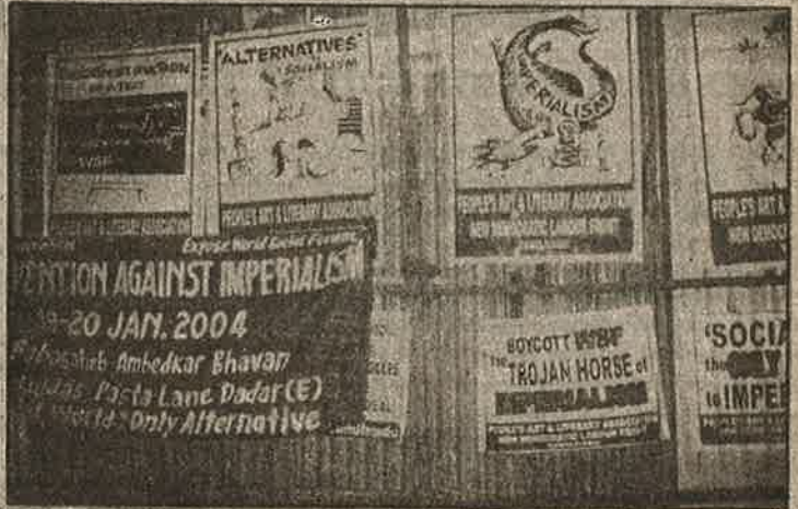
உலக சமூக மன்றத்தைக் கூர்மையாக அம்பலப்படுத்திய ம.க.இ.க. - பு.ஐ.தொ.மு.வின் கேலிச் சித்திர சுவரொட்டிகள்.

இதேபோல், பல நாடுகளிலிருந்து மார்க்சிய - லெனினிய இயக்கங்களையும் கட்சிகளையும் வரவழைத்து, நமது அமைப்புகள் அவர்களிடம் அறிமுகமாக மிகவும் உதவிய மும்பை எதிர்ப்பியக்கம் 2004-இன் முதன்மை இயக்குநர்களுக்கும் நாம் நன்றிக்கடன் பட்டுள்ளோம்! மினி உ.ச.ம.-வை போல நடந்த மு.எ. 2004-இன் நிகழ்ச்சிகளையும், உ.ச.ம.-விற்கு எதிரான நமது ஆற்றல் வாய்ந்த எதிர்ப்புப் பிரச்சாரத்தையும் வந்திருந்த உள்நாட்டு, வெளிநாட்டு புரட்சிகர மா-லெ இயக்கங்களின் பிரதிநிதிகளும் அணிகளும் ஒப்பிட்டுப் பார்த்திருப்பார்கள்! குட்டி உ.ச.ம.-வான "மக்கள் போராட்டங்களுக்கான சர்வதேச கழக"த்தின் (ILPS-ன்) தீய செல்வாக்கிற்குப் பலியாகி விட்டோமா என்று மறுபரிசீலனை செய்யுமாறு அவர்களைத் தூண்டியிருக்கும் என்று நம்புகிறோம்!