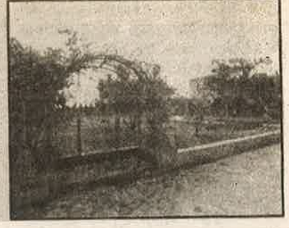
“தலித் சகோதரி” மாயாவதி வாங்கிக் குவித்துள்ள சொத்துக்களில் ஒரு துளி.

பெறுமான போலி முத்திரைத் தாள் ஊழலில் ஆந்திரர், கர்நாடகா, மகாராஷ்டிரா மாநிலங்களைச் சேர்ந்த உயர் அதிகாரிகள், அமைச்சர்கள், ஓட்டுக் கட்சித் தலைவர்களுக்குத் தொடர்பி ருப்பதும்; இந்த ஊழல் காரணமாக மகாராஷ்டிராவின் உள்துறை அமைச்சராக இருந்த சஜ்ஜன் புஜ்பால் வேறொரு நொண்டிச் சாக்கை கூறி, பதவி விலகியதும் கடந்த இரண்டு, மூன்று மாதங்களுக்குள்ளான நடந்தன.