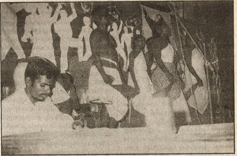
கருத்தரங்கில் மிகுந்த வரவேற்பைப் பெற்ற ஆந்திராவின் அருணோதயா (மேலே), தமிழகத்தின் ம.க.இ.க. மையக் கலைக்குழுவினரின் (கீழே) கலைநிகழ்ச்சிகள்.

உலகில் தீவிரமடைந்து வரும் முரண் பாடுகள், அதற்கு எதிராகப் புரட்சி கரப் போராட்டங்களை வளர்த்து எடுத்துச் செல்வதற்கான வாய்ப்பு களை வழங்கியுள்ளன" என்ற நம்பிக் கையை மக்கள் முன் ஆணித்தரமாக வைத்தது.