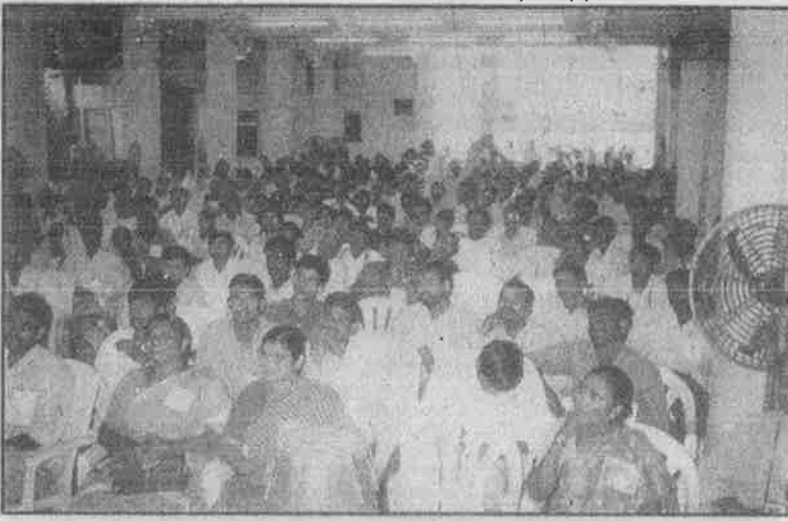
பல்வேறு மாநிலங்களில் இருந்து வந்து கருத்தரங்கில் கலந்து கொண்ட ஏகாதிபத்திய எதிர்ப்புப் போராளிகள்.

சிக்கிக் கொண்டுள்ள மும்பய் எதிர்ப்பு இயக்கமும் - ஏகாதிபத்தியம் விரித்து வைத்துள்ள பொறிக்குள் மாட்டிக் கொண்டிருப்பதை அம்பலப்படுத்தியது.