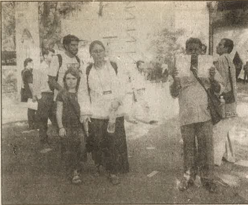
உ.ச.ம. மாநாட்டிற்குள் நுழைந்து "கலகம்": உ.ச.ம.வை அம்பலப்படுத்தும் வெளியீடுகளைக் கையிலேந்தி பிரச்சாரம் செய்யும் பு.ஜ.தொ.மு. - ம.க.இ.க. அணியினைச் சேர்ந்த தோழர்.

இந்த அரசியல் தலையீட்டின் வடிவம் மேலும் உரம் பெறத் துவங்கியது, சுவரொட்டிகளாக, இணையப் பதிவுகளாக, உ.ச.ம.வாயிலேயே நடந்த எதிர்ப்பு ஆர்ப்பாட்டமாக! (பார்க்க: பெட்டிச் செய்தி - உ.ச.ம. எதிர்ப்பு ஆர்ப்பாட்டம்) வெளியீட்டின் வாயிலான அரசியல் தலையீட்டினால் சினம் கொண்டலைந்த