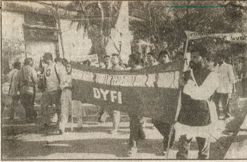
உ.ச.ம. மாநாட்டில் கலந்து கொள்ள வருகிறது 'மார்க்சிஸ்டு' கட்சியின் இந்திய ஜனநாயக வாலிபர் சங்கம்: ஏகாதிபத்தியத்தின் "சிவப்பு செக்யூரிட்டிகள்".

ஆயிரக்கணக்கானோர் அமருவதற்கு வசதிகள் செய்யப்பட்டிருந்தும், பெருவாரியான இருக்கைகள் காலியாக இருந்தது, கருத்தரங்குக்ளுக்கான அமோக ஆதரவைப் பறைசாற்றியது. சில கருத்தரங்குகள் குறிப்பான சில