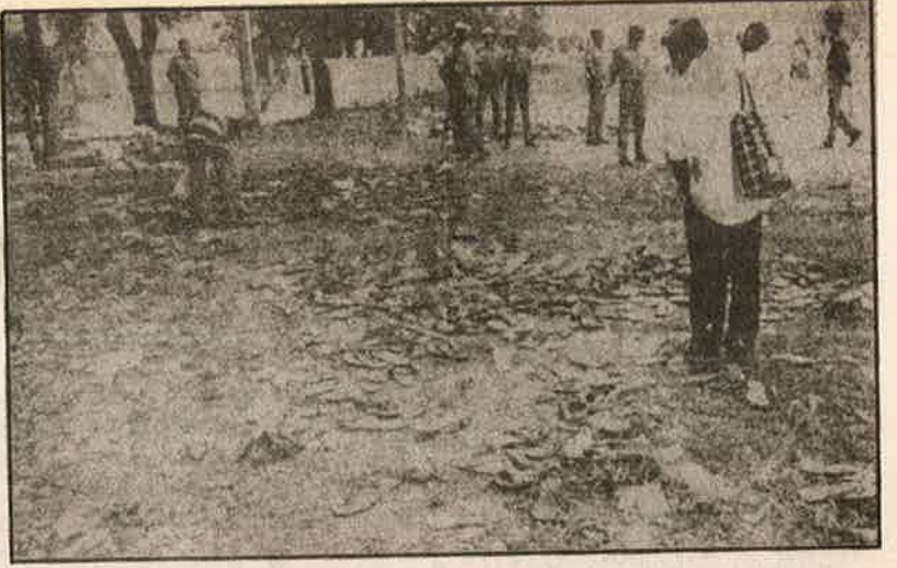
சிதறுண்டு கிடக்கும் காலணிகள் - போலீசு தடியடியின் கோரம்: வேலை தேடி வந்த இளைஞர்களுக்கு பாசிச ஜெயா அரசு தந்த வெகுமதி.

வேலைவாய்ப்புகள் உருவாக்குவதாக, தினமும் பல வண்ண விளம்பரங்களை வெளியிடுகிறது, பி.ஜே.பி அரசு. இது எப்படி என்று கணக்கு சொல்கிறது, பார்ப்பன பயங்கரவாதிகளின் ஊதுகுழலான ‘இந்தியா டுடே’ பத்திரிக்கை.