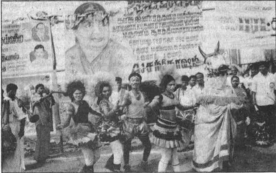
இலவசத் திருமணத்திற்காக அமைக்கப்பட்ட ஆடம்பர முகப்பு (மேலே); (கீழே) ஆபாசக் கூத்து; ஊதாரித்தனத்தால் காலியாகிறது கஜானா.