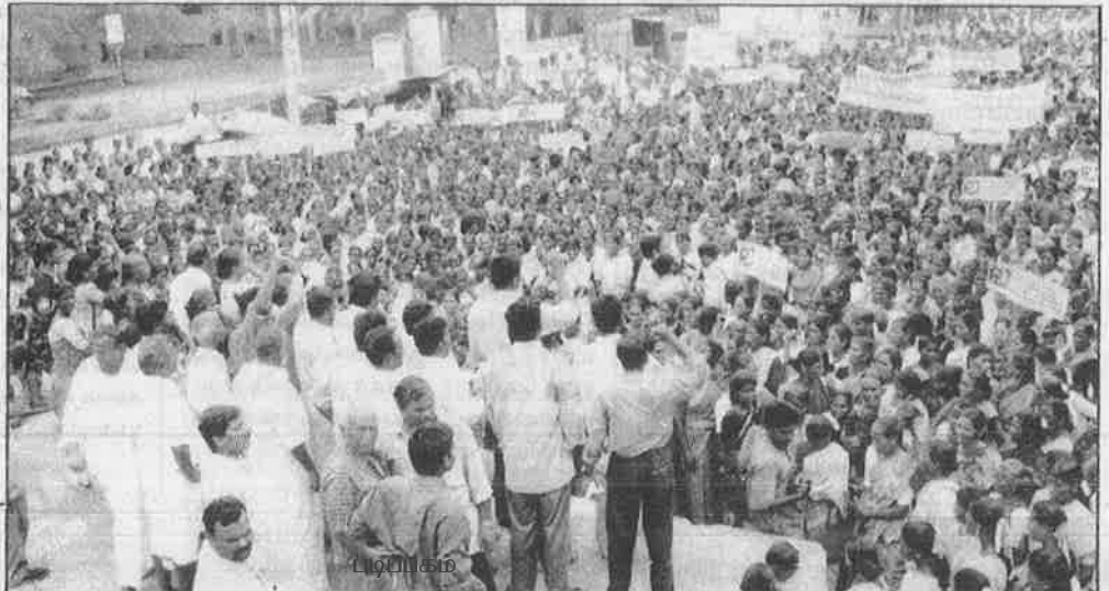
சிவகங்கையில் கோகோ - கோலா குளிர்மான நிறுவனத்துக்கு எதிராக போராடும் மக்கள்.

இன்று வைகை நதியின் நிலத்தடி நீரைச் சூறையாடும் கோகோ - கோலா ஏற்கனவே நாட்டின் பல பகுதிகளிலும் தன் சூறையாடலை அத்துமீறி நடத்தியுள்ளது. கேரள மாநிலம் பாலக்காடு மாவட்டம் சிற்றூர் வட்டத்திலுள்ள பிளாச்சிமடாவில் சென்ற ஆண்டு கோக் நிறுவனம் உற்பத்தி ஆலையைத் தொடங்கியது. நாளொன்றுக்கு 15 லட்சம் லிட்டர் தண்ணீரை சிற்றூர் புழா ஆற்றின் நிலத்தடி நீரிலிருந்து கபளீகரம் செய்து வந்தது. இதனாலும் ஆலையிலிருந்து வெளியேறிய கழிவுகளாலும் அப்பகுதிகளில் கிணற்று