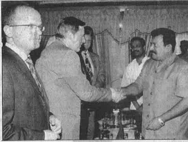
டோக்கியோ மாநாட்டில் விடுதலைப் புலிகளைக் கலந்து கொள்ளச் செய்வதற்காக, புலிகள் தலைவர் பிரபாகரனைச் சந்தித்துப் பேச்சு வார்த்தை நடத்திய நார்வே நாட்டுக் குழுவினர்.

இலங்கையில் நடந்து வந்த உள்நாட்டுப் போரை நிறுத்தி, சமாதானத் தீர்வு காணும்படி அமெரிக்கா உட்பட பல நாடுகள்தாம் நிர்ப்பந்தம் கொடுத்து வந்தன. அதை ஏற்றுப் போர் நிறுத்தமும், புரிந்துணர்வு ஒப்பந்தமும் போட்டு, பேச்சு வார்த்தைகளும் நடந்து வந்த நிலையில், அமெரிக்கா, இந்தியா முதலிய நாடுகள் புலிகள் மீதான தடையை நீக்கிவிடுவது இயல்பாக நடக்கும் என்று புலிகள் இயக்கம் நம்பியது. இதைச் சோதித்தறியும் வகையில் பேச்சு வார்த்தை நடத்துவதற்கு இடமளிக்கும்படியும், புலிகளின் ஆலோசகர் பாலசிங்கம் சிகிச்சை பெற அனுமதிக்கும்படியும் இந்தியாவிடம் புலிகள் கோரினர். ஆனால், இதற்கெல்லாம் மறுப்புத் தெரிவித்ததன் மூலம் அமைதிப் பேச்சு வார்த்தைக்கு இந்தியா