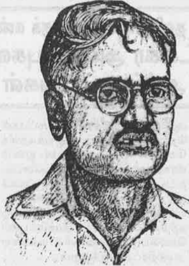
தமிழகத்தில் ஆர்.எஸ்.எஸ். அமைப்பை நிறுவவதற்காக அனுப்பப்பட்ட மராத்திய சித்பவன் பார்ப்பனர் தாதாரால் பரமாத்.

ஆனால், ஆர்.எஸ்.எஸ். காரர்களுக்கு உண்மை நன்றாகவே தெரியும். பெரியார் தலைமையிலான பகுத்தறிவு