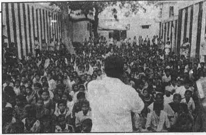
பிஞ்சுக் குழந்தைகளின் நெஞ்சில் நஞ்சை விதைக்கும் இந்துமதவெறிப் பிரச்சாரம்.

வதற்கு நுட்பமாகத் திட்டமிட்டார்கள். அவர்களுக்கிடையே பொருளாதார அடிப்படையிலும் அரசாங்க வேலைகளைக் கைப்பற்றுவதற்கான பந்தயத்திலும் ஆரோக்கியமற்ற போட்டியையும் மோதலையும் உருவாக்கினார்கள். அரசை நடத்துவதில் பிராமணர்களைப் பயன்படுத்திக் கொண்டார்கள்; அவர்களை வெறுக்கும்படி மற்றவர்களைத் தூண்டிவிட்டார்கள். ஆங்கிலேயர்களின் மறைமுக ஆதரவுடன் நீதிக்கட்சி என்கிற பெயரில் பிராமணரல்லாதோரின் கட்சி நிறுவப்பட்டது; அது பிராமணர்களுக்கும், அதன் மூலம் இந்து மரபுகள் - பாரம்பரியங்களுக்கும் எதிரான ஆழமான வெறுப்பைப் பரப்பியது.