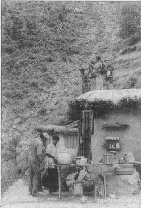
காசுமீரில் மக்களைச் சோதனையிடும் போலீசு: ‘பயங்கரவாதி’களைத் தேடி அலையும் பயங்கரவாதிகள்.

ஓட்டு வங்கிகளாகவே பார்க்கின்றன ஓட்டுக் கட்சிகள். ஒவ்வொரு முறையும் தேர்தல் வரும்போது இவர்களுக்குப் பல வாக்குறுதிகளை அளித்து ஓட்டுகளுக்கு குறிவைக்கின்றன.