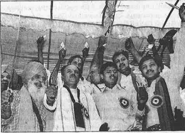
டெல்லியில் பாசிச பயங்கரவாதி தொகாடியாவின் பகிரங்க ஆயுத விநியோகம்.

செய்தி வெளியாகியுள்ள போதிலும், அரசாங்கமோ, போலீசோ, நீதித்துறையோ எந்த நடவடிக்கையும் எடுக்கவில்லை.