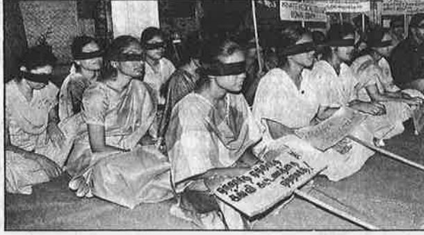
கண்ணைக் கட்டிக் கொண்டு தனியார்மயத்தை எதிர்க்கும் மதுரை மருத்துவக் கல்லூரி மாணவர்கள்: இது, போராட்டமா? கோமாளித்தனமா?

தேர்வு எழுத முடியாதபடி தடை செய்யப்பட்டனர். இறுதியாண்டை முடித்து வெளியேறும் மாணவர்களின் நன்னடத்தைச் சான்றிதழில் "போராட்டத்தில் கலந்து கொண்டதாகக் கரும் புள்ளி வைக்கப்படும்; இதனால் அவர்கள் மருத்துவ ராகப் பதிவு செய்ய முடியாது" என மிரட்டல் விடப்பட்டது!