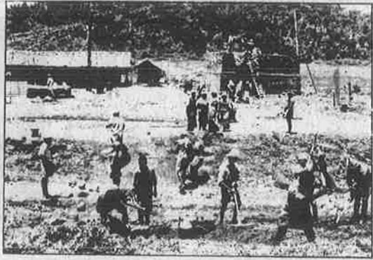
இடுக்கி அணைக்கட்டில் புதுப்பிக்கப்படும் அய்யப்பன் கோவில். அரசின் மெத்தனம் - இந்துமதவெறியர்களுக்கு ஆதாயம்.

கோவில் கட்டுமானப் பணி தொடங்கிய பிறகு தாமதமாக விழித்துக் கொண்ட மின்வாரியம், கேரள தேவஸ்தான வாரியம் மீதும் வி.இ.ப. மீதும் உயர்நீதி மன்றத்தில் வழக்குத் தொடுத்து தடை விதிக்கக் கோரியுள்ளது. நீதிமன்றமோ தேவஸ்தான வாரியத்துக்கு நோட்டீசு அனுப்பி விளக்கம் கேட்டுக் கொண்டிருக்கிறது. மாநில அரசோ இது மத உணர்வு சம்பந்தப்பட்ட விவகாரம் என்று ஒதுக்கி கைகட்டி நிற்கிறது. இந்து வெறியர்களோ தமது நோக்கத்தைச் சாதித்துவிட்ட பூரிப்பில், அடுத்து எங்கே கோயில் கட்டலாம் என்று அலைந்து கொண்டிருக்கிறார்கள்.