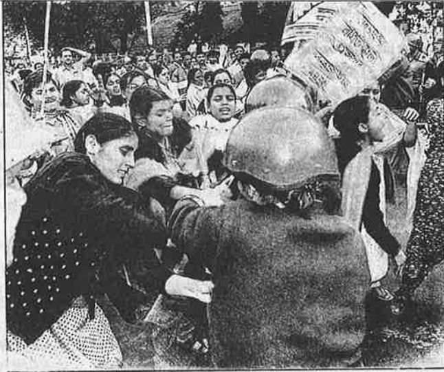
மின்சாரம் - பேருந்து கட்டண உயர்வுக்கு எதிராக கொல்கத்தாவில் நடந்த ஆர்ப்பாட்டத்தின் மீது 'மார்க்சிஸ்டு - போலீசு' நடத்திய தாக்குதல்; 'இடதுசாரி' ஆட்சியிலும் போலீசு - அடக்குமுறை கருவிதான்.

இந்திய தண்டனைச் சட்டப் பிரிவு 124A என்பது வெள்ளைக்காரன் காலத்திய காலனிய அடக்குமுறைச் சட்டத்தின் மறுபதிப்பாகும். வெள்ளைக்காரன், இந்திய மக்களை ஒடுக்க ஏவிய இக்கொடிய சட்டத்தைத்தான், இடதுசாரி அரசு மே.வங்க மக்கள் மீது கட்டவிழ்த்து விட்டுள்ளது. தடா, பொடா சட்டங்களை எதிர்ப்பதாகக் கூறும் இடதுசாரி ஆட்சியாளர்கள், வெள்ளைக்காரன் காலத்திய அடக்குமுறைச் சட்டத்தைக் கொண்டு மக்களை ஒடுக்கி வருகின்றனர்.