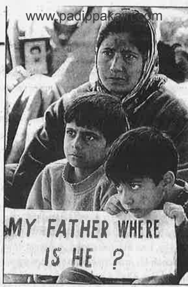
இராணுவத்தால் அழைத்துச் செல்லப்பட்டு, பின் ‘காணாமல் போன’ தனது கணவனுக்காக, குழந்தைகளோடு சேர்ந்து போராடும் காசுமீரத்துப் பெண்.

எல்லையோரம் ஏழு இலட்சம் படை வீரர்களை எட்டு மாதங்களாக குவித்து வைத்திருந்த பின்னும், இந்து மதவெறிக் கூட்டணி ஆட்சியால் பாக். மீது போர் தொடுக்க முடியவில்லை. எல்லை கட்டுப்பாட்டு கோட்டை 30,000 சிப்பாய்கள் சுற்றி சுற்றி வந்து