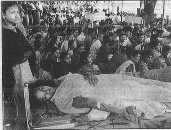
போராட்டத்தின் ஒரு பகுதியாக இரத்த தானம் செய்யும் மாணவி; பொதுமக்களின் ஆதரவைப் பெற இதுதானா வழி?

ஒருபுறம் தமிழக அரசு, இன்னொருபுறம் நீதிமன்றம், மற்றொரு தனியார் மயத்தின் ஆதரவாளர்கள் என்ற முக்கூட்டணி, மாணவர்களைச் சட்டத்தாலும், நாக்காலும் வறுத்தெடுத்துக் கொண்டிருந்த பொழுது, மாணவர்களின் போராட்டம் எப்படி நடந்தது? ஒருநாள் கண்ணில் கறுப்புத் துணிக் கட்டிக் கொண்டு, ஒருநாள் வாயில் பிளாஸ்திரி ஒட்டிக் கொண்டு, ஒருநாள் நெற்றியில் நாமம் போட்டுக் கொண்டு, ஒருநாள் கானாபாடல் பாடிகும்மி அடித்துக் கொண்டு, ஒருநாள் வெற்று மார்புடன் உட்கார்ந்து கொண்டு 'போராடினார்கள்'. மருத்துவ மாணவர்கள் வரம்பு மீறி நடத்திய ஒரே போராட்டம் சாலை மறியல்தான்.