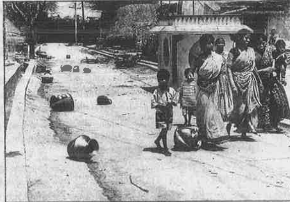
கூத்தரம்பாக்கம் மேல்சாதி வெறியாட்டம்.