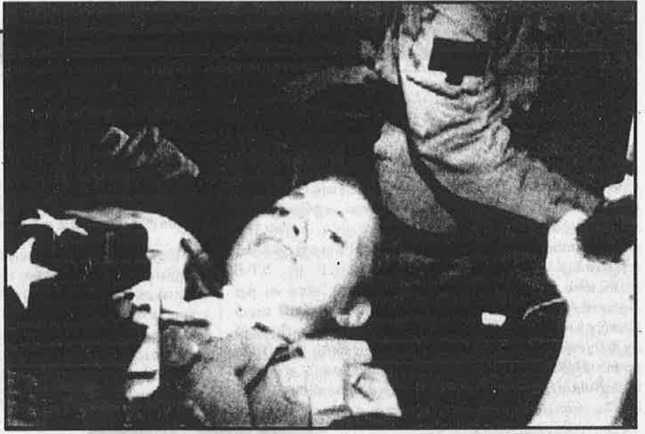
ஈராக்கியர்களின் மனிதாபிமானத்துக்கும், அமெரிக்க இராணுவத்தின் 'ஹாலிவுட்' சாகச மனப்பான்மைக்கும் இரத்த சாட்சியமான ஜெசிகா லின்சு.

அமெரிக்கா வெளியிட்டிருக்கும் செய்திகளும், மேற்கத்திய பத்திரிக்கையாளர்கள் கண்டறிந்தவைகளும் ஒன்றுக்கொன்று முரணானவையாகவே உள்ளன. இவற்றில் உண்மைகளைப் பேச வேண்டியவர் ஜெசிகா லின்ஸ்தான்.