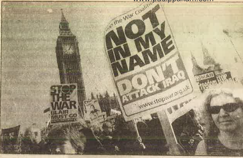
மேலாதிக்கப் போரை எதிர்த்து இங்கிலாந்து தலைநகர் இலண்டனில் நடந்த ஆர்ப்பாட்டம்.

டிகள் மேலும் மேலும் அமெரிக்க - இங்கிலாந்து விமான நிலையங்களில் வந்திறங்கும்போது அத்தகைய போராட்டங்கள் அடக்க முடியாத அளவு பெரும் எண்ணிக்கையில் அமெரிக்கா - இங்கிலாந்தில் வெடிக்கும்.