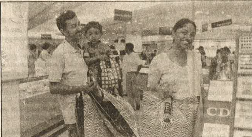
நுகர் பொருள் கலாச்சாரத்தில் மூழ்கித் திளைக்கும் மேட்டுக்குடியினருக்கு பட்ஜெட் பல சலுகைகளை வாரி இறைத்திருக்கிறது.

அரசிடமிருந்து வரிச் சலுகைகளைப் பெறும் முதலாளிகள் புதிய வேலை வாய்ப்புகளை உருவாக்குவது கிடக்கட்டும். அவர்கள் வரிச்சலுகைகளுக்கு ஏற்ப பொருட்களின் விலையைக் கூட்டு குறைப்பதில்லை. இந்த ஆண்டு பட்ஜெட்டில் குளிர் பானங்கள் மீது விதிக்கப்படும் உற்பத்தி வரி 8 சதவீத குறைக்கப்பட்டுள்ளது. இதற்கேற்ப அவற்றின் விலையும் குறைய வேண்டும். ஆனால், இந்தியக் குளிர் பானச் சந்தையைத் தங்களின் பிடியில் வைத்திருக்கும் பெப்சியும், கோக்கும் குளிர் பானங்களின் விலையைக் குறைக்க முடியாது எனத் தடாலடியாக அறிவித்திருப்பதோடு, வரியை இன்னமும் குறைக்க வேண்டும் என்ற ஆலோசனையை முன் வைத்துள்ளன.