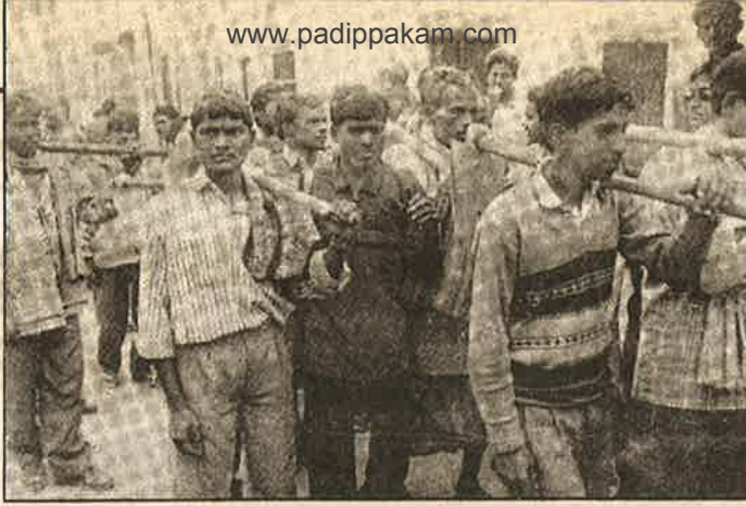
அயோத்தி பாபர் மசூதி வளாகத்தில் அகழ்வாராய்ச்சிப் பணிக்குச் செல்லும் தொழிலாளர்கள்: வரலாற்று உண்மையைக் கண்டுபிடிக்கும் முயற்சியா? சதியா?

அகழ்வாராய்ச்சி மூலம் உண்மையைக் கண்டறிந்தால் நல்லது தானே என்று சிலர் கருதலாம். ஆனால் இந்த வேலையில் ஈடுபட்டிருக்கும் தொல்லியல் துறையானது, ஆர்.எஸ்.எஸ்.இன் தீவிரத் தொண்டனும், பா.ஜ.க.வின் முன்னாள் தலைவரும், இன்னாள் மந்திரியும், பாபரி மசூதி இடிப்பில் பங்கேற்றவருமான முரளி மனோகர் ஜோஷி என்ற பார்ப்பன வெறியனிடம் உள்ளது. இவர் ஏற்கனவே தன்னிடம் உள்ள மனித வளமேம்பாட்டு அமைச்சகத்தை காவிய மாக்கி வைத்திருக்கிறார். அனைவருக்கும் தெரியவே பாடப் புத்தகங்களில், வரலாற்று ஆராய்ச்சிக் கவுன்