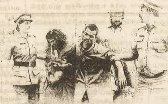
அடக்குமுறையால் துவண்டுபோன பழங்குடியினர் குடும்பத்தைக் கைது செய்யும் போலீசு.

வனப்பகுதியிலிருந்து பழங்குடியினர் விரட்டப்படுகிறார்கள்; கடற்கரையிலிருந்து மீனவர்கள் துரத்தப்படுகிறார்கள்; விளைநிலங்களிலிருந்து விவசாயிகள் பிய்த்தெறியப்படுகிறார்கள்; ஆலைகளிலிருந்து தொழிலாளர்கள் வீசியெறியப்படுகிறார்கள்; நெசவாளர்கள் கஞ்சித் தொட்டிக்குத் தள்ளப்படுகிறார்கள்; வேலையில்லை; கூலியில்லை; வாழும் உரிமையும் இல்லை. "இல்லை" என்று சொல்வதற்குக் கூட உரிமை