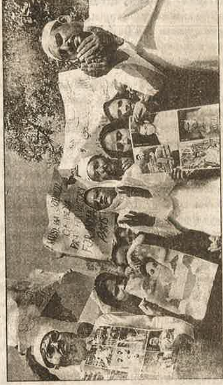
இந்திய அணி பாக். அணியை வெல்ல வேண்டும் என்பதற்காக மும்பையில் முசுலீம்கள் நடத்திய சிறப்புத் தொழுகை.

"கிரிக்கெட் போட்டிகளில் இந்திய அணி தோல்வியுறுவதையும், பாகிஸ்தான் அணி வெற்றி பெறுவதையும் இந்திய முசுலீம்கள் பட்டாசு வெடித்துக் கொண்டாடுகிறார்கள். அவர்களது தேசபக்தி யோக்கியதைக்கு இதுவே சான்று" என்பது இந்து மதவெறிக் கும்பலின் பிரமலமான அவதூறுகளில் ஒன்று. இதனால் இந்த கிரிக்கெட் போட்டி தங்கள் மீது தாக்குதல் நடத்துவதற்கு இன்னொரு வாய்ப்பாக அமைந்துவிடக்கூடாது எனப் பயந்து போயிருந்த முசுலீம்கள், இந்தப் போட்டியின் பொழுது தங்களின் இந்திய தேச பக்தியை நிரூபிக்கும் நிலைக்குத் தள்ளப்பட்டனர்.