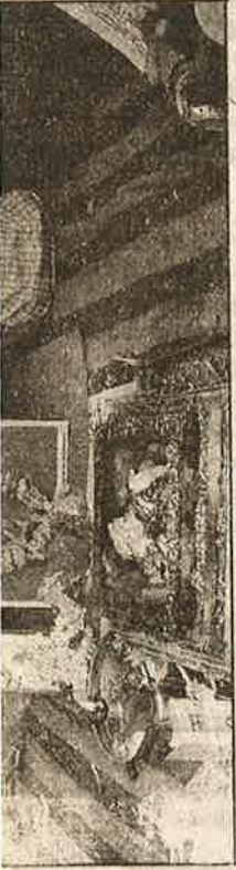
இந்திய அணிமின வெற்றிக்காக போபாலில் யாகம் நடத்தி விட்டு, இந்தியா - பாக். போட்டியைப் பார்க்கும் பஜ்ரவந்தன் அமைப்பைச் சேர்ந்த இந்து மதவெறியர்கள்.

குஜராத் தலைநகர் அகமதாபாத்தில் நடத்தப்பட்ட வெற்றி ஊர்வலத்தின் பொழுது, ஒரு சிறுவன் துப்பாக்கியால் சுட்டுக் கொல்லப்பட்டான்; கடைகளும், வாகனங்களும் தீவைத்துக் கொளுத்தப்பட்டன.