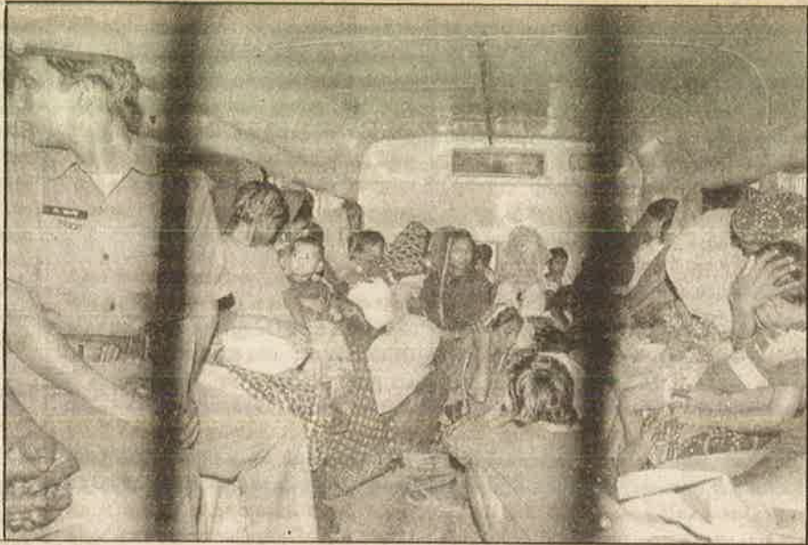
வங்கதேச முசலீம் பெண்கள் கைது செய்யப்பட்டு ஹைரா நீதிமன்றத்துக்கு அழைத்துச் செல்லப்படுகிறார்கள்: வேலை தேடி இந்தியாவிற்கு வந்தால் கிடைப்பதோ சிறைதண்டனை

நாடுகளில் சட்டவிரோதமாகக் குடியேறி வேலைபார்க்கும் ஏழை நாட்டுத் தொழிலாளர்களை "பொருளாதார அகதிகள்" என்று அழைக்க வேண்டும் எனக் கூறுகிறார்கள். ஏழை நாடான வங்க தேசத்தில் இருந்து இந்தியாவிற்குள் நுழையும் முசலீம்களையும் பொருளாதார அகதிகளாகத்தான் பார்க்க வேண்டும். ஆனால், பார்ப்பன பாகிஸ்தான்களோ அவர்களை "ஊடுருவல்காரர்கள்" என அவமானப்படுத்துவதோடு, அடக்குமுறைகளையும் ஏவி விட்டு ஒடுக்கி வருகின்றனர். அதே சமயம், வங்க தேசத்தில் இருந்து வரும் இந்துக்களுக்கும், புத்த மதத்ததைச் சேர்ந்த "சக்மா" பழங்குடியினருக்கும் அகதிகள் அந்தஸ்து வழங்குவோம் என அறிவித்து, நாட்டின் வெளியுறவுக் கொள்கையையும் இந்துத்துவா கொள்கையாக மாற்றிவிட்டனர்.