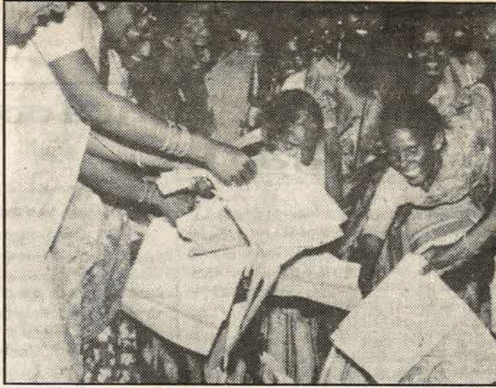
33 சதவீத இட ஒதுக்கீட்டை கேவலப்படுத்தி எழுதிய துள்ளக் பத்திரிகையை எரிக்கும் தமிழகப் பெண்கள் எழுச்சி அமைப்பினர்.

இன்று, 'போஸ் மாணவர் விடுதி பாலியல் பலாத்காரம்' இராஸ்தான் மாநிலத்தை உலுக்கி வருகிறது. பா.ஜ.க.