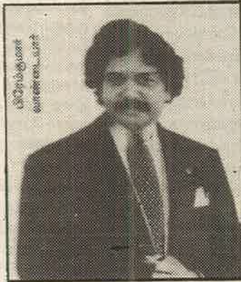
ஒட்டுக் கட்சிகள் - அதிகார வர்க்கத்தின் ஆதரவுடன் தனி இராச்சியம் நடத்திய வாண்டையார் சகோதரர்கள்.

இன்னும் இத்தனை நாளாகியும், போலீசின் தீவிர தேடலுக்குப் பிறகும் வாண்டையார்களைக் கைது செய்ய முடியவில்லை என்பது அதிகாரிகள் - போலீசு - ஒட்டுப் பொறுக்கிகள் கூட்டை, நட்பு மெலும் உறுதிப்படுத்தவே செய்கிறது.