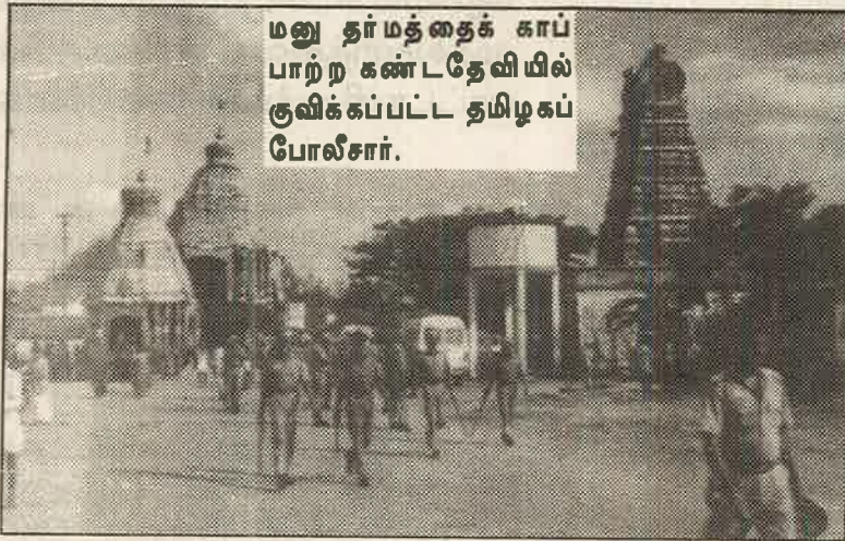
மனு தர்மத்தைக் காப்பாற்ற கண்ட தேவியில் குவிக்கப்பட்ட தமிழகப் போலீசார்.

நீதிமன்றமே நாட்டார்களுக்கு 'முதல் மரியாதை' தந்தும், நாட்டார்கள் 'தமக்குச் சமதையாக தாழ்த்தப்பட்டவர்களா?' என நீதிமன்றத் தீர்ப்பைக் கழிப்பறைக் காகிதமாக்கினர். மாவட்ட ஆட்சியர் தலைமையில் சமாதானப் பேச்சுவார்த்தை நடந்து,