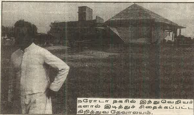
நரோடா நகரில் இந்து வெறியர்களால் இடித்துச் சிதைக்கப்பட்ட கிறித்துவ தேவாலயம்.

மும்பையில் வங்க தேசத்தவர்களை வெளியேற்றுவது என்ற போர்வையில் முஸ்லிம்களைத் துரத்தும் இந்துவெறியர்கள், குஜராத் மாநிலத்தில் வெளிப்படையாகவே சிறுபான்மை முஸ்லிம்களுக்கும்