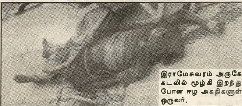
இராமேசுவரம் அருகே கடலில் மூழ்கி இறந்து போன ஈழ அகதிகளுள் ஒருவர்.