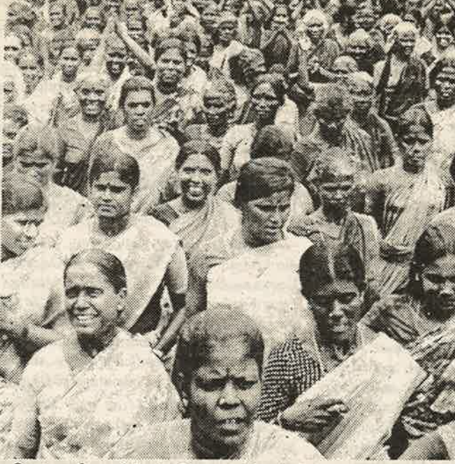
மேல்சாதி ஆதிக்கம் தொடர வேண்டும் என்பதற்காக ஊர்வலம் நடத்தும் கள்ளர் சாதிப் பெண்கள்.

'முதல் ஒரு மணி நேரம் நாட்டார்கள் தேரிழுப்பது, பிறகு தாழ்த்தப் பட்டவர்கள் இழுப்பது' என புதிய 'மனு நீதி' தீர்ப்பு வழங்கப்பட்டது. முதலில் ஏமாந்தோ, எப்படியோ, இதை ஏற்ற தாழ்த்தப்பட்ட சாதியினர், பின்னர் விழிப்புற்று, ஏற்க மறுத்தனர். நீதிமன்றத் தீர்ப்பை நடைமுறைப்படுத்த வலியுறுத்தினர். மாவட்ட ஆட்சியரோ 144 தடையுத்தரவு போட்டார்.