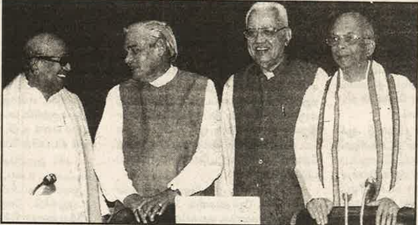
காவிரியின் மீதான தமிழகத்தின் உரிமையைக் காற்றில் பறக்க விட்ட மகிழ்ச்சியில் பூரித்துப் போகிறார்களோ?

காவிரி ஆணையத்தின் கீழ் அதிகாரிகளைக் கொண்ட கண்காணிப்புக் குழு,