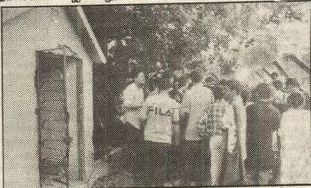
திடீர் சிவன் கோயிலை இடித்து நொறுக்கி இந்து வெறியர்களுக்குப் பாடம் புகட்டிய கல்கத்தா பிரசிடென்சி கல்லூரி மாணவர்கள்.

இச்செயலைக் கண்டு பீதியடைந்த விசுவ இந்து பரிஷத் மற்றும் அகில இந்திய வித்யார்த்தி பரிஷத் எனும் இந்து வெறி மாணவர் அமைப்பும், இக் கொடுஞ் செயலைக் கண்டித்து தேசிய அளவில் கிளர்ச்சிகள் நடத்தப் போவதாக சவடால் அடித்துவிட்டு, மாணவர்களின் போர்க் குணத்தைக் கண்டு பின் வாங்கிவிட்டது. அயோத்தியில் மகுதியை இடித்த இக்கயவாளிகள், வழிபாட்டுத் தலத்தை இடித்து, இந்துக்களின் மனைதப் புண்படுத்தக் கூடாது என்று இப்போது மாணவர்களுக்கு உபதேசித்து அறிக்கைகள் விடுக்கின்றனர்.