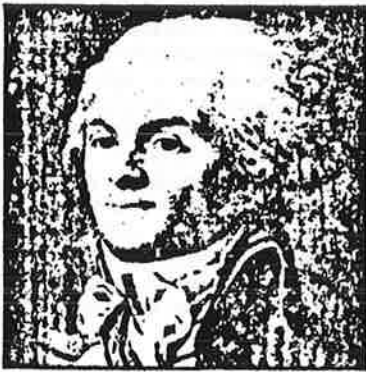
ரோபஸ்பியே (Robespierre): தனது 31 வயதிலேயே அசெம்பிளி உறுப்பினரான இவர் ‘ரூசோ’வின் தத்துவத்தைப் பின்பற்றுவார். ஜாகோபின் கழக முன்னோடி.

என்று விவசாயிகளின் அவலநிலையைப் பாடினான் ஒரு கவிஞன். பன்னாைகாலும், குறுநில மன்னர்களும், கிறித்தவ மடாலயங்களும் நாட்டைப் பங்குபோட்டுக் கொண்டிருந்தன. விவசாயி ஒண்டவந்தவளைப் போல துண்டு நிலத்தில் உயிரைவிட்டுக் கொண்டிருந்தான். காடுகளும் புல்வெளிகளும் மேட்டுக்குடியினரின் பரம்பரைச் சொத்தாக இருந்தது. வன விவங்குகளோ மேட்டுக்குடி இளவல்களின் வேட்டை விளையாட்டுக்காக பாதுகாக்கப்பட்டன. ஆம்! கண்ணைப் போல் போற்றி வளர்த்த தனது பயிரை குழிமுயல்கள் நாம் செய்தாலும் அவற்றைக் கொல்லும் விவசாயி குற்றவாளியானான்.