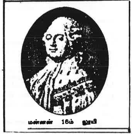
மன்னன் 16ம் ஓரயி