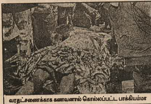
வரதட்சணைக்காக கணவனால் கொல்லப்பட்ட பாக்கியம்மா

பெரும்பாலும் வரதட்சணைக் கொடுமைக்கு ஆளாகிறவர்கள் இளம் பெண்களே! அதிலும் அநேகப் பெண்கள் திருமணமான இரண்டுவருடத்திற்குள் இந்தக் கொடுமைக்கு பலியாகின்றனர். இது வெறும் ஏழைப் பெண்களுக்கு மட்டும் நடக்கும்