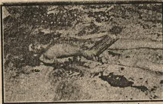
மறு கொடுக்கச் சென்றவர்களை அடித்துக் கொன்ற தயிலைப் போலீஸின் காட்டுமிராண்டித்தனம்

தொழிலாளர்களின் உழைப்பை சுரண்டி இந்த முதலாளிகள் அடிக்கும் கொள்ளை வருடத்திற்கு ரூ. 350 கோடி. தங்களின் தினக் கூலியை உயர்த்தக் கோரியும், வேலை நேரத்தைக் குறைக்கக் கோரியும் வேலை நிறுத்தம், மறியல் என்று மாஞ்சோலை தோட்டத் தொழிலாளர்களின் போர் குரல் ஒலிக்க ஆரம்பித்தது. இந்தப் போராட்டத்தை வளரவிட்டால் தங்களின் கொள்ளைக்கு ஆபத்து வந்துவிடுமோ என்று அஞ்சிய முதலாளிகளும், அவர்களின் கூலிப்படையான போலீஸும் பெண்கள், குழந்தைகள் உட்பட 600 பேரை ஜூன் 6,7 தேதிகளில் நடந்த ஆர்ப்பாட்டத்தில் கைது செய்த சிறையிலடைத்தது!