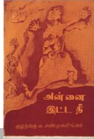
அன்னை இட்ட தீ

தேர்தலில் வெற்றிபெறுவதற்காக காங்கிரஸ் கட்சி தெலுங்கானா பிரிவினையை ஆதரிப்பதாகவும் தனி தெலுங்கானா உருவாக்கித் தருவதாகவும் சொன்னார்கள். கவனிக்க வேண்டிய விடயம் தென்னிந்திய மாநிலங்களில் வேறெந்த மாநிலத்தை விடவும் ஆந்திராவிலேயே காங்கிரஸ் கட்சிக்கு ஆதரவுத் தளம் அதிகம்.