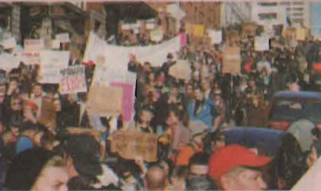
Seattle, WA சீயாற்றல்