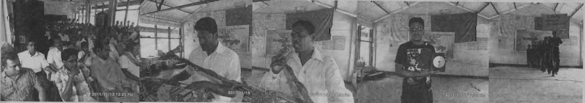
காவத்தையில் காலம் மாறுது நாட்டார் பாடல் இறுவெட்டு வெளியீட்டு இடம்பெற்ற போது எடுக்கப்பட்ட படங்கள்

நேசிப்பவர்கள் மிக சாதாரண நிகழ்வில் மிகப் பிரமாணமான உள்ளடக்கத்தைக் கொண்ட வெளியீட்டைக் கொண்டு வந்துள்ளனர் எனக் கூறியது இங்கு சிந்திக்க வேண்டிய விடயமாகும். தேசியக் கலை இலக்கியப் பேரவையின் சபரகழுவக் கிளையும் புதிய மலையகம் அமைப்பும் இணைந்து தந்துள்ள பாடல் இறுவட்டு எல்லோராலும் கேட்கப்பட வேண்டும் காலம் மாறுது என்ற தலைப்பிற்கேட்ப மலையகம் புதிய மாற்றத்திற்கான பாதையில் பயணிக்க சந்தேகமும் இல்லை வேண்டிய சிந்தனையை ஏற்படுத்தும் என்பதில் எந்த சந்தேகமும் இல்லை பெரும் கூட்டு உழைப்பில் வெளிவந்துள்ள இந்தப் படைப்பு வெற்றி பெற மக்களை நேசிப்பவர்களின் சார்பில் வாழ்த்துக்கள்