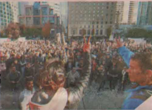
Vancouver, BC வன்சூவர்