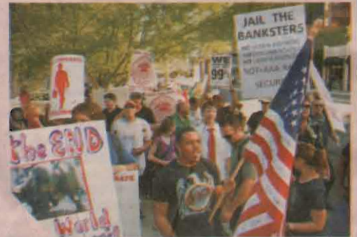
Phoenix, AZ - பொவனக்ஸ்