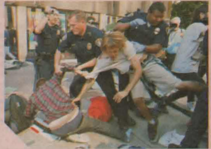
San Diego, CA - சான்டிகோ

முதலாளித்துவப் பெருவணிகக் கொள்ளையர்களை எதிர்த்து அமெரிக்காவில் தொடங்கி உலக நாடுகள் வரை வோல்ஸ்ட்ரீட் முற்றுகைப் போராட்டம்