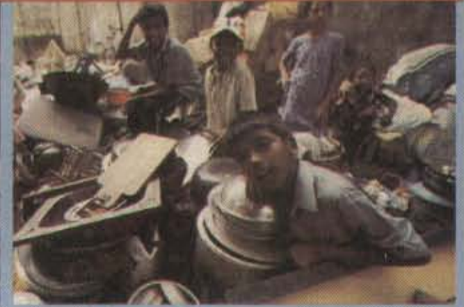
(மேலே) மகிந்த சிந்தனை ஆட்சியில் கொழும்பில் வீத உலகம்மட்டு வீதியில் விட்ட மக்கள் / (கீழே) சார்வாத ஆட்சியில் வன்னியில் இடம் பெயர்க்கப்பட்ட மக்கள்