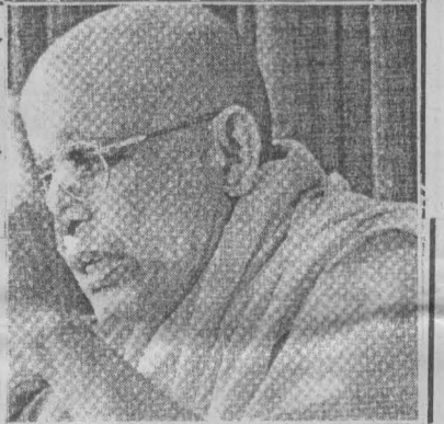
ராஜபக்ஷவால் எதுவும் செய்ய இயலாது.

விடுதலைப் புலிகள் சுத்த ராணுவக் கண்ணோட்டத்திலிருந்து விடுபட்டு வெகுசன அரசியலுக்கு முக்கியத்துவம் கொடுப்பதன் மூலமே அரசாங்கத்தின் பிரித்தானும் சூழ்ச்சிகளுக்கு இரையாகாமல் தமிழ் மக்களையும் அவர்களது விடுதலைப் போராட்டத்தையும் காக்க உதவ இயலும்.