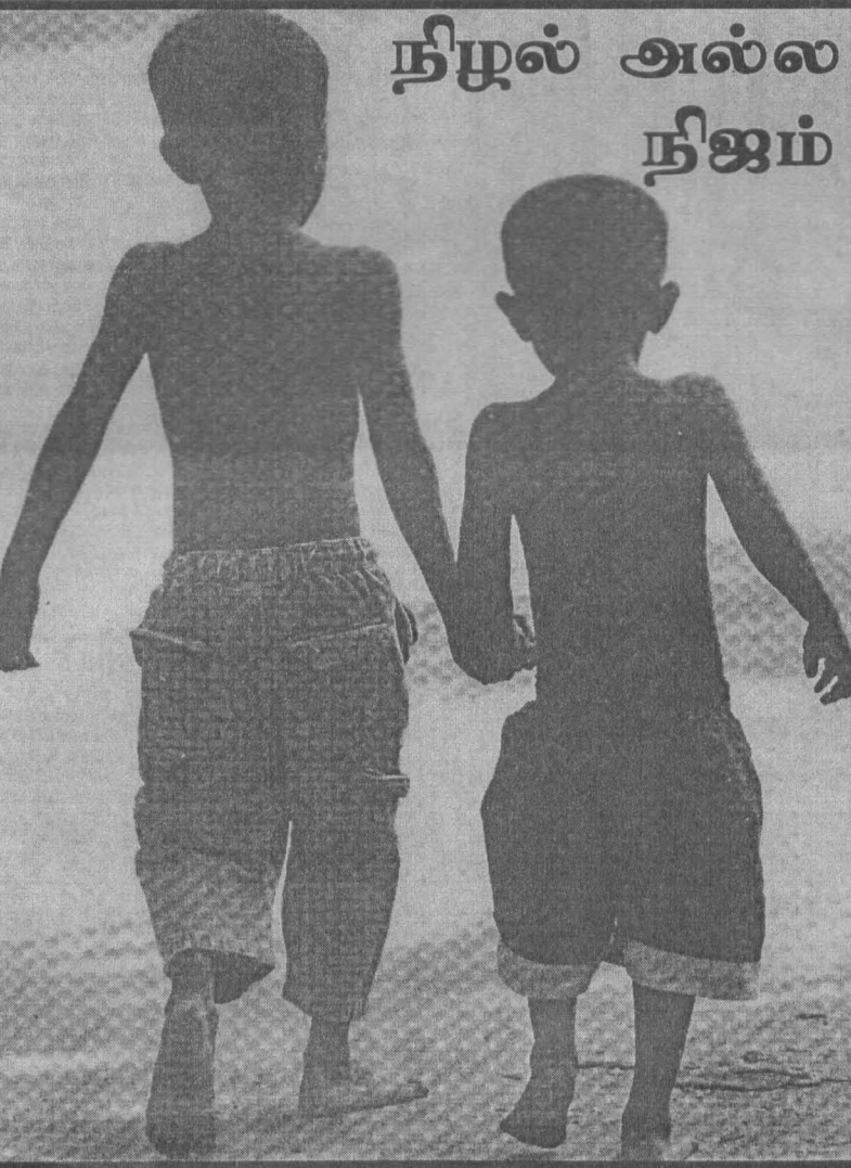
2006 ஏப்பிரல் 29 அன்று சம்பூர் மீது நடாத்தப்பட்ட விமானத்தாக்குதலில் அகதியாக்கப்பட்ட தமிழ்ச் சிறுவர்கள் இருவர் திசையறியாது நடந்து செல்லும் காட்சி.

எனவே யுத்தமாக்கப்பட்டுள்ள தேசிய இனப்பிரச்சினையில் மிகவும் நிதானமாகவும் தூரநோக்குடனும் முழுநாட்டினதும் அனைத்து மக்களினதும் எதிர்காலத்திற்கு உத்தரவாதம் வழங்கக் கூடிய விதமாக ஜனாதிபதி உறுதியான துணிவான முடிவுகளை மேற்கொள்ளவேண்டும். அத்