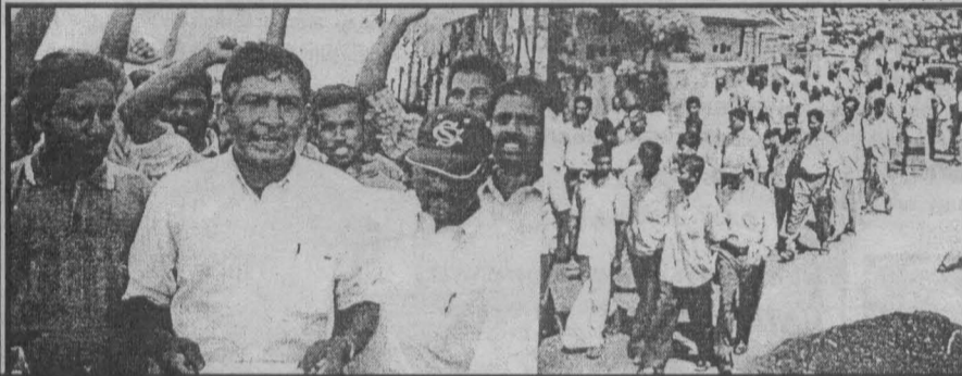
இந்திய அரசே சேது சமுத்திரத் திட்டத்தை உடனே நிறுத்து எனக் கோரி மன்னார் மீனவர்கள் யூலை 19ம் திகதி மன்னாரில் நடத்திய ஆர்ப்பாட்ட பேரணி. மன்னார் மீனவர் சங்கங்களின் சமூகம் இதனை ஏற்பாடு செய்தது.

இந்நிலையில் திருகோணமலை புத்தர் சிலை வைப்பும், புலிகள் இயக்க பொறுப்பாளர்கள் மீதான தாக்குதல்களும் ராணுவக் கட்டுப்பாட்டுப் பிரதேசத்தின் ஊடான புலிகளது பயண