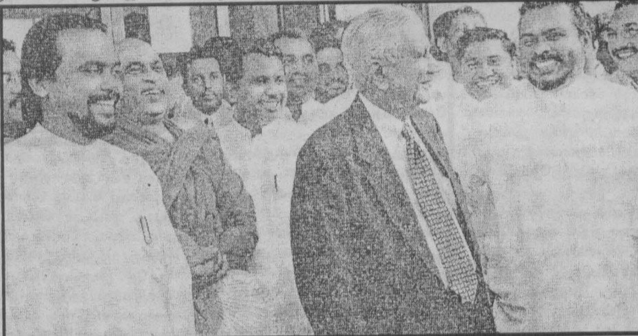
பொதுக்கட்டமைப்புக்கு எதிராக உயர் நீதிமன்றத்தில் மனுத்தாக்கல் செய்து அதில் தாம் வெற்றி பெற்று விட்டதாக எக்காளம்விட்டு சிரித்து ஜே.வி.பி.ஹெல உறுமய, மற்றும் பேரினவாதிகள் நீதிமன்ற வாசலில் நிற்கும் காட்சி

வமானதென ஏற்றுக் கொண்டிருந்தபோதும் அதனால் விதிக்கப்பட்டுள்ள தடையுத்தரவின் மூலம் வடக்கு கிழக்கில் நிவாரண மீளமைப்பு நடவடிக்கைகளை மேற்கொள்ள முடியாதுள்ளது. பொதுக்கட்டமைப்பை ஜே.வி.பி ஹெல உறுமய போன்ற பேரினவாத சக்திகள் மட்டுமன்றி குறுகிய தேசியவாத நிலைப்பாட்டையும் மத அடிப்படையான நிலைப்பாட்டையும் கொண்ட அனைத்து முஸ்லீம் தலைமைகளும் எதிர்த்தன. அவற்றின் தூண்டுதலாலேயே பொதுக்கட்டமைப்பை எதிர்த்து உயர்நீதிமன்றத்தில் சில மனுக்கள் தாக்கல் செய்யப்பட்டுள்ளன. உயர்நீதிமன்றத்தின் தடையுத்தரவை பற்றி தனியார் ஊடகங்கள் தவறான அர்த்தம் கற்பித்துள்ளன என்றும் அவ்வுத்தரவால் பொதுக்கட்டமைப்பை நடைமுறைப்படுத்த தடையே தும் இல்லை என்றும் ஜனாதிபதி சந்திரிகா தெரிவித்துள்ளார்.