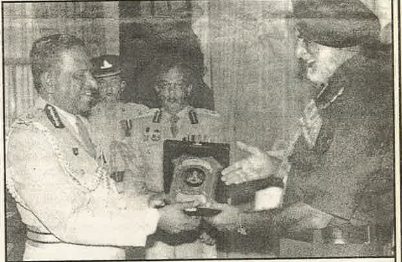
இலங்கை இந்தியாவுடன் செய்துகொள்ளவுள்ள பாதுகாப்பு ஒப்பந்தத்துக்கு முன்னோடி ஒத்திகையாக இந்தியாவின் தென்பிராந்திய தளபதி இலங்கை தளபதியை சந்தித்தாரா?