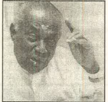
இன்று அமைச்சராகியும் விட்டார்.

ரீதியான அணிதிரட்டலின் பயனாக நகரசபை உறுப்பினராகி, மாகாணசபை உறுப்பினராகி, பாராளுமன்ற உறுப்பினராகி, பிரதமமைச்சராகி