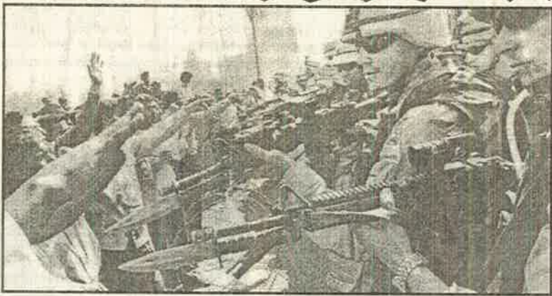
மொன்றிற்கு ஒரு இலட்சம் சிறு ஆயுதங்கள் களவாடப்படுகின்றன.

இத்தனை ஆயுதங்களையும் உலகில் விற்று இராணுவமயப்படுத்த சர்வாதிகார ஊழல் மிக்க அரசுகளுக்கு அமெரிக்கா முட்டுக் கொடுக்கிறது. உண்மையான வன்முறைக்கும் மக்கள் மீதான பயங்கரவாதத்திற்கும் அமெரிக்காவே துணைநிற்கிறது. அமெரிக்கா உலகில் 2001ம் ஆண்டில் விற்பனை ஆயுதங்கள் 1400 கோடி டொலர்கள் என மேலே குறிப்பிட்டோம். அதில் 39 விதமானவை வட ஆபிரிக்கா விற்கும், மத்திய கிழக்கிற்கும் வழங்கப் பட்டன. ஆசிய, பசிபிக் பிராந்தியத்திற்கு 22% ஆயுதங்கள் விற்கப்பட்டன. பிரிட்டன் 7.2% ஆயுதங்களை வட ஆபிரிக்கா, மத்திய கிழக்குக்கு விற்பது, பிரான்ஸ், வட ஆபிரிக்கா, மத்திய கிழக்கிற்கு 40% ஆயுதங்களை விற்பது, ரஷ்ய ஆயுதங்களில் வட ஆபிரிக்கா, மத்திய