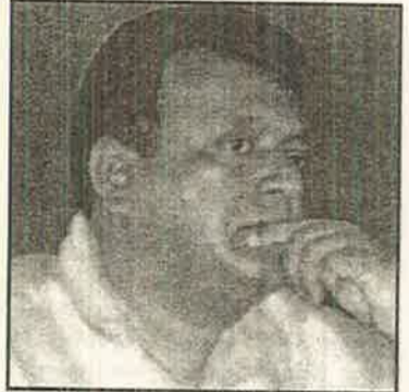
முன் குறிப்பிட்ட பின்னணியிலேயே இலங்கையின் தேசிய இனப்பிரச்சினையின் தீர்வுக்கான முயற்சிகளின் இன்றைய தேக்க நிலையைக் கவனிக்க வேண்டியுள்ளது. இலங்கையின் எந்த

புலிகளை அழிக்க விரும்புகிறது. இந்தியாவின் தலைமீட்டை வரவேற்று அல்லது கோரி வெளியிடப்படுகிற ஒவ்வொரு அறிக்கையும் இந்தியாவின் தூண்டுதலின் பேரிலேயே வெளியாகிறது என்ற கருத்து வலுப்பெறத் தொடங்கியுள்ளது.