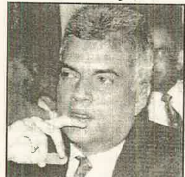
குழப்ப முயலுவதை நாம் திரும்பத் திரும்பக் கண்டு வந்திருக்கிறோம்.

எனினும் அமைதி மூலம் ஒருகட்சிக்கு அரசியல் ஆதாயம் கிடைப்பதை மறுகட்சி விரும்பவில்லை. அமைதியான தீர்வு பற்றிப் பேசிக்கொண்டே எதிர்க்கட்சி அமைதிக்கான முயற்சிகளைக்