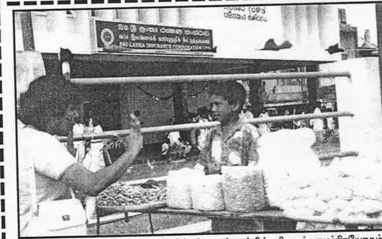
15.05.2003 அன்று யாழ். வீரசிங்கம் மண்டபத்தில் சிறுவர் துலுப்பிரயோகம் பற்றிய மாநாடு நடைபெற்றது. மாநாட்டு வாசலில் 10 வயதுக்குட்பட்ட சிறுவன் ஒருவன் கடலை விற்பதையும் மாநாட்டில் கலந்துகொண்ட பெண்மணி ஒருவர் பேரம்பேசி கடலை வாங்குவதையும் படத்தில் காணலாம்.

செய்யப்பட்டன. பகிரங்கமாக அறிக்கை செய்யப்பட்டிருந்தன. இதனாலேயே அக்கடைகளுக்கு நல்லூர் பிரதேச சபையினர் சீல் வைத்திருக்கலாம் என்று சந்தேகிக்கப்படுகிறது. இச்சட்ட முரணான நடவடிக்கைக்கு எதிர்ப்பு தெரிவிக்கப்பட்டுள்ளது.