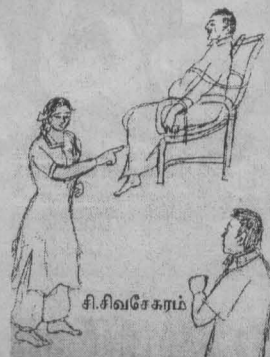
கனின் பாதிப்புகளை பகிர்ந்து கொள்வதற்கு இந்நாடகச் சுவடி உதவிசின்றது. நாடகப் பிரியர்களுக்கு மட்டுமன்றி தமிழ் மக்களுக்கு நல்லதொரு வரம்பிரசாதம் இந்நூலாகும்.

நாடகம் மூலம், மனித உணர்வுகள், உறவுகள் மீதும் ஏற்படுத்தும் கொடுமையான ஆட்சி அதிகாரத்தின் வன்செயல்