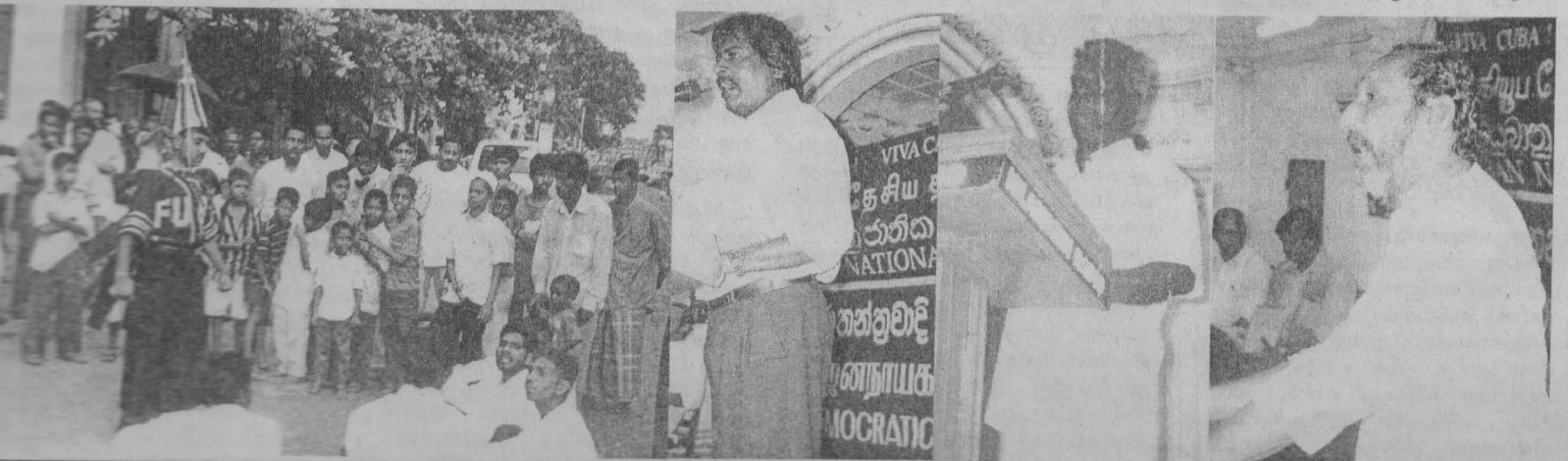
தமிழ்த் தேசிய ஆவணச் சுவடிகள்

வசந்த திவாநாயக்கவும், உரையாற்றினார். இறுதியில் புரட்சிப் பாடல்கள் பாடப்பட்டன.