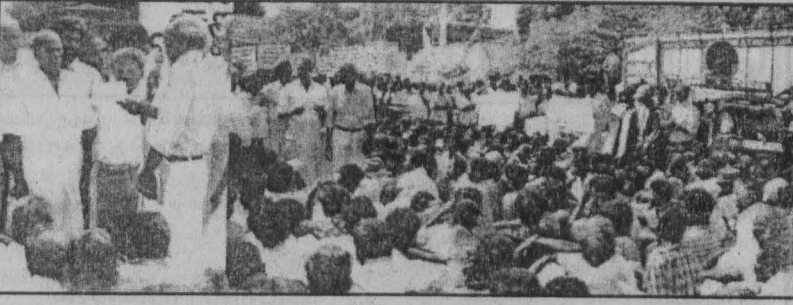
யாழ் செயலகம் முன்பாக மீனவர்களின் மறியல் போராட்டம்