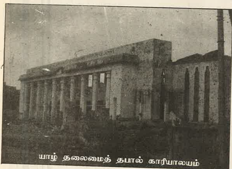
யாழ் தலைமைத் தபால் காரியாலயம்