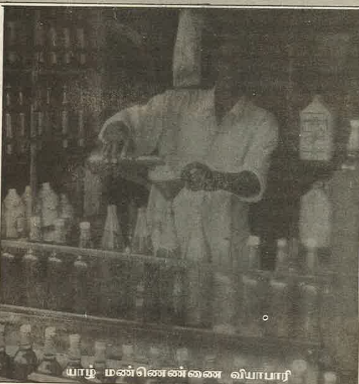
யாழ் மண்ணெண்ணை வியாபாரி

பேர் பெண்கள், மகன் ஒருவன் மட்டுமே வாழைக்குலை வியாபாரம் செய்து ஏதோ ஒரு மாதிரி சமாளிக்க முடிகிறது. பலாலியில் சொந்தக் கல்வீடும், பதினைந்து பரப்புத் தோட்ட நிலமும் இராணுவத்திடம் பறி கொடுத்து விட்டு வெறும் கையுடன் நான்கு வருடங்களுக்கு முன்பு வெளியேறினோம். எங்கள் செம்மண் தோட்டம் பொன்விளையும பூமியாகும். எழுபது-எழுபத்தேழு காலகட்டத்தில் தோட்ட வருமானத்திலேயே எங்களில் பலர் கல்வீடு கட்டினோம். இன்று ஒருவேளை சாப்பாட்டிற்கே கஷ்டப்பட வேண்டியுள்ளது. ஒவ்வொரு முறையும் சமாதானம் பற்றிய பேச்சு எழும் போது நாங்கள் எங்களது சொந்த இடத்திற்கு போவது பற்றியே கனவு காண்போம். இதெல்லாம் வெறும் பேச்சாக இருக்கிறதே