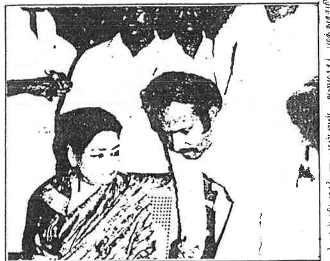
1988மார்ச் 17 - முன்னாள் அமைச்சர் முத்துசாமி