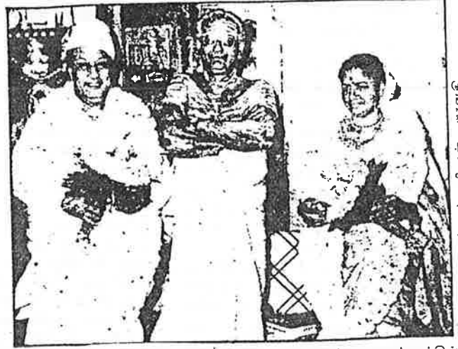
எம்.ஜி.ஆர். வி.என். ஜானகி சாண்டோ சின்னப்பா தேவர்