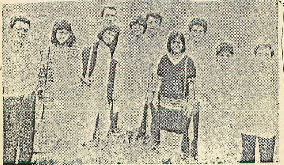
ஜப்பானியர்களும் இறக்குமதி செய்யப்பட்ட அவர்களது பிலிப்பைஸ்ஸ்

இது ஒரு புதுவிதமான சமூக பொருளாதார, கலாசார ஆக்கிரமிப்பு என பல விமர்சகர்கள் ஜப்பானைக் குற்றம் சாட்டியுள்ளனர்.