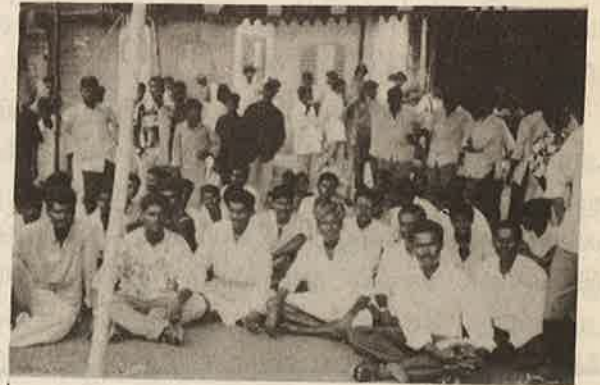
திடீர் முற்றுகை போர்