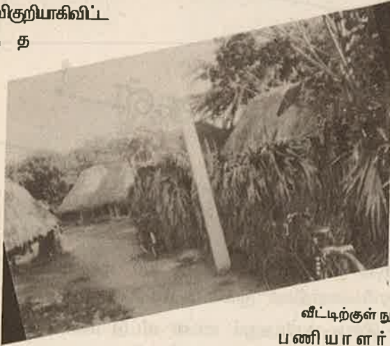
வீட்டிற்குள் நுழையும் சாக்கடை