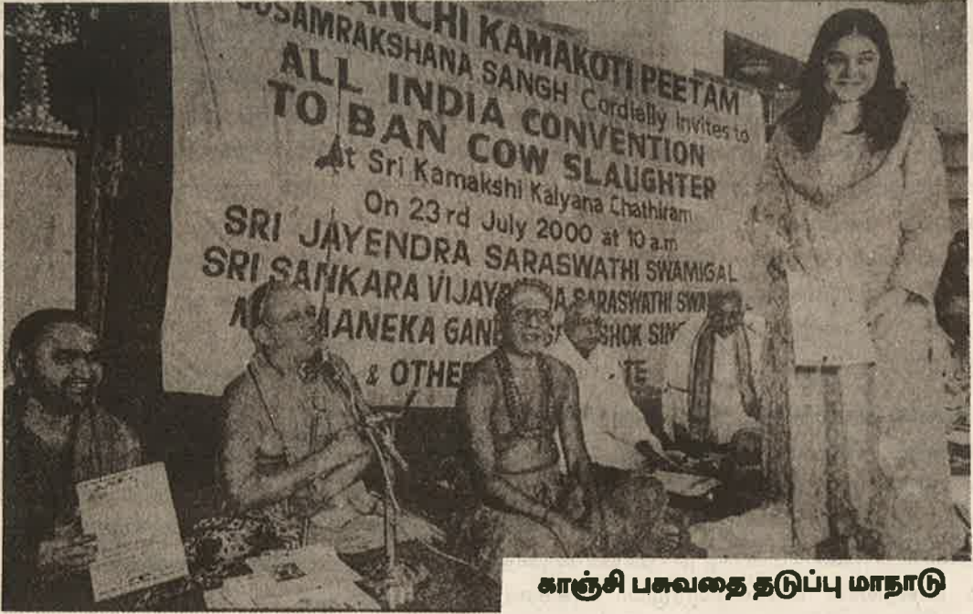
காஞ்சி பசுவதை தடுப்பு மாநாடு

ஆகையால் நால்வகையினரும் தம் இனத்திற்கு ஏற்படைய கருமங்களை செய்து மூன்று குணங்களின் பாதிப்பிலிருந்து விடுபட வேண்டும் என்றும் கீதை