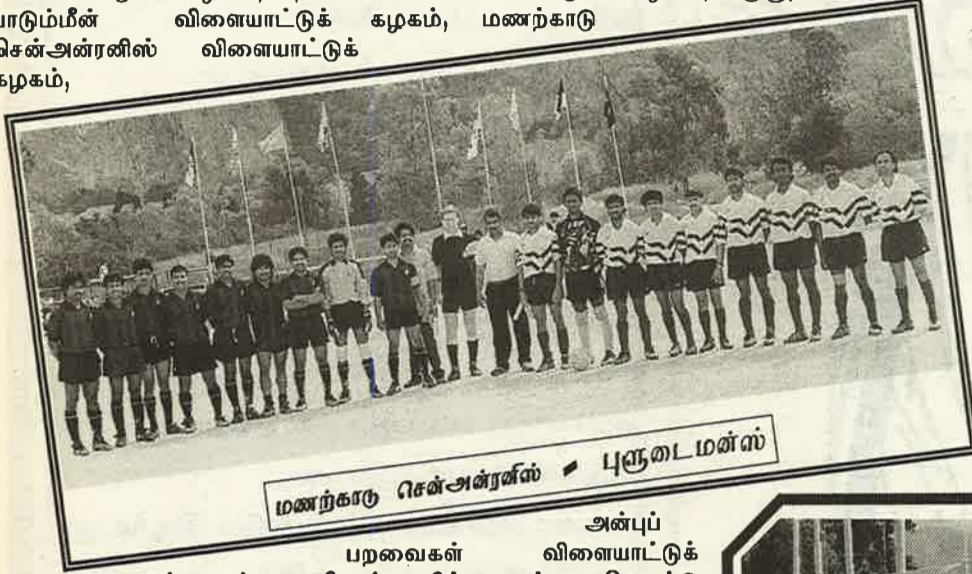
மணற்காடு சென்அன்ரனிஸ் / புளுடைமன்ஸ்

விளையாட்டுக் கழகம் வெற்றி கண்டு மூன்றாம் இடத்தைப் பெற்றுக் கொண்டது. இறுதிப் போட்டிக்கு சென் அன்ரனிஸ் விசுமகமும், அன்புப் பறவைகள் விசுமகமும் தெரிவு செய்யப்பட்டன. இதைத் தொடர்ந்து பிற்பகல் 2.30 மணியளவில் திலீபன் தமிழ்ப் பாடசாலை மாணவர்களின் மெய்வல்லுனர் போட்டிகள் ஆரம்பமாயின. ஒரு முழுமையான மெய்வல்லுனர் நிகழ்ச்சிக்குரிய வசதிகள் போதாமையால் மைதான நிகழ்ச்சிகள் எதுவும் நடைபெறாமல், சவட்டு நிகழ்ச்சிகள் மட்டுமே நடைபெற்றன. திலீபன் தமிழ்ப் பாடசாலை மாணவர்கள், கப்டன் மில்லர் இல்லமாகவும் அன்னை யூபதி இல்லமாகவும் இரு அணிகளாகத் தெரிவு செய்யப்பட்டு போட்டிகளில் கலந்து கொண்டனர். நீண்ட இடைவேளைக்குப் பின்னர், மெய்வல்லுனர் போட்டிகளில் கலந்து கொண்ட சிறார்கள் உற்சாகமாகவும், மகிழ்ச்சியாகவும் காணப்பட்டனர். மெய்வல்லுனர்