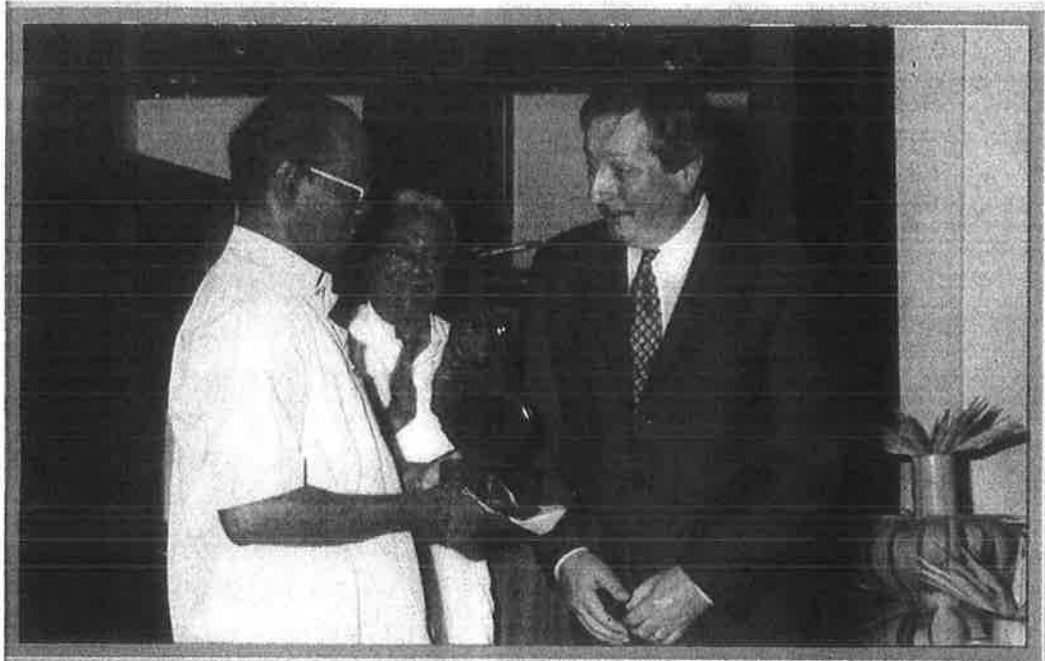
Award presentation ceremony at Sarvodaya Head Quarters in Moratuwa. UNICEF Chief presented Award to NVDAG Secretary.