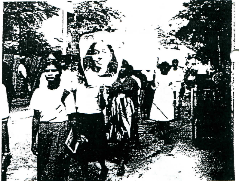
Peace march commemorating Rajani Thiranagama in Jaffna