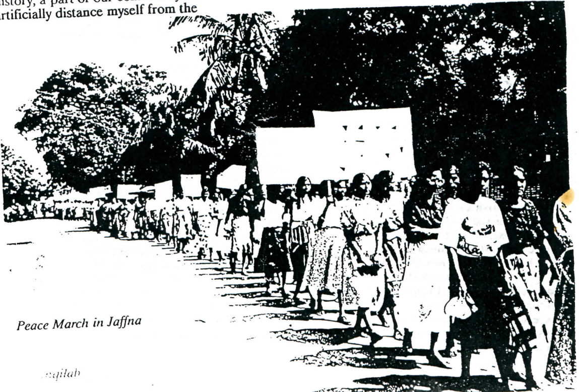
Peace March in Jaffna