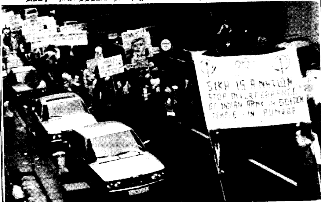
சீக்கியர்களின் "காலிஸ்தான்" போராட்டம். கடல் ஸ்டூட்கர்ட்

மதத்தாலும், ஆனத்தாலும் மக்களேப்பிரிந்தாலும் ஆட்சி ஏகாதிபத்தியத்திற்கு புதியதல்ல. சுரண்டப்படும் மக்களின் சுவாங்களை மதவாதத்திலும், ஆனவாதத்திலும் திசைதிருப்பி சுரண்டப்படும் மக்களுக்கிடையில் குளற