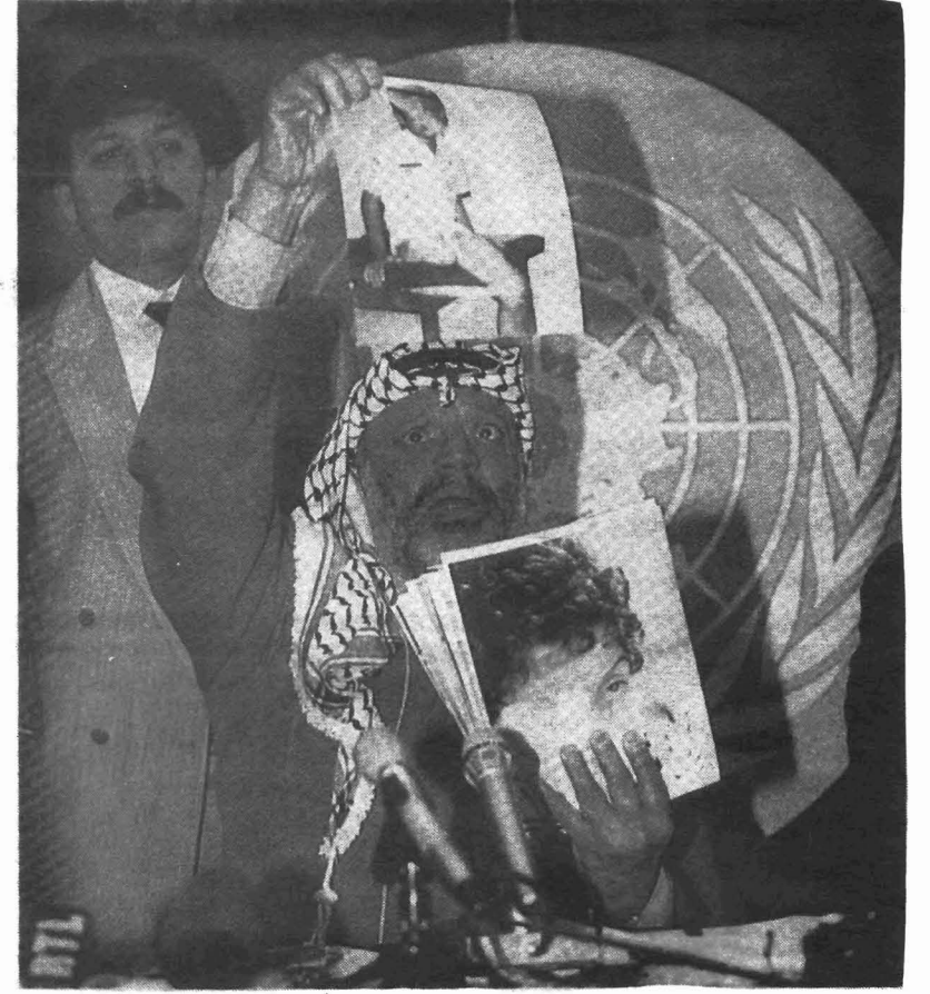
பி.எல்.ஓ தலைவர் அரபாத், இஸ்ரவேலின் தாக்குதல்களுக்கு உள்ளானவர்களின் தகவல்களை ஐ.நா சபையில் சமர்ப்பிக்கிறார்.

இஸ்ரவேல் தரப்பில் இஸ்ரவேல் பிரதமமந்திரி இணக்கம் தெரிவித்துள்ள பேதிலும் வீடமைப்பு மந்திரி இதற்கு மறுப்பு தெரிவித்ததோடு அரசை இராஜினாமா செய்யுமாறும் அதிருப்தி தெரிவித்துள்ளார்.