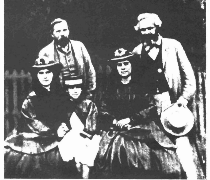
கார்ல் மார்க்ஸ் பிரெடெரிக் எங்கெல்ஸ் கார்ல் மார்க்ஸின் புதல்வியருடன்: ஜென்னி, எலியனோரா, லெனரா. 1864

இருந்து ஒரு புரட்சிகரமான சஞ்சிகையை வெளியிடுவது என்று எல்லையைத்தாண்டி ஜேர்மனிக்குள் அனுப்பிவைப்பதென்று ஆலோசித்து அவர் வெளிநாட்டுக்குப் போக முடிவு செய்தார். இருக்கின்ற எல்லாவற்றையும் கடுமையாக விமர்சிப்பது அந்தச் சஞ்சிகையின் நோக்கம் என்று அவர் திட்டமிட்டார்.