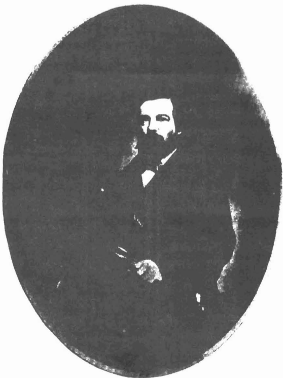
பிரெடெரிக் எங்கெல்ஸ். 1864

ஞான ஆராய்ச்சிகளில் ஈடுபடுவதும் போன் நகரத்தில் ஒரு பேராசியப்பதவியைப் பெறுவதும் அவருடைய உத்தேசமாக இரு