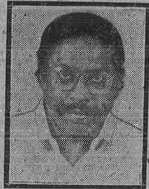
வலம்புரிஜான் சித்தர் வலம்புரிஜான்