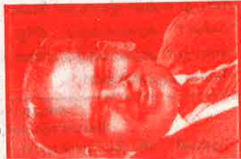
சித்த மருத்துவ மேதை :

மருத்துவத் துறையில் 45 ஆண்டுகள் அனுபவம் பெற்றவர். அரசினர் சித்த மருத்துவக் கல்லூரியில் மருத்துவ அதிகாரியாக பாரதிநியவர். 73 வயது நிரம்பியவர். அரிமா இயக்கத்தில் 'எய்ட்ஸ் நோய் பிரிவினா' மதுரை மாவட்டத்திற்குத் தலைவராகவும் பாரதிநியவர். எகிப்து, இஸ்ரேல், ஜோர்டன் நாடுகளுக்குச் சென்று எய்ட்ஸ் சிகிச்சை முறைகளை விளக்கி வந்தவராகவும் இருப்பவர்.