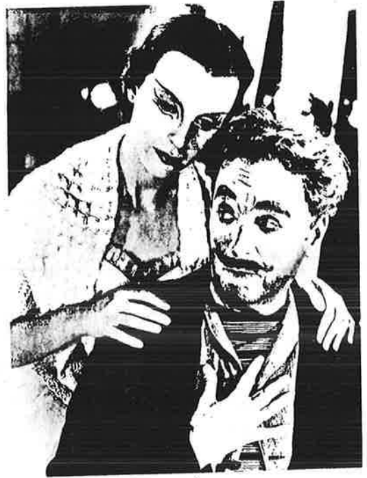
Limelight, 1953 Mit Claire Bloom

“லைம்லைற்” படம் பத்திரிகையாளர்களின் ஒருமித்த பாராட்டுகளைப் பெற்றது. “சார்லி வழமைக்குத் திரும்பி விட்டார்” என்றும், “பழைய சார்லியை இப்போது பார்க்கிறோம்” என்றும், பத்திரிகைகள் பாராட்டின. படத்தை ஐரோப்பிய நாடுகளில் வெளியிடச் சார்லி விரும்பினார். மனைவி, குழந்தைகளுடன் ஐரோப்பாவுக்குச் சென்று வரவும் விருப்பம் சார்லிக்கு இருந்தது.