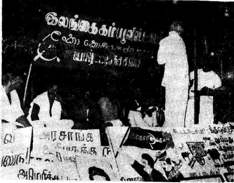
1964ஆம் ஆண்டின் பிரமாண்டமான மேதினக் கூட்ட மேடையில் இடமிருந்து நான்காவதாக அ மர்திருக்கிறார்.