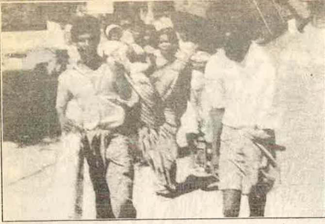
அகதிகளை இந்தியா கட்டாயப் படுத்தவில்லை?

தரப்பில் இருந்து பலமுறை கூறக் கேட்டுள்ளோம்.