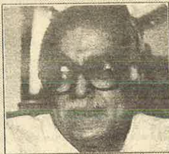
அயோத்தியில் கோவில் கட்டுவதென்பது, தேசத்தின் நம்பிக்கை பற்றிய பிரச்சினை

தடைகளை உடைத்தெறிந்து. ஜெய் ராம், “ராமரின் குழந்தைகள் நாம்” எனக் கோஷம் எழுப்பியபடி மசூதியின் மேலேறி வெற்றிக்கொடியைப் பறக்கவிட்டனர். இதன் போது மசூதியின் சில பகுதிகள் சேதமாக்கப்பட்டது. இந்த ரகனையின் பின் கைதான அத்வானி “அயோத்தியில் கோவில் கட்டுவது தேசத்தின் நம்பிக்கை பற்றிய பிரச்சினை. அரசில் பிரச்சினையல்ல” என்று குறிப்பிட்டார். இதனைத் தொடர்ந்த அரசியல் மாற்றங்களைத் தொடர்ந்து, 1992இல் நடந்த பொதுத் தேர்தலில் 120 பாராளுமன்ற ஆசனங்களையும், உத்தரப்பிரதேசம் உட்பட நான்கு மாணில ஆட்சியையும்