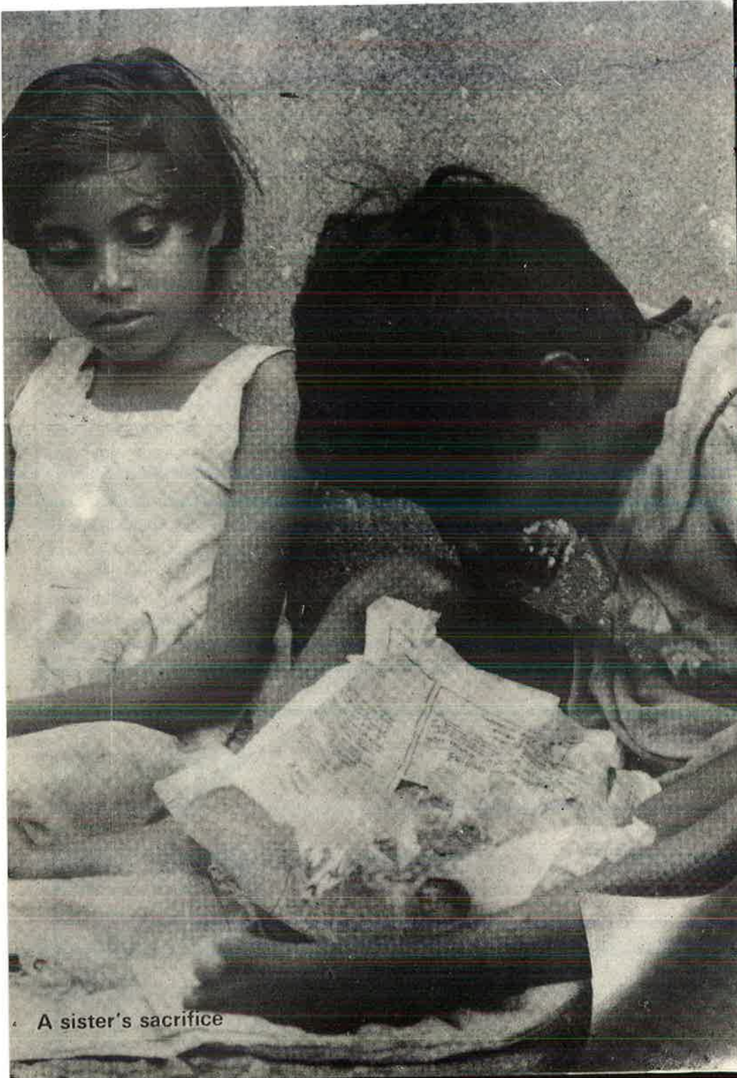
A sister's sacrifice