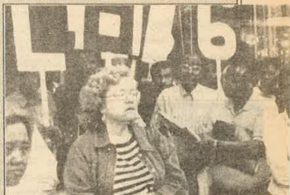
மசோதாவிற்கு எதிரான ஆர்ப்பாட்டம்.

உபகுழுவுக்கு 91 கார்த்திகை 25, இவ் குடிவரவு தொடர்பாக இவர் அளித்த அறிக்கையில் "நாம் இது விடயமாக மிக ஊக்கத்தோடேனையே இயங்கி, இந்த நாட்டில் இருப்பதற்கு எவ்வித உரிமைகளும் அற்றவர்களை அகற்றவும், நாடுகூடத்தவும் செய்யும் நோக்கமுடைய