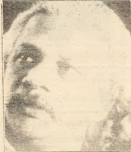
- அடூர் கோபாலகிருஷ்ணன் -

சிறந்த நாடக எழுத்தாளராகவும் பரிண மித்தார். திரைப்படக்கல்லூரியில், புலமைப் பரிசில் பெற்று, பயின்று உத்வேகம் பெற்று, இளம் இயக்குனராக வெளிவந்த கோபால கிருஷ்ணன், 1972ம் ஆண்டில் உருவாக்கிய முதல்திரைப்படமான கயம்வரம், சிறந்த படம், சிறந்த நெறியாளர் உள்ளிட்ட பல தேசிய விருதுகளையும், மாநிலவிருதுகளை யும் பெற்றுக் கொடுத்ததோடு சர்வதேச திரைப்பட விழாக்களில் இவருக்குக் கணிப் பையும், பாராட்டையும் பெற்றுத் தந்தது. கொடியோட்டம், எலிபதாயம், முகாமுகம் (சில காலத்துக்கு முன்னர் இதே ஆசியத் திரைப்பட மையத்தினரின் ஏற்பாட்டில் நடந்தேறிய எண்பதுகளின் இந்தியக்