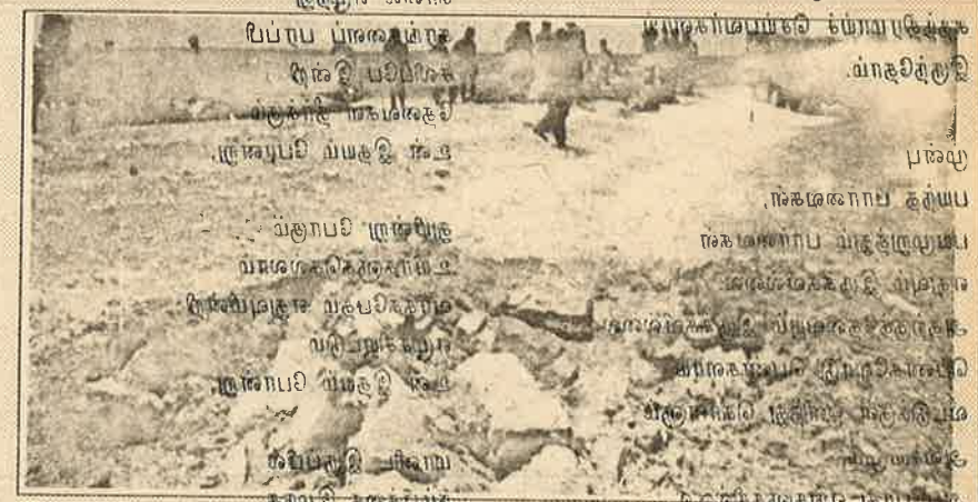
புகைப்படச் சான்று: கண்ணிவெடி நிகழ்ந்த இடம்.