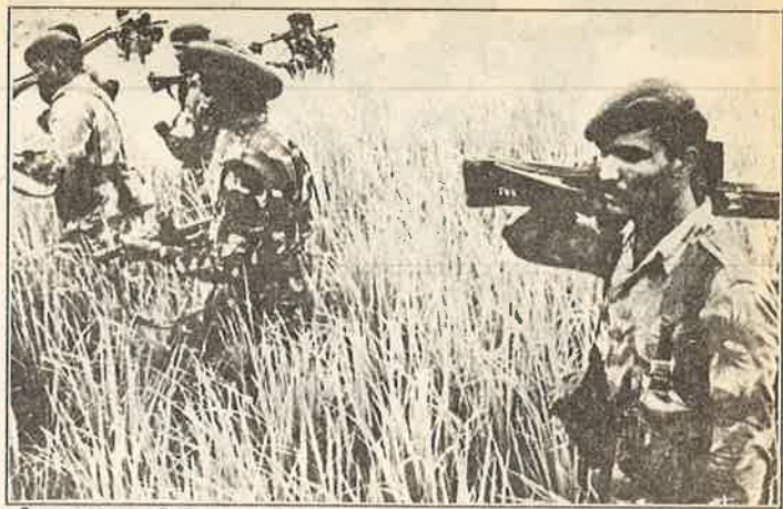
மீண்டும் இந்தியப்படை: நடைமுறைச்சாத்தியமற்றது