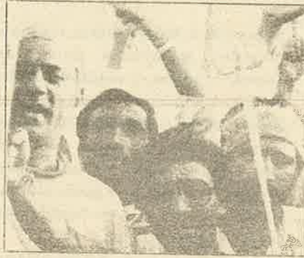
கரசேவகர்கள்: இராமருக்கு வெற்றி?

ஆதாரமற்ற விடயங்களுக்கு விடைகாண முற்படுவது இன்று அத்தியவசியமான ஒன்றுதானா? இன்று இந்தியாவில்