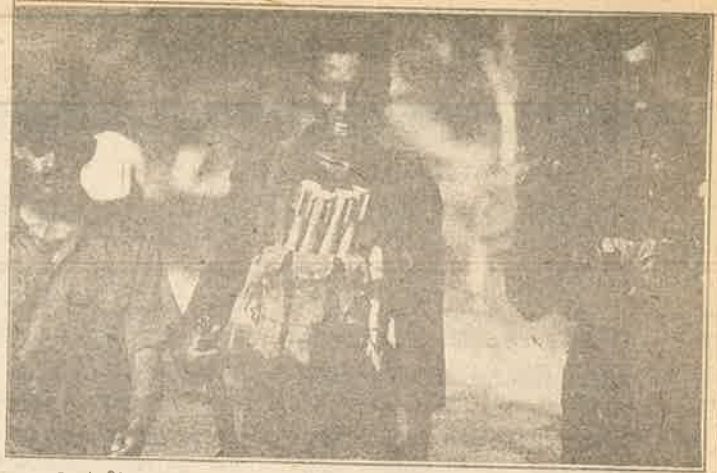
அரசியற்றீர்வையே வலியுறுத்துகின்றேன் இராணுவத்தீர்வையல்ல

அருவி: கடந்த 6 அல்லது 7 வருடங்களில் தமிழ் மக்கள் சொல்லொணாத