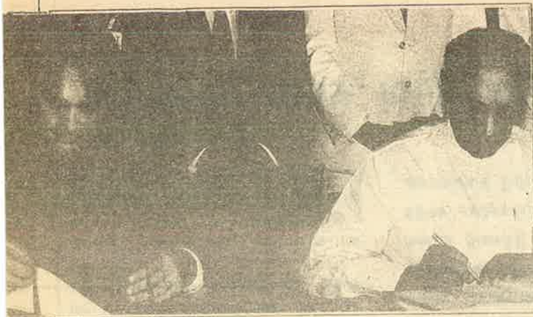
இந்திய இலங்கை ஒப்பந்தம் இன்னும் சாகவில்லை

சந்தரலும் ஒன்றான ஈழத்தமிழர்களின் பிரச்சினை தமிழகத்தமிழர்களின் மத்தியில் அனுதாப உணர்வுகளை ஏற்படுத்தியது. ஈழத்தமிழர் பிரச்சினை முற்று முழுதாக இலங்கையின் உள்நாட்டு விவகாரமல்ல என்ற நிலைப்பாட்டை இந்திய அரசு கொண்டிருந்தது. அத்துடன் ஈழத்தமிழ் மக்களின் பாதுகாப்பையும் கௌரவத்தையும் அவர்களது நியாயமான அபிமானங்களையும் ஐக்கிய இலங்கைக்குள் உறுதிப்படுத்தும் ஒரு தீர்வுக்குப் பின்னரே அகதிகள் திருப்பி அனுப்பப்படுவர் என்று கூறியுள்ளது. ஆனால் தற்சமயம் தொடர்ந்து கொண்டிருக்கும் யுத்தத்தின் மத்தியில் அவர்களின் உயிர்களுக்குப் பாதுகாப்பற்ற சூழ்நிலையில், எந்த ஒரு அரசியற் தீர்வும் புலப்படாத நிலையில் ஆயிரக்கணக்கான அகதிகள் திருப்பி அனுப்பப்பட்டுள்ளனர். இதையீட்டு உங்கள் கருத்தென்ன?