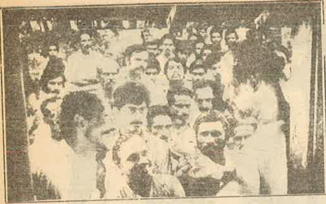
முகாமுகம் : நாயகன் பற்றி யாருக்குமே தெரியாது.