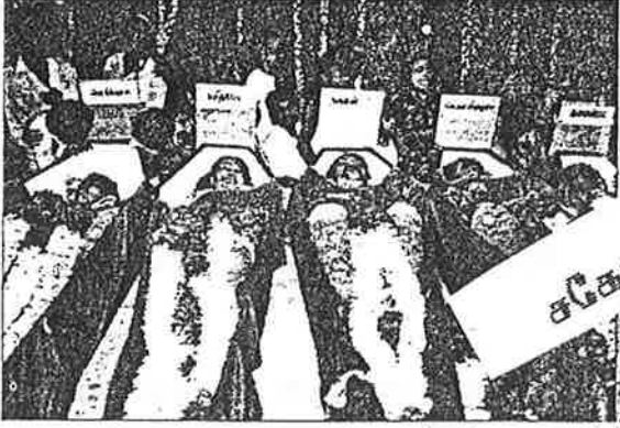
■ Slain EPRLF members: swift and merciless strike